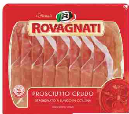
Prosciutto crudo stagionato i Firmati Rovagnati g 95