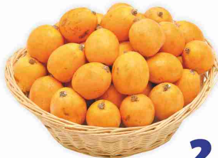
Nespole vaschetta g 500