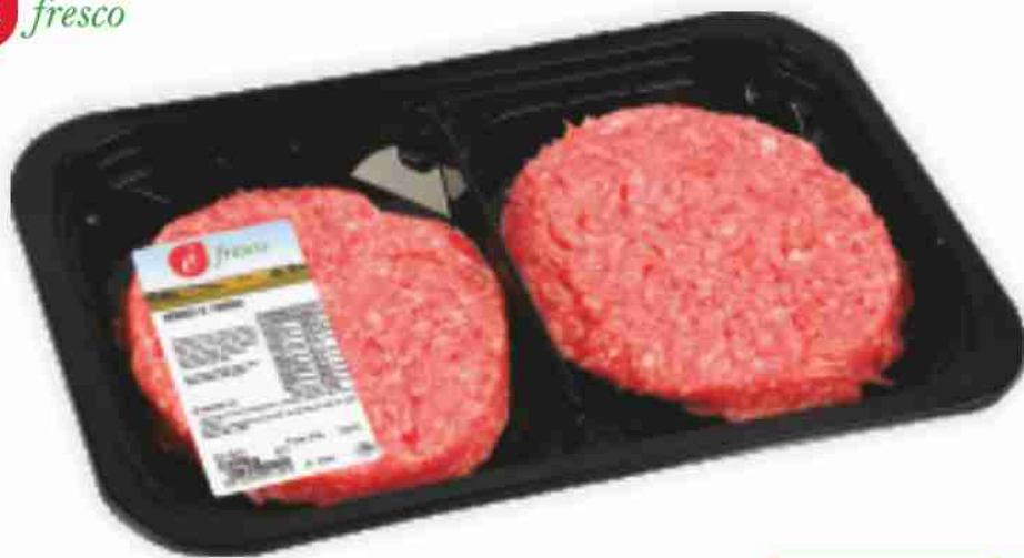
Hamburger al formaggio È Fresco g 150x2