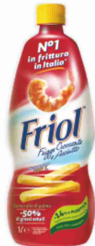
Olio per friggere Friol litri 1