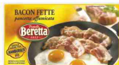
Bacon fette Beretta g 100