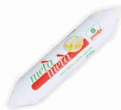
Burro metà metà Prealpi g 250