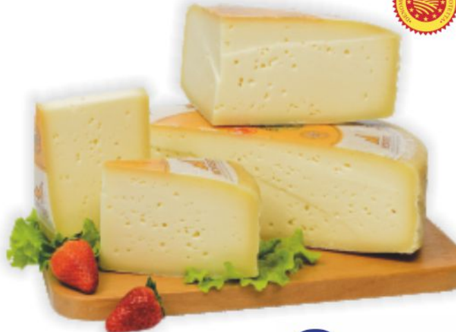
Montasio D.O.P. al kg 9,90