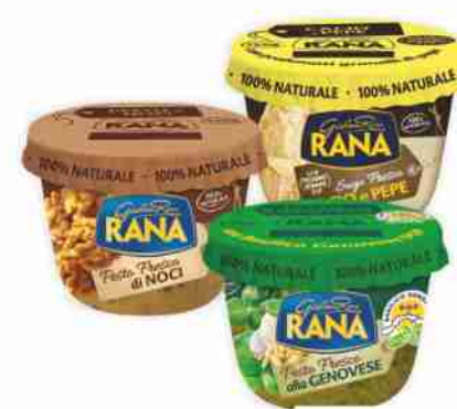
Sughi freschi Rana vari tipi da g 140 a g 225