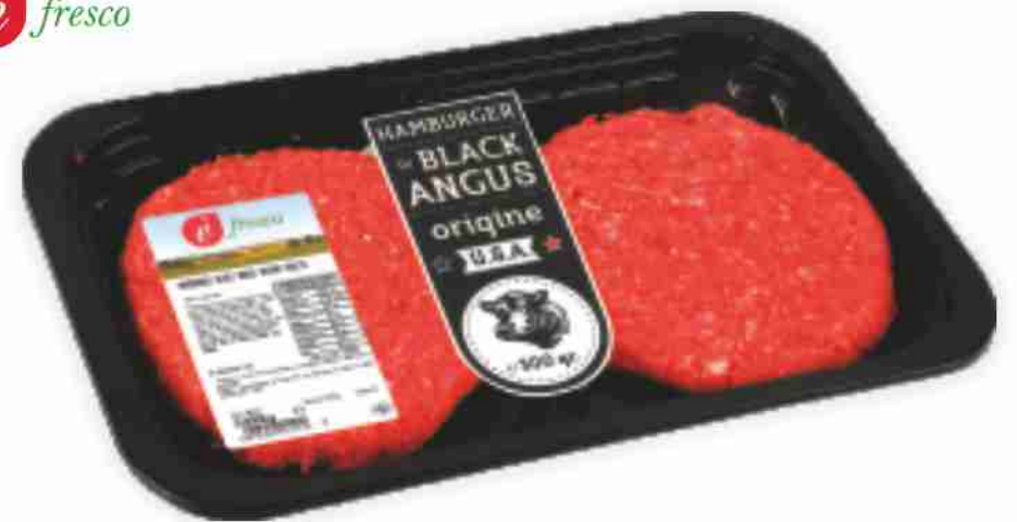
Hamburger di Black Angus È Fresco g 150x2