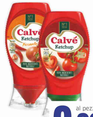
Ketchup Calvé classico, piccante ml 250