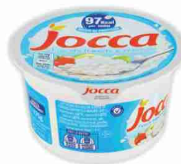
Fiocchi di latte Jocca g 175