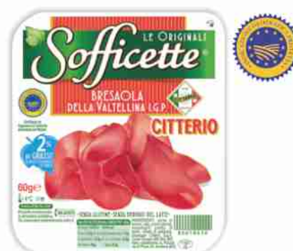
Bresaola della Valtellina I.G.P. Sofficette Citterio g 60