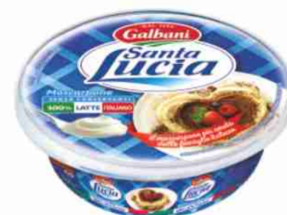
Mascarpone Santa Lucia Galbani g 250