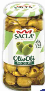
Olive snocciolate Olivoli Saclà g 290, sgocc. g 120