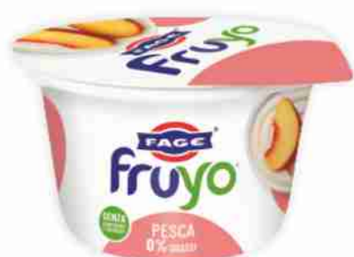
Yogurt colato Fage Fruyo 0% grassi, vari gusti g 170