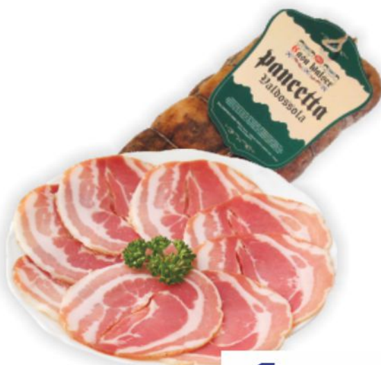
Pancetta Valdossola Casa Walser al kg 13,90