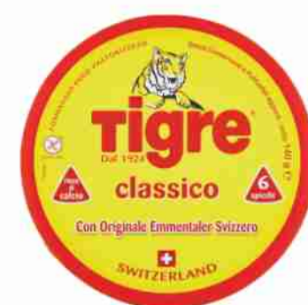
Formaggi Tigre g 140