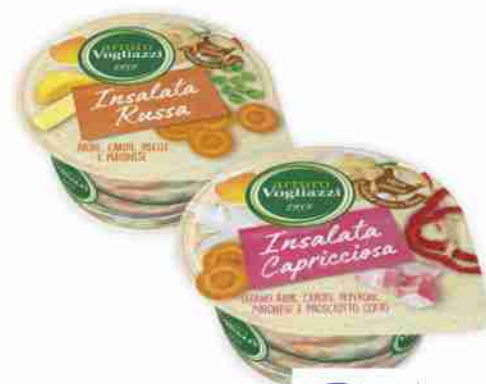
Insalate Vogliazzi capricciosa, russa g 150