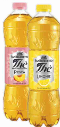
Thè San Benedetto limone, pesca litri 1,5