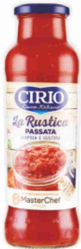
Passata La Rustica Cirio g 680