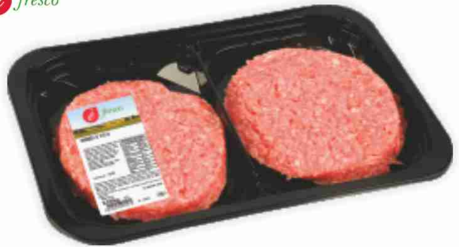
Hamburger di vitello È Fresco g 120x2