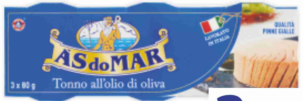
Tonno all'olio di oliva As do Mar g 80x3