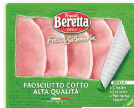
Prosciutto cotto Fresca Salumeria Beretta g 120