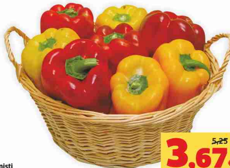
Peperoni misti vaschetta