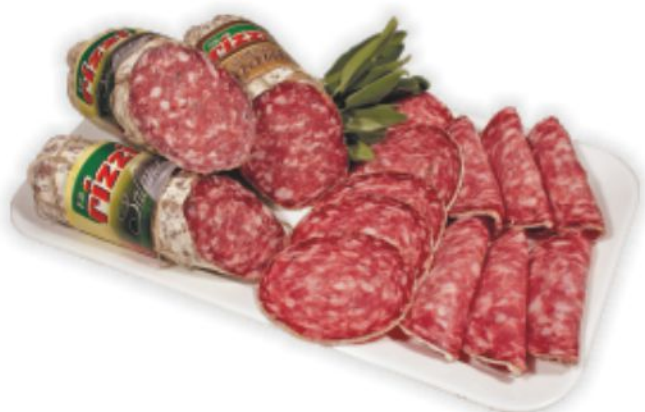
Salame campagnolo Rizzi al kg 11,90