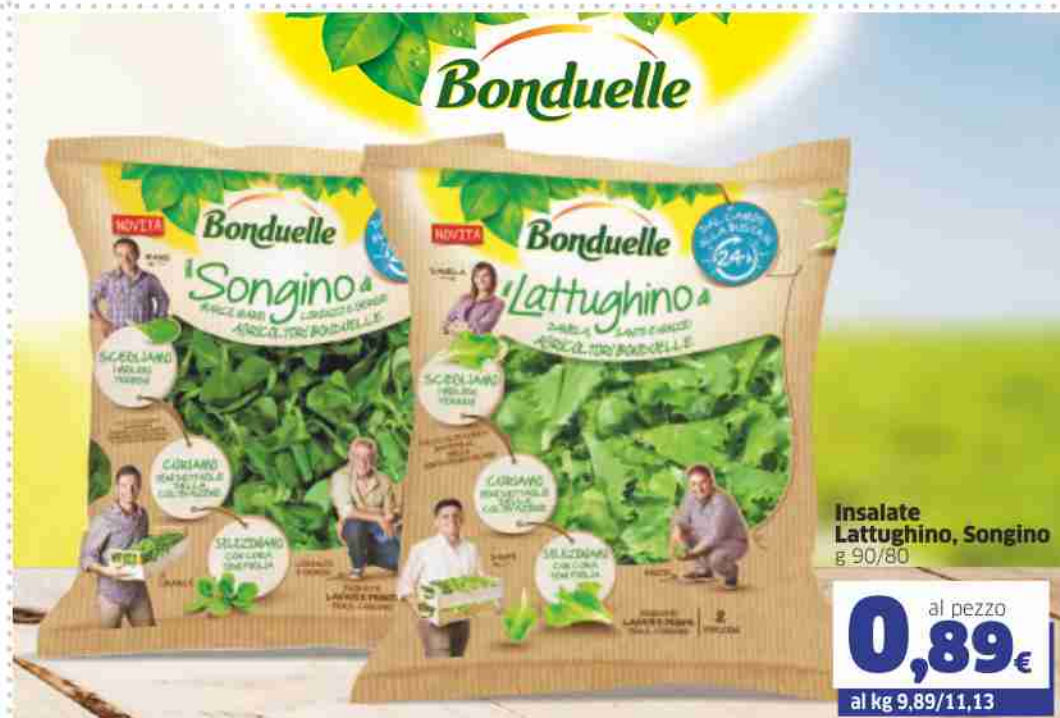
Insalate Lattughino, Songino g 90/80