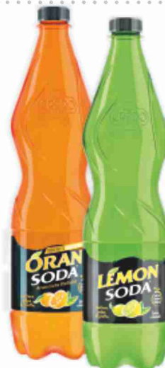
Lemonsoda/Oransoda litri 1,25