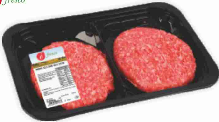
Hamburger di scottona È Fresco g 100x2