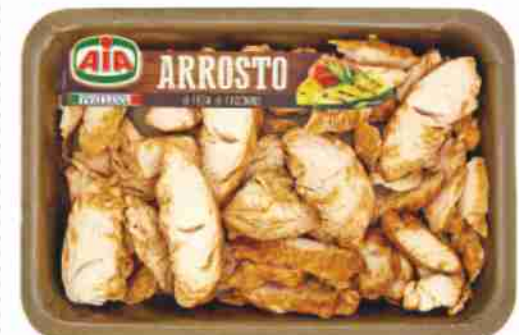
Arrosto di fesa di tacchino Aia g 350