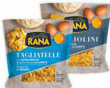
Pasta fresca Sfogliagrezza Rana vari formati g 250