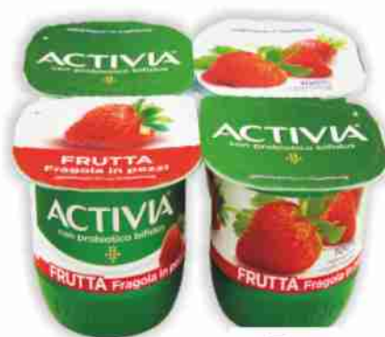
Yogurt Activia vari tipi g 125x4