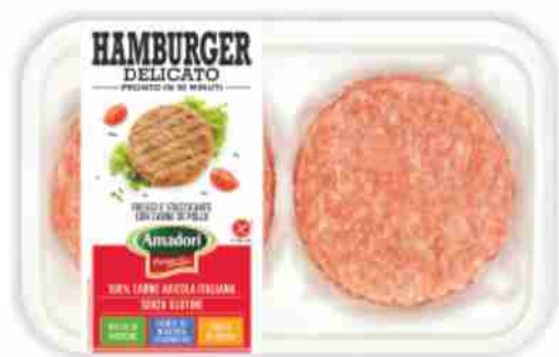
Hamburger di pollo Amadori g 204