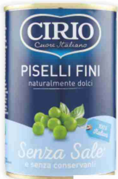
Piselli fini Cirio g 410