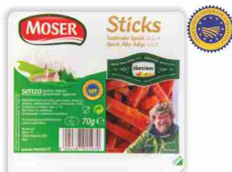
Sticks di speck Alto Adige I.G.P. Moser g 70