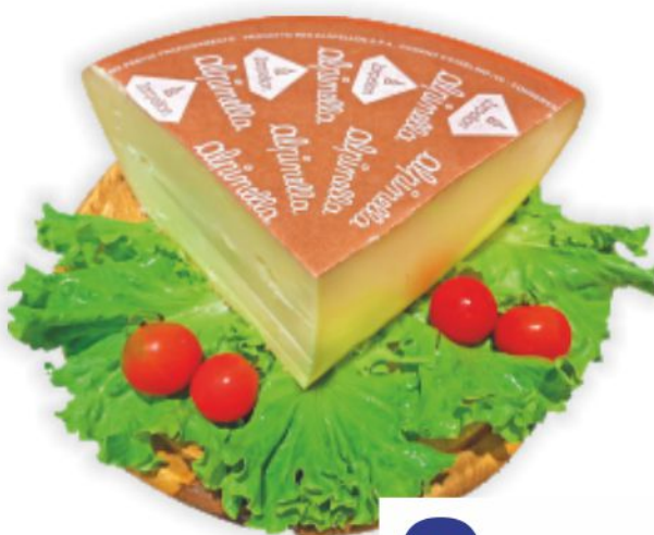
Fontal Alpinella Zarpellon al kg 5,90