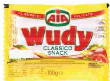
Wurstel Wudy Aia pollo e tacchino g 100