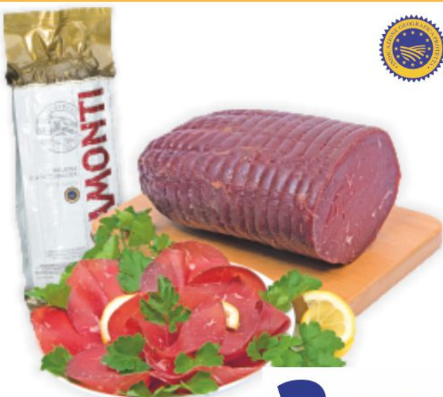
Bresaola della Valtellina I.G.P. Oro Rigamonti al kg 29,90