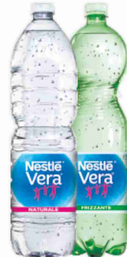
Acqua Vera naturale, frizzante litri 1,5