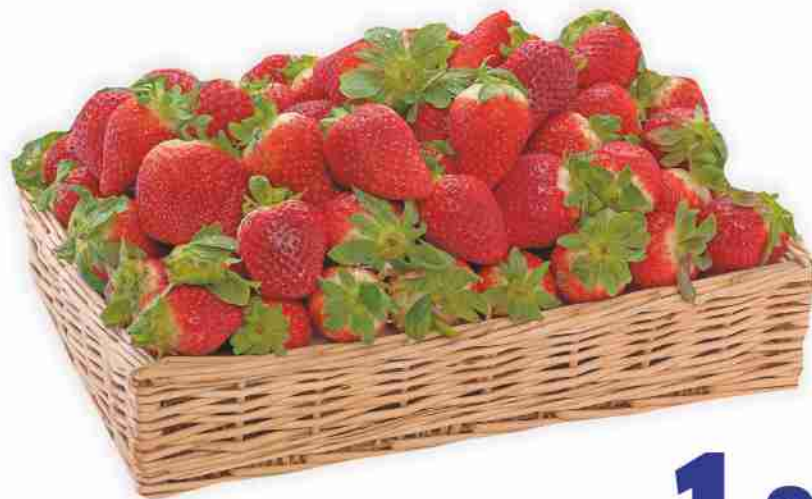
Fragole vaschetta g 500