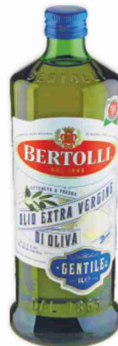
Olio E/Vergine di oliva Bertolli litri 1