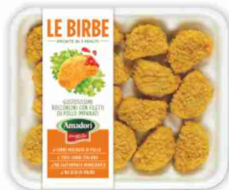
Birbe di pollo Amadori g 300