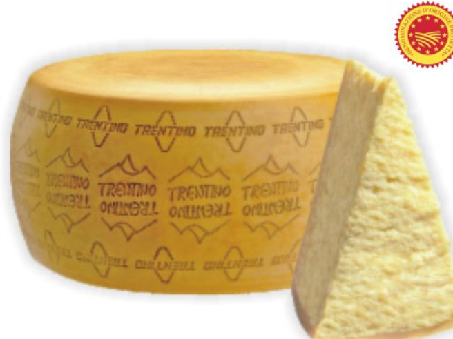
Trentingrana D.O.P. al kg 13,90