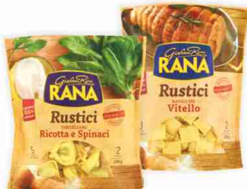
Pasta fresca ripiena Rustici Rana vari tipi g 250