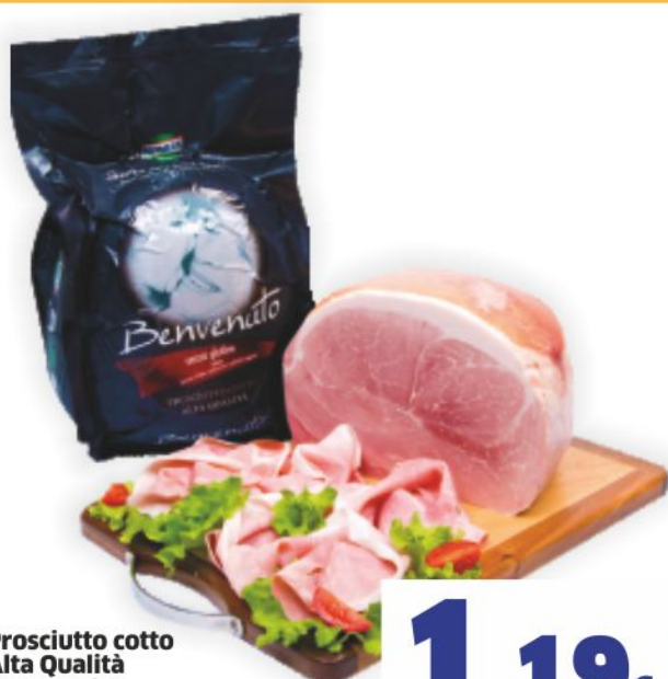
Prosciutto cotto Alta Qualità Benvenuto Kometa al kg 11,90