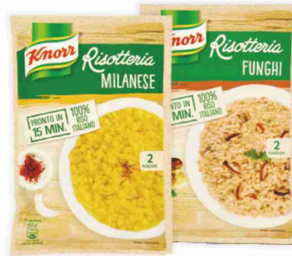
Risotteria Knorr varie ricette g 175