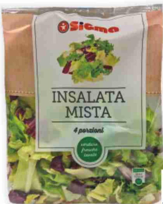
Insalata mista g 200