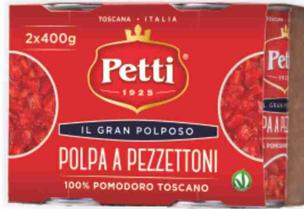
Polpa a pezzettoni Il Gran Polposo Petti g 400x2