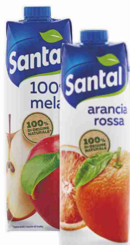
Succhi Santal vari gusti litri 1