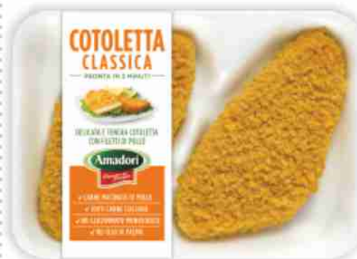
Cotoletta classica Amadori g 220