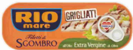
Filetti di sgombro grigliati Rio Mare vari tipi g 120