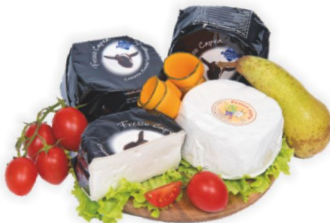
Formaggella Fresco Capra Arnoldi al kg 14,90