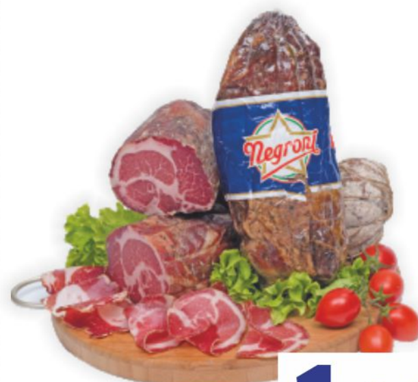
Coppa di Zibello Negroni al kg 19,90