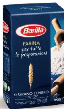
BARILLA FARINA 1 KG