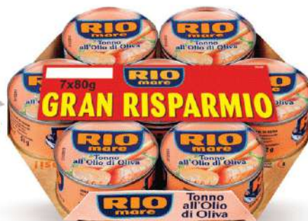
RIO MARE TONNO ALL'OLIO DI OLIVA 80 GR X 7