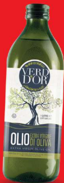
VERD D'OR OLIO EXTRAVERGINE DI OLIVA 1 LITRO