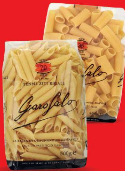
GAROFALO PASTA DI SEMOLA FORMATI NORMALI VARIE TRAFILE 500 GR