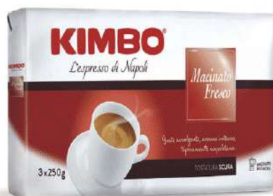
KIMBO CAFFÈ MACINATO FRESCO 250 GR X 3