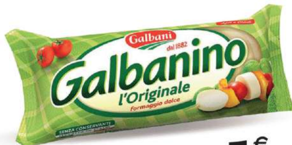
GALBANI GALBANINO 270 GR