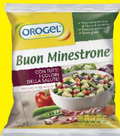
OROGEL BUON MINESTRONE 450 GR