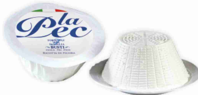
Ricotta di pecora La Pec Caseificio Busti al kg € 6,90 € 0,69 all'etto