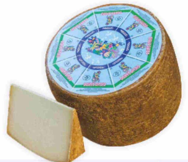
Giglio Sardo Argiolas al kg € 15,90 € 1,59 all'etto