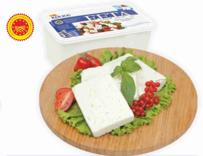
Feta Greca D.O.P. Kolios al kg € 9,90 € 0,99 all'etto