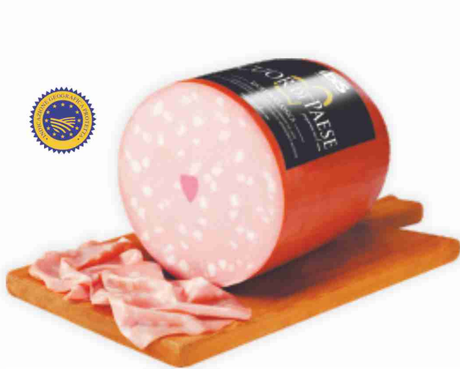
Mortadella Bologna I.G.P. Cuor di Paese Ibis al kg € 8,90 € 0,89 all'etto