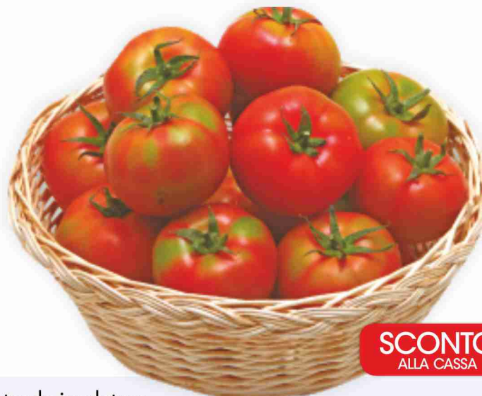
Pomodoro tondo insalatato vassoio