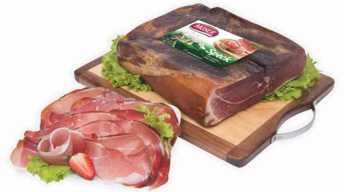
Speck Moser al kg € 14,90 € 1,49 all'etto