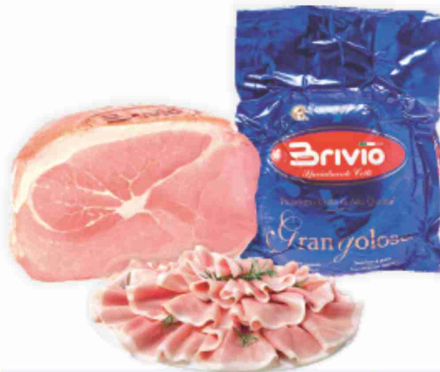
Prosciutto cotto Alta Qualità Grangoloso Brivio al kg € 13,90 € 1,39 all'etto