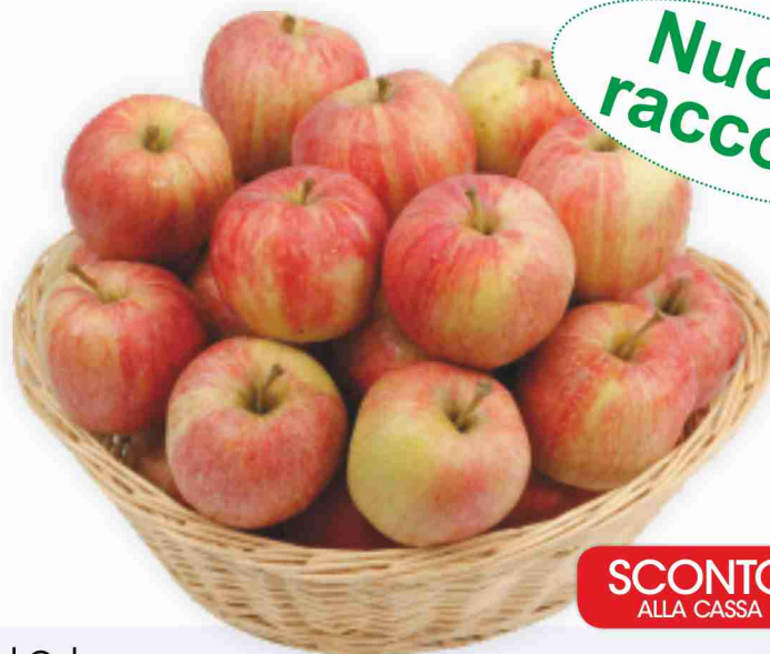
Mele Royal Gala vassoio