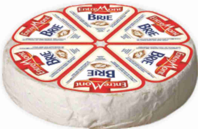
Brie Entremont al kg € 7,90 € 0,79 all'etto