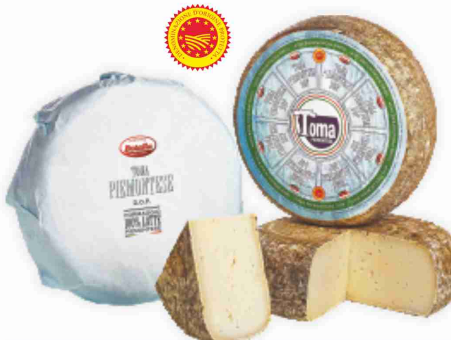
Toma Piemontese D.O.P. Botalla al kg € 9,90 € 0,99 all'etto