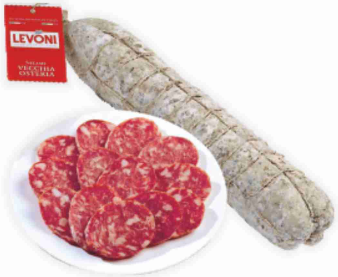
Salame mantovano Vecchia Osteria Levoni al kg € 22,90 € 2,29 all'etto