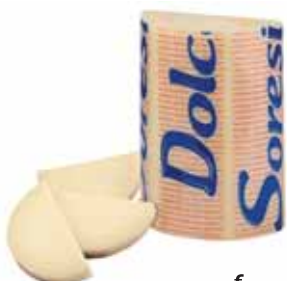
SORESINA PROVOLONE DOLCE - AL KG