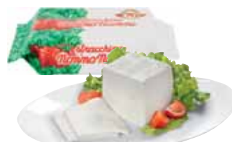
NONNO NANNI STRACCHINO AL KG