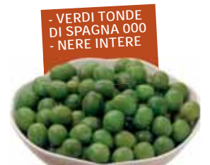
DOLITA OLIVE AL KG