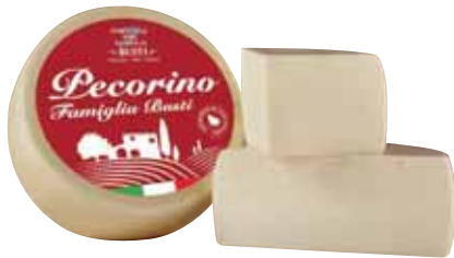
FAMIGLIA BUSTI PECORINO AL KG