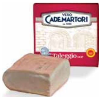
CADEMARTORI TALEGGIO AL KG