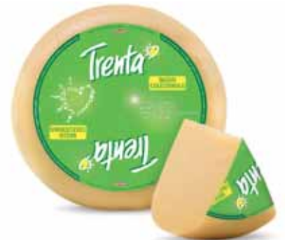
TRENTA WESTLAND BASSO COLESTEROLO AL KG