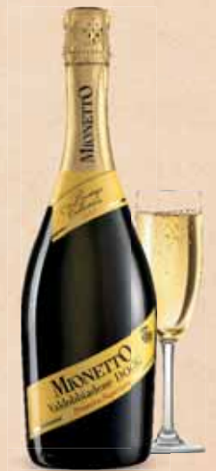
MIONETTO PROSECCO SUPERIORE DI VALDOBBIADENE D.O.C.G. CL. 75