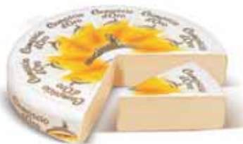
CAMOSCIO D'ORO AL KG