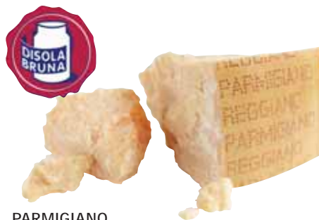
PARMIGIANO REGGIANO D.O.P. DISOLABRUNA STAGIONATO 30 MESI AL KG