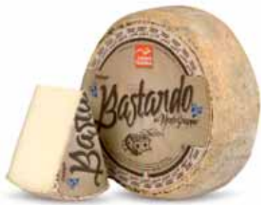
LATTERIE VICENTINE BASTARDO DEL GRAPPA AL KG