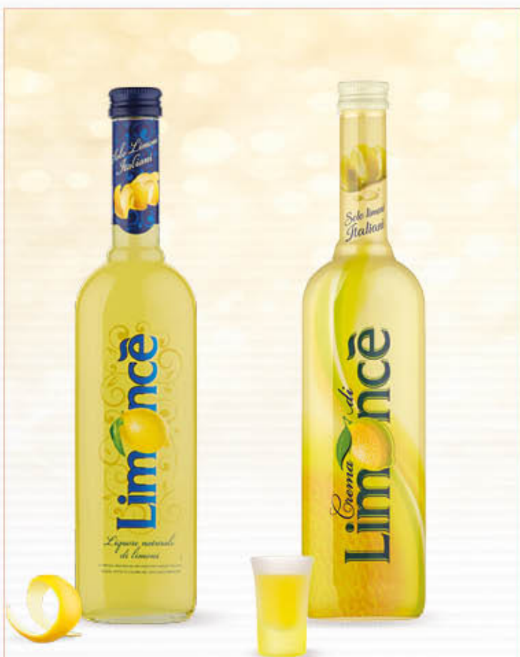
LIMONCÉ 50 CL