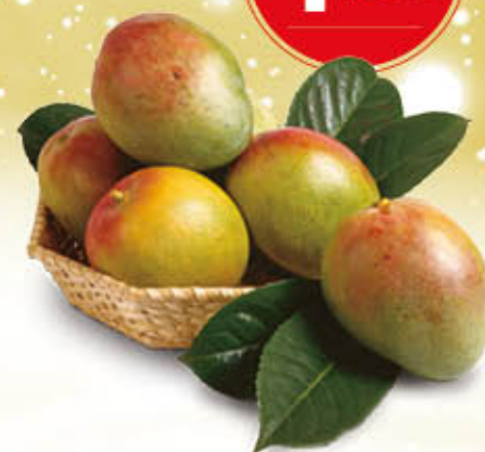
MANGO AL PEZZO