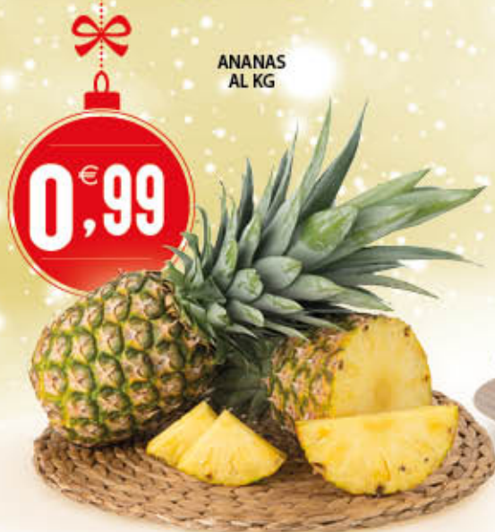
ANANAS AL KG