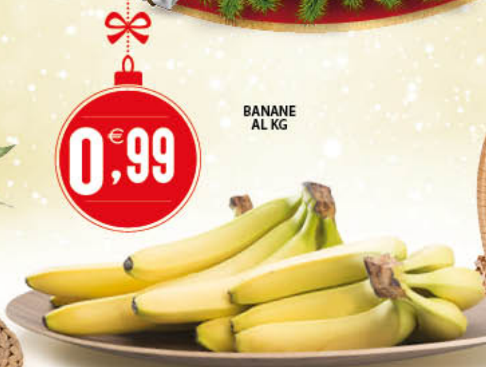
BANANE AL KG