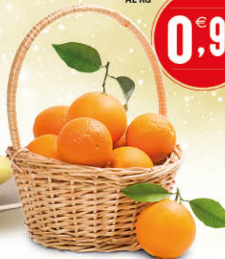
ARANCE NAVEL AL KG