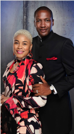
s i m b a