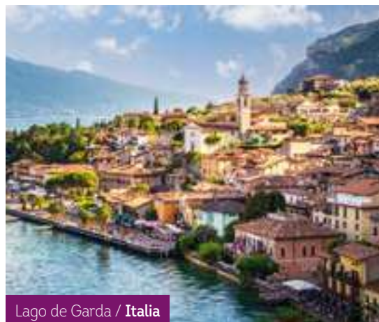
Lago de Garda / Italia

Las entradas a los recintos arqueológicos no se encuentran incluidas a no ser que se indique expresamente en el itinerario.