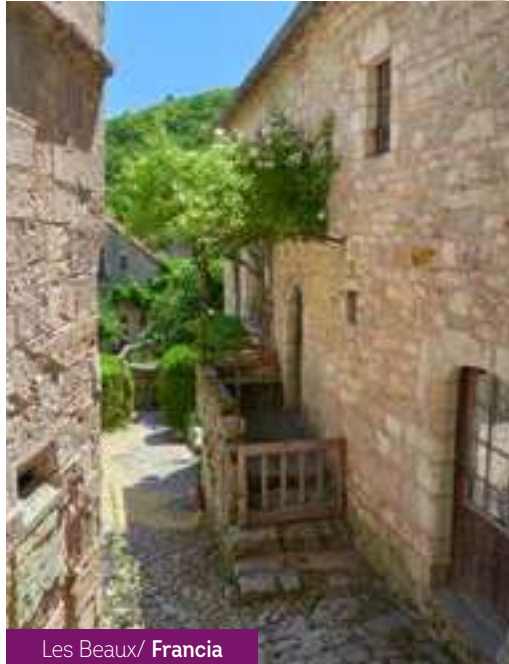
Les Beaux/ Francia

Traslado al Palacio de Versalles por la mañana.