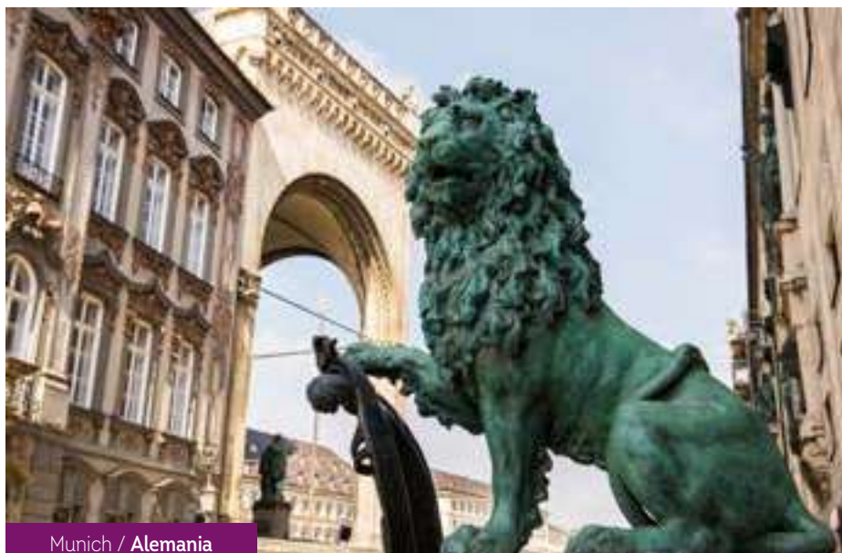
Munich / Alemania