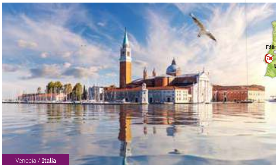
Venecia / Italia