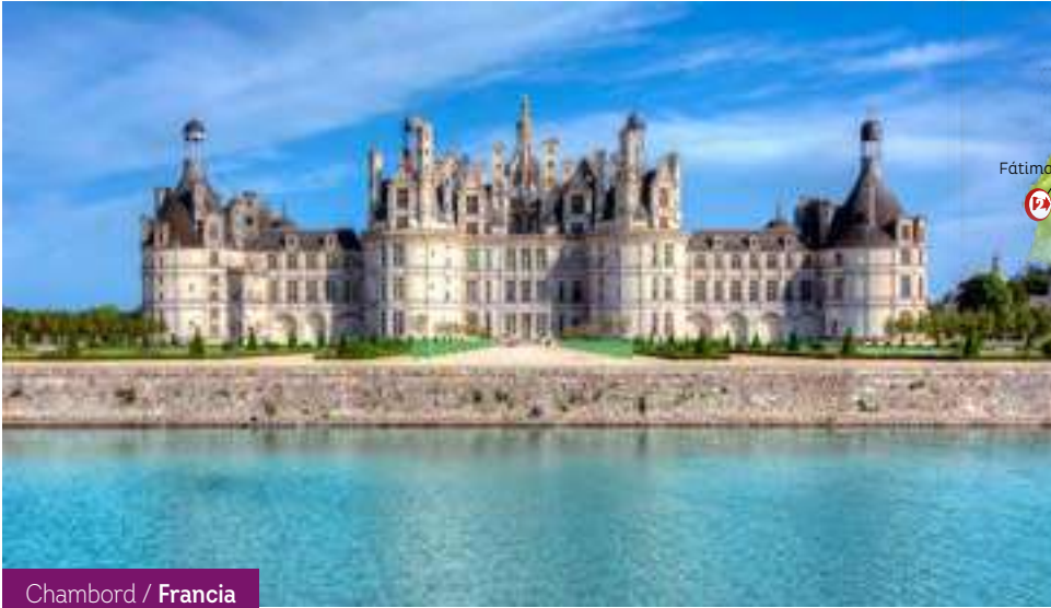
Chambord / Francia