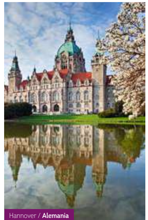
Hannover / Alemania