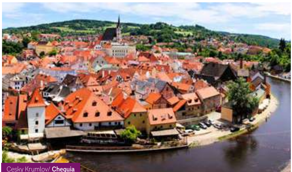
Cesky Krumlov/ Chequia