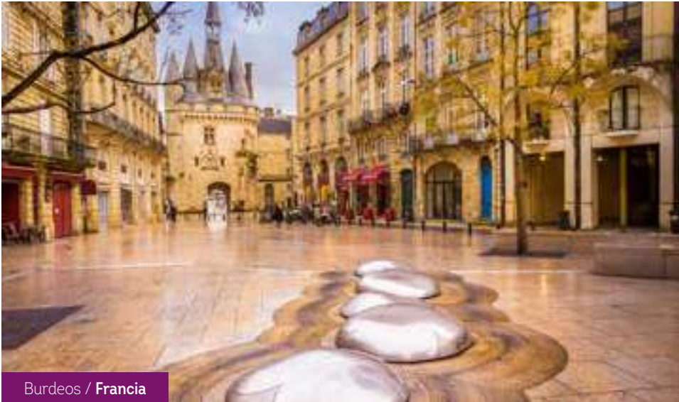
Burdeos / Francia