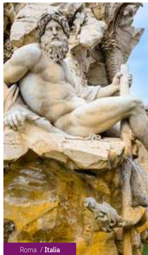
Roma / Italia

Hoy cruzamos la frontera hacia España por los Pirineos. Parada en Roncesvalles, perteneciente al Camino de Santiago. Tiempo para almorzar en Pamplona. Seguimos a Olite, con su imponente castillo. Llegada a Madrid sobre las 21.00 hrs. Fin de los servicios.