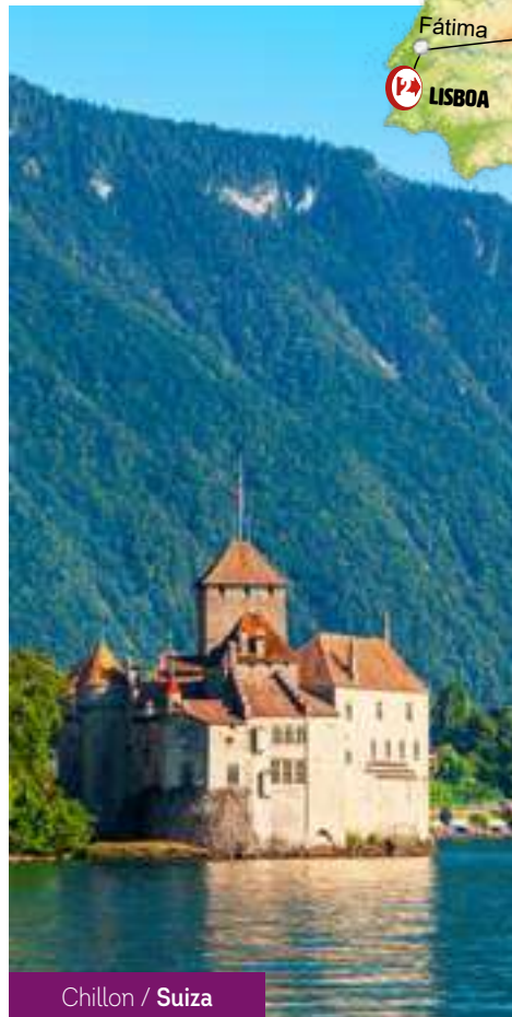
Chillon / Suiza

Después del desayuno, fin de los servicios.