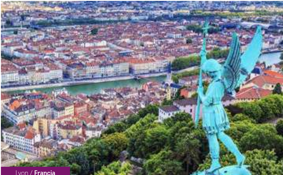
Lyon / Francia