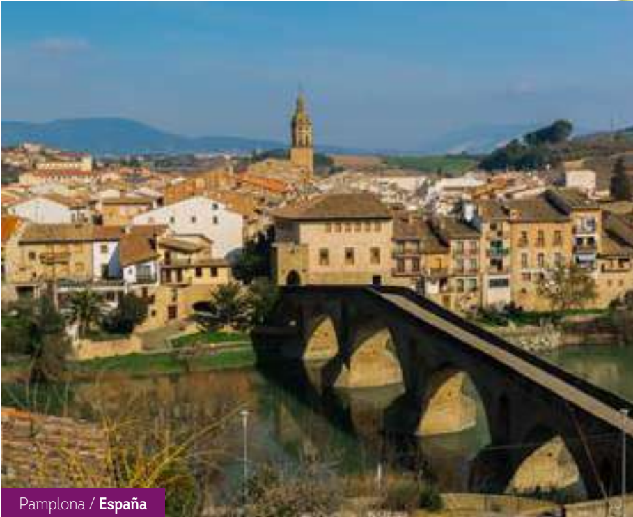
Pamplona / España

ID:23274 Italia, Suiza, Francia, España, Lourdes Opc. 3