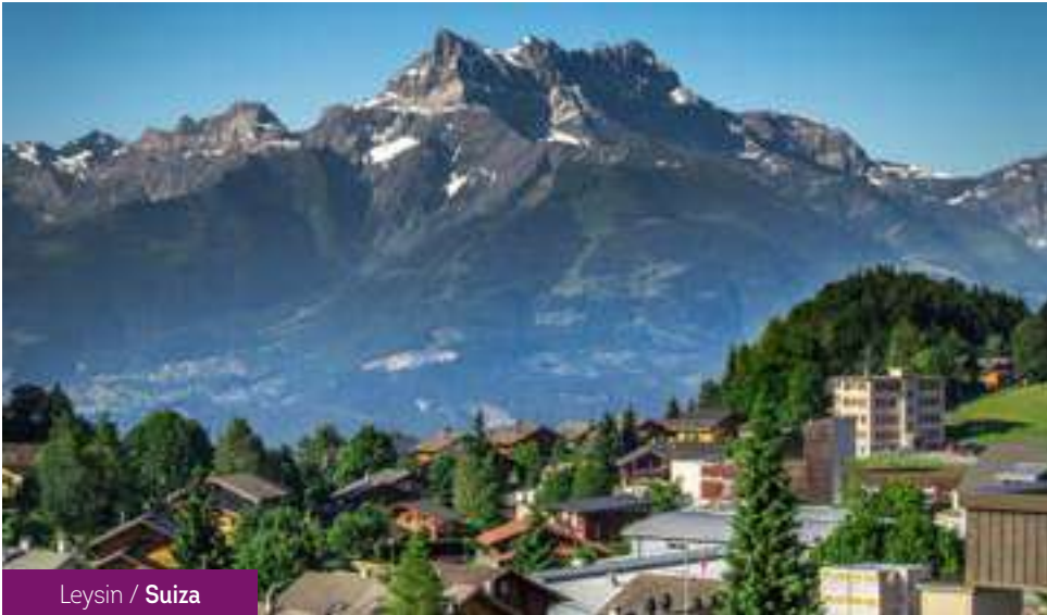
Leysin / Suiza