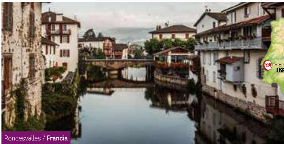
Roncesvalles / Francia