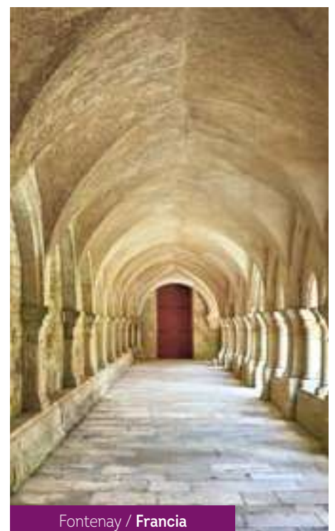
Fontenay / Francia