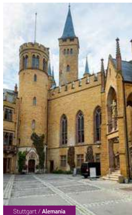
Stuttgart / Alemania

Después del desayuno, fin de los servicios.