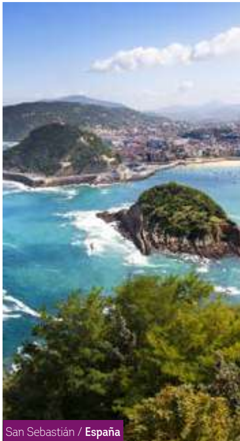
San Sebastián / España

Después del desayuno, fin de los servicios.