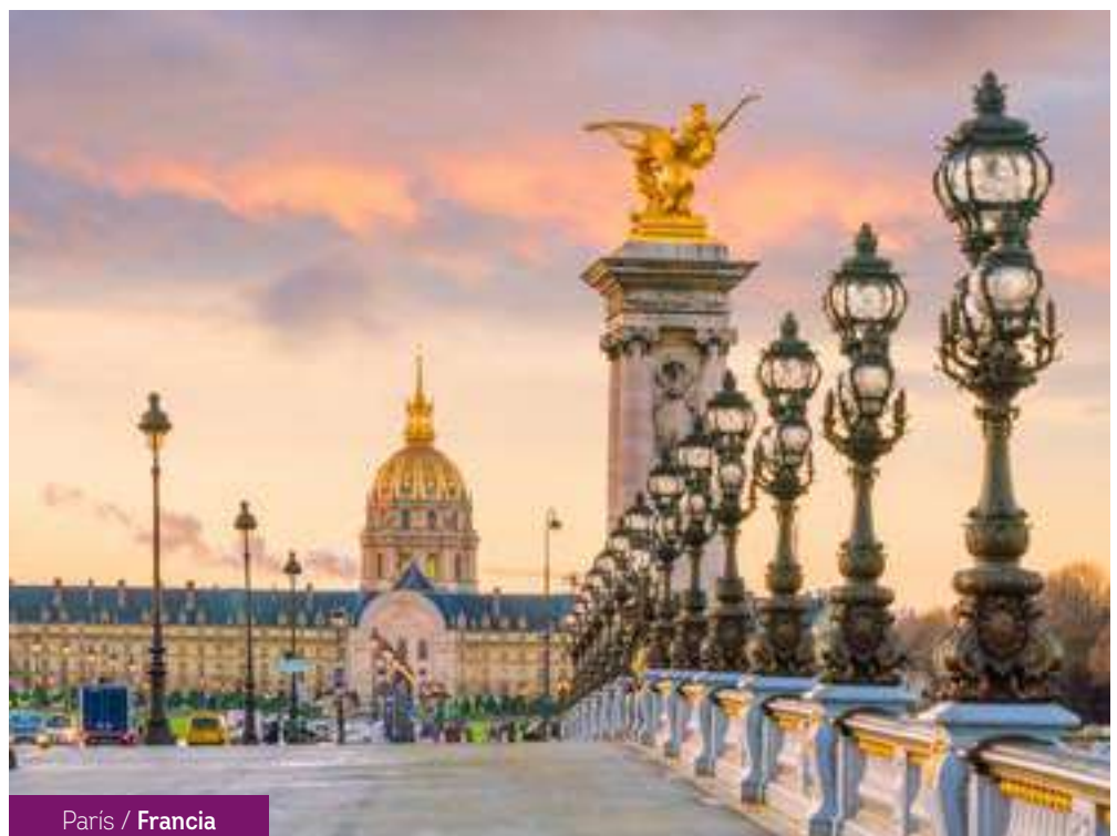
París / Francia