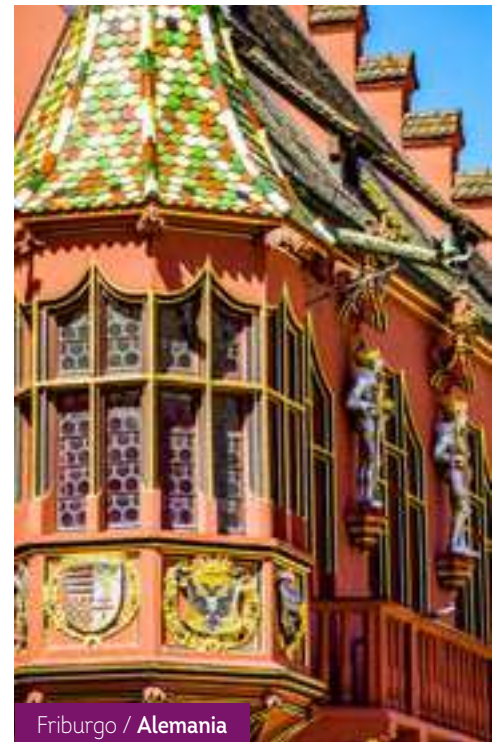
Friburgo / Alemania