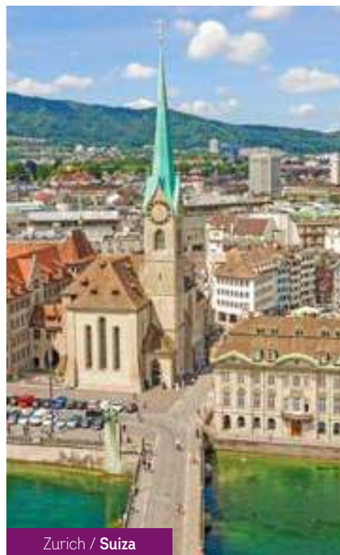
Zurich / Suiza

Después del desayuno, fin de los servicios.