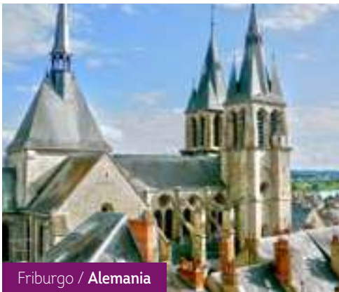
Freiburgo / Alemania

Después del desayuno, fin de los servicios.