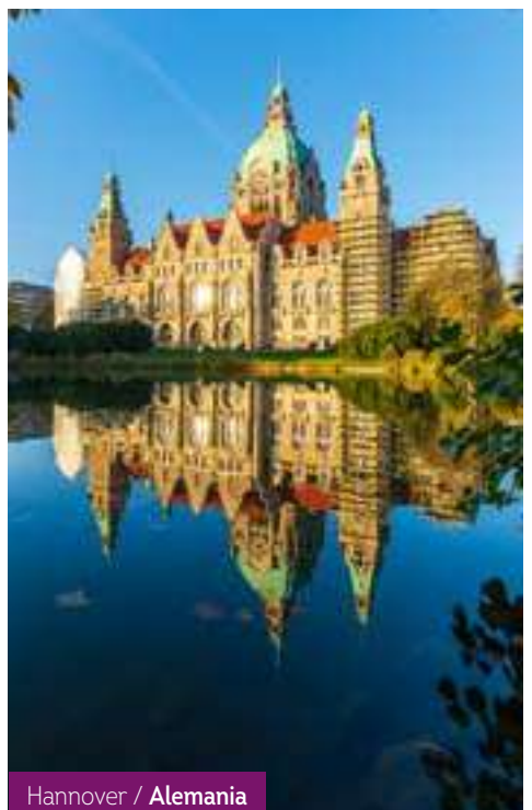
Hannover / Alemania