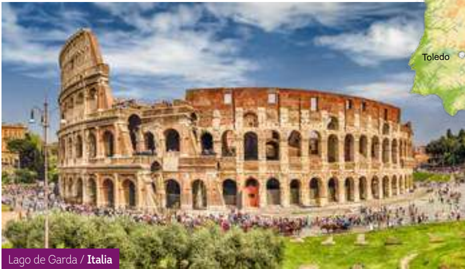
Lago de Garda / Italia