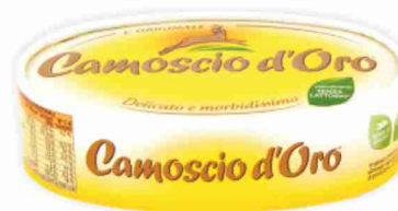
Camoscio d'Oro g 200 al kg € 12,45