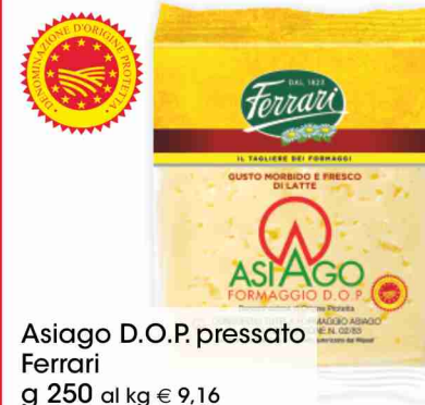
Asiago D.O.P. pressato Ferrari g 250 al kg € 9,16