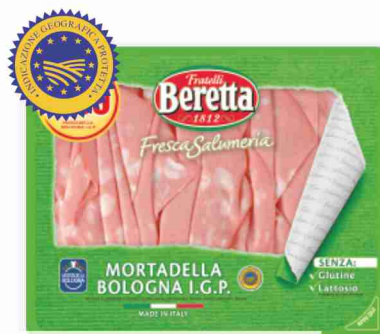
Mortadella Bologna I.G.P. Fresca Salumeria Beretta g 120 al kg € 14,08