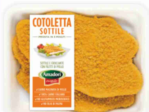
Cotoletta sottile Amadori g 300 al kg € 5,63