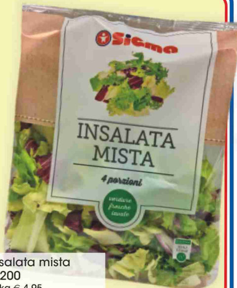
Insalata mista g 200 al kg € 4,95