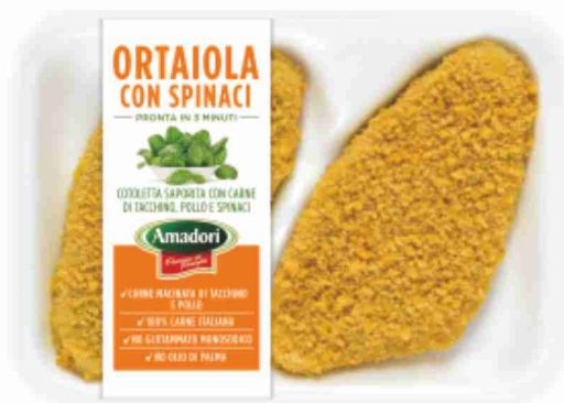
Ortaiola con spinaci Amadori g 220 al kg € 7,23