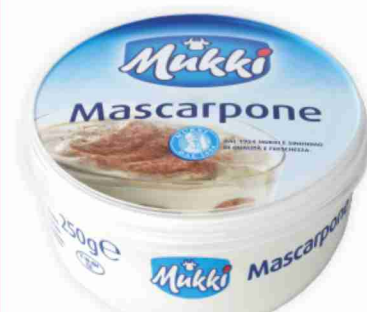
Mascarpone Mukki g 250 al kg € 9,96