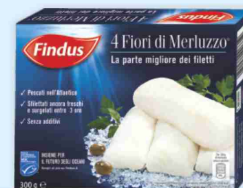
Fiori di merluzzo Findus g 300 al kg € 14,97