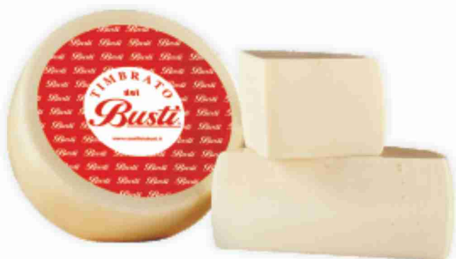
Pecorino Timbrato Caseificio Busti al kg € 11,90