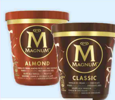
Magnum Pinta Algida almond, classico, white g 297 al kg € 10,07