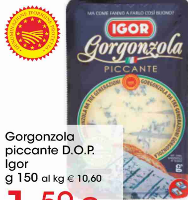
Gorgonzola piccante D.O.P. Igor g 150 al kg € 10,60