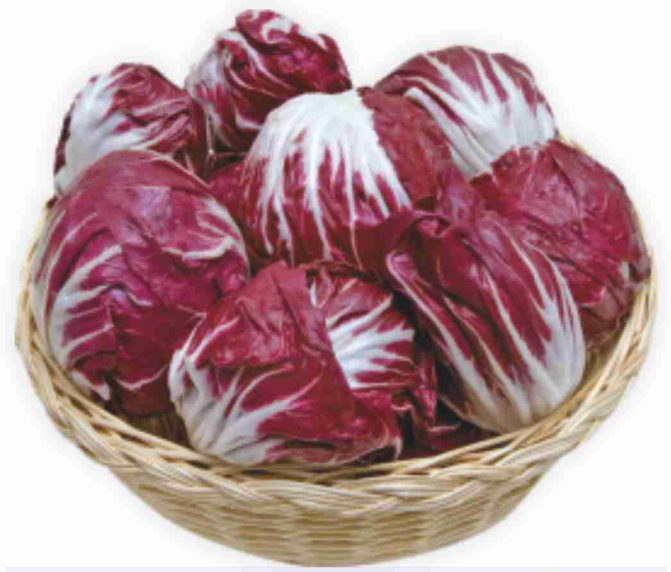
Radicchio rosso tondo