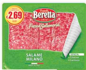
Salame Milano Fresca Salumeria Beretta g 100 al kg € 19,90