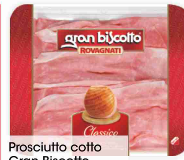
Prosciutto cotto Gran Biscotto Rovagnati g 130 al kg € 26,85