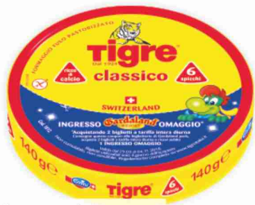
Formaggi Tigre g 140 al kg € 9,93