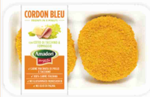
Cordon Bleu Amadori g 250 al kg € 8,76