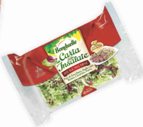
Insalata Ricetta Gustosa Bonduelle g 150 al kg € 6,60