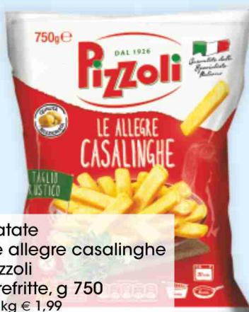
Patate Le allegre casalinghe Pizzoli prefritte, g 750 al kg € 1,99