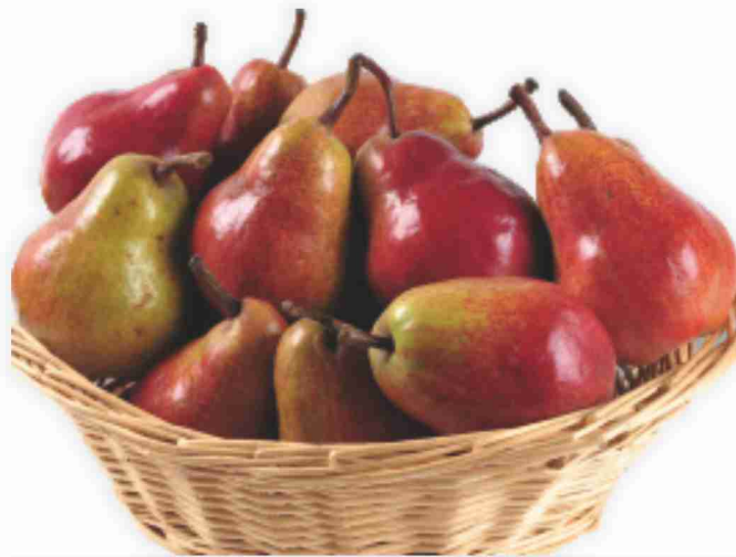
Pere William's rosse