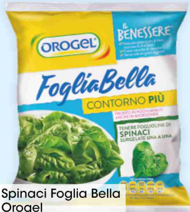
Spinaci Foglia Bella Orogel g 450 al kg € 3,09