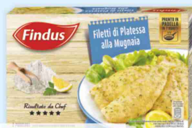
Filetti di platessa alla mugnaia Findus g 250 al kg € 15,96