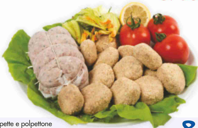
Polpette e polpettone (pronto cuoci)