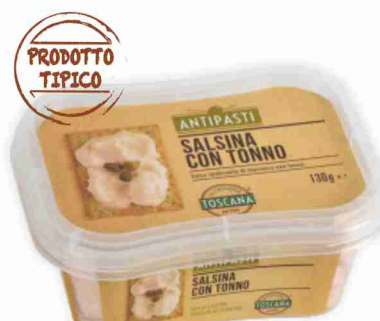
Salsine da antipasto Gastronomia Toscana vari gusti g 130 al kg € 7,62