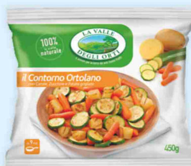
Contorno ortolano La Valle degli Orti g 450 al kg € 3,09