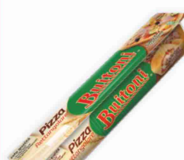
Base rettangolare pizza Buitoni g 385 al kg € 3,87