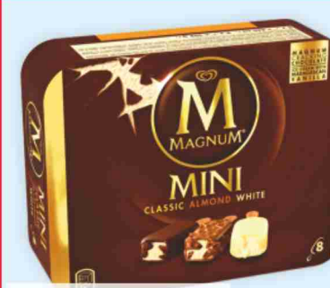
Magnum mini Algida gusti assortiti g 352 al kg € 9,91