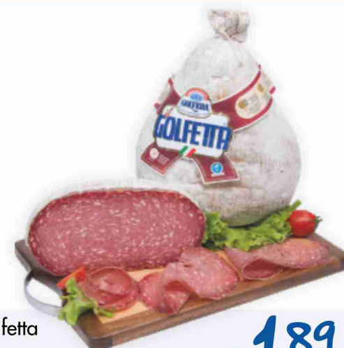
Salame Golfetta Golfera al kg € 18,90