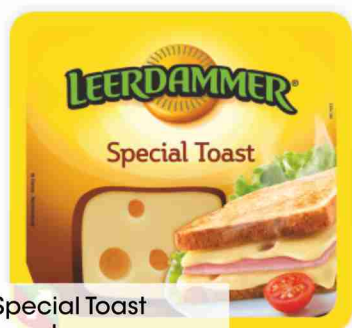
Special Toast Leerdammer g 125 al kg € 11,92