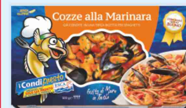
Cozze alla marinara Esca g 500 al kg € 6,58