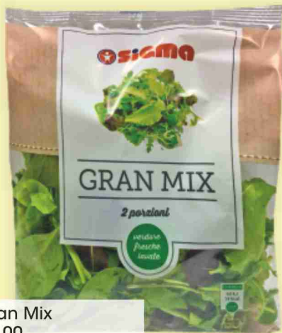
Gran Mix g 100 al kg € 9,90