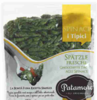
Spätzle Patamore agli spinaci, classici g 350 al kg € 3,97