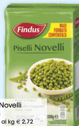
Piselli Novelli Findus kg 1,1 al kg € 2,72