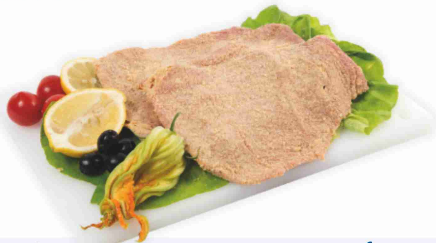
Fettine milanesi (pronto cuoci)