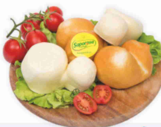
Scamorza Saporosa al kg € 9,90