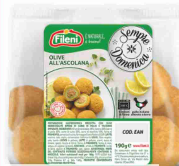
Olive ripiene all'ascolana Fileni g 190 al kg € 11,53