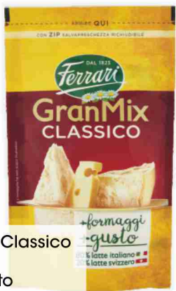
Gran Mix Classico Ferrari grattugiato g 100 al kg € 11,50