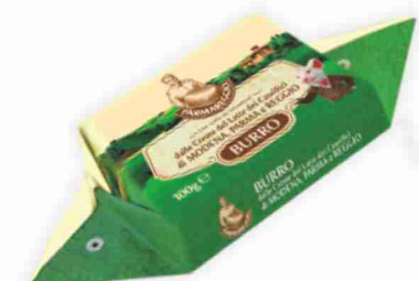
Burro Parmareggio g 100 al kg € 8,90