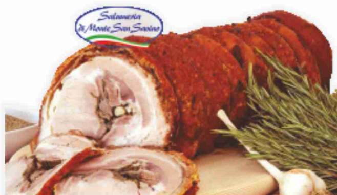
Tronchetto cotto a legna Monte San Savino al kg € 14,90