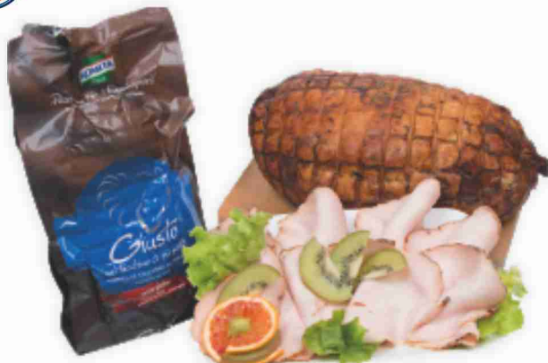
Petto di tacchino rustico Kometa al kg € 11,90