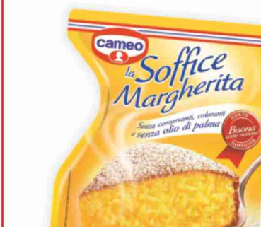
Torte Cameo margherita, cioccolato g 650 al kg € 5,37