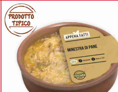
Piatti pronti in coccia Gastronomia Toscana minestra di pane, zuppa di farro, pasta e ceci g 250 al kg € 9,96