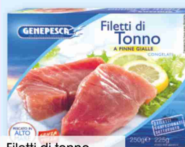
Filetti di tonno Genepesca g 250 al kg € 13,96