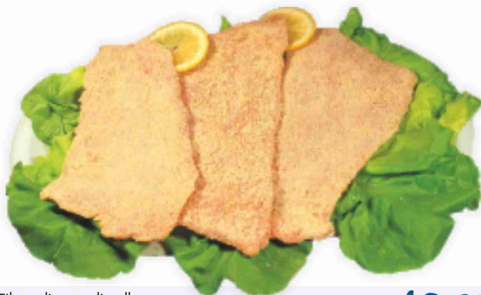
Filetto di petto di pollo (pronto cuoci)