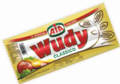
Wurstel Wudy Aia classico, g 250 al kg € 3,56