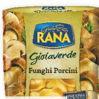
Pasta fresca ripiena Gioiaverde Rana vari gusti, g 250 al kg € 7,96