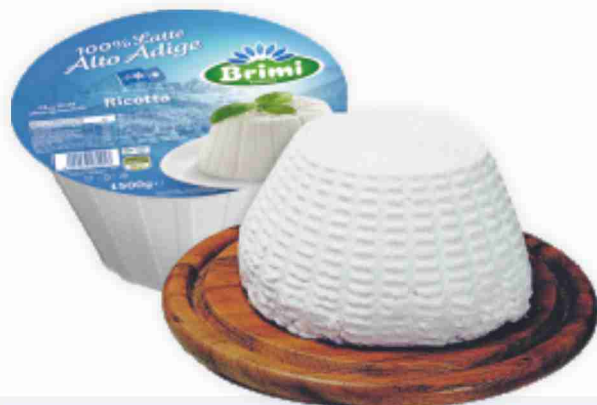
Ricotta Brimi al kg € 4,90