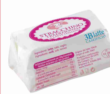
Stracchino tradizionale 3B Latte g 250 al kg € 7,96