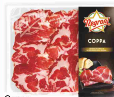
Coppa Negroni g 100 al kg € 19,90