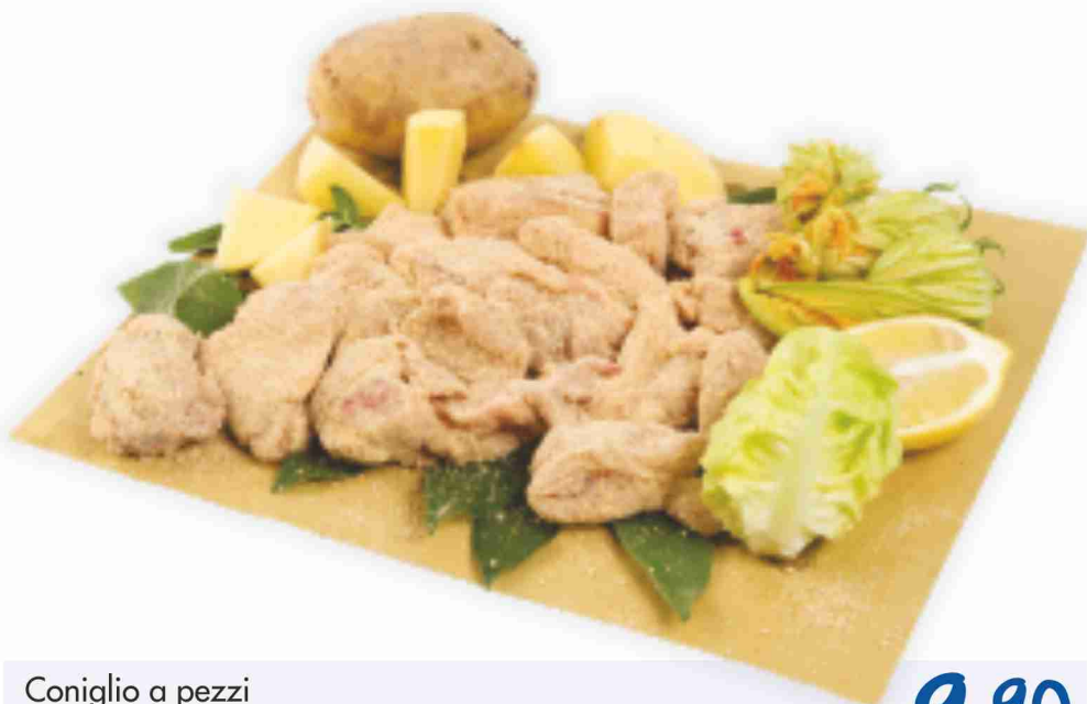
Coniglio a pezzi (pronto cuoci)