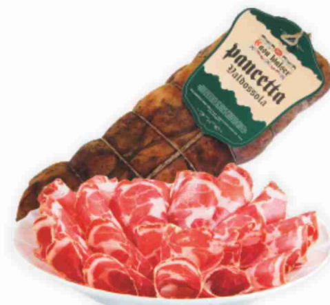
Pancetta Valdossola Casa Walser al kg € 11,90