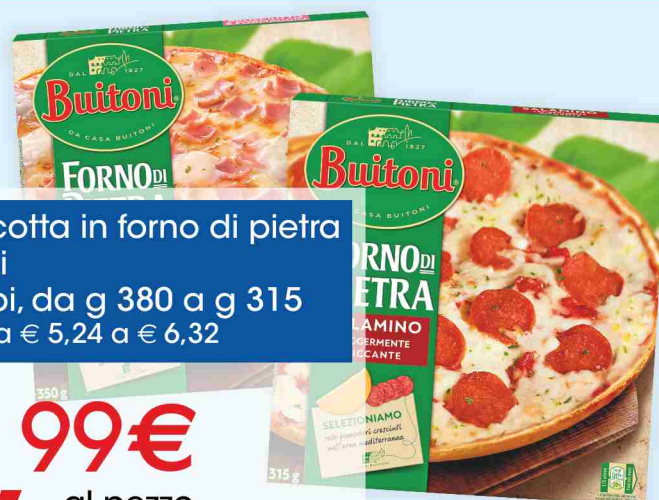
Pizza cotta in forno di pietra Buitoni vari tipi, da g 380 a g 315 al kg da € 5,24 a € 6,32