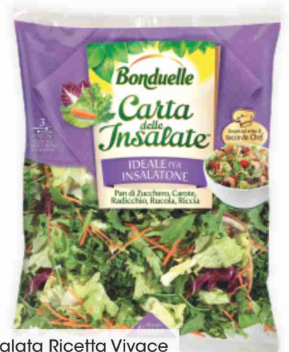
Insalata Ricetta Vivace Bonduelle g 200 al kg € 6,00