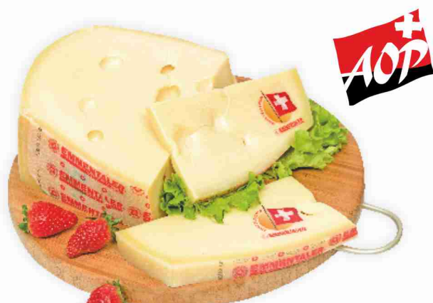
Emmentaler Switzerland al kg € 11,90