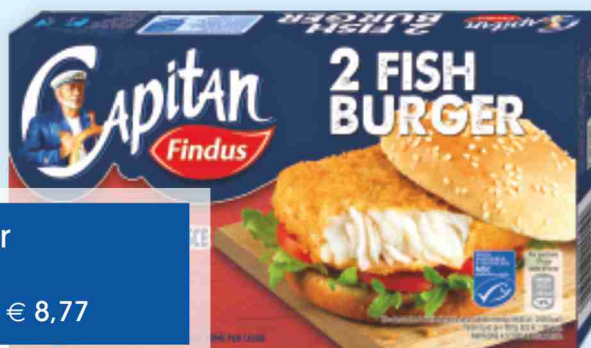
Fish burger Findus g 227 al kg € 8,77