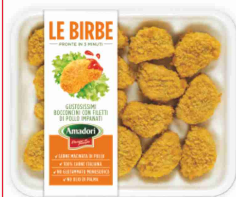
Birbe di pollo Amadori g 300 al kg € 7,97