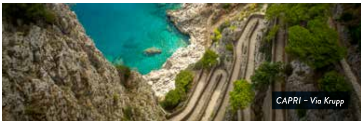
CAPRI – Via Krupp