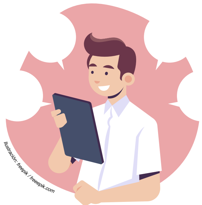
Ilustración: freepik / freepik.com