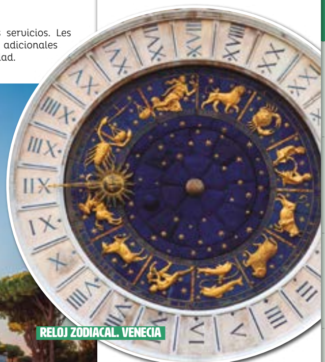
RELOJ ZODIACAL. VENECIA