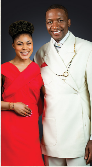
જીવનના દબાણ કરતાં વધુ મજબૂત છે.