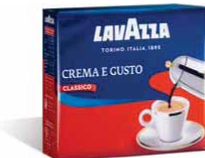
Caffè Crema e Gusto LAVAZZA 2 x 250 g € 7,98 al kg