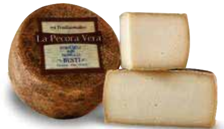
Pecorino La Pecora Vera CASEIFICIO BUSTI