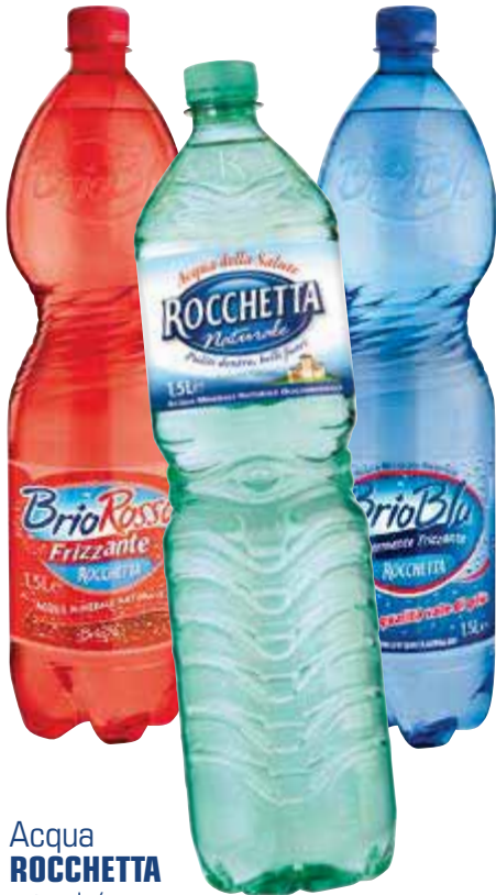
Acqua ROCCHETTA naturale/ frizzante/leggermente frizzante - 150 cl € 0,25 al lt