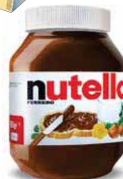
Nutella FERRERO 950 g € 5,78 al kg