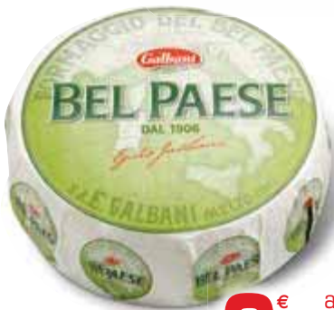
Bel Paese GALBANI