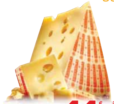
Emmentaler Switzerland DOP