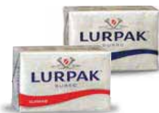
Burro LURPAK classico/salato 250 g € 9,56 al kg