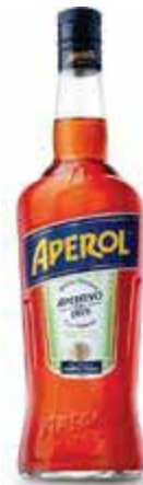
APEROL 70 cl € 9,84 al lt