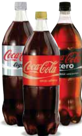
COCA-COLA classica/ senza caffeina/ zero/light 1,5 lt € 1,06 al lt