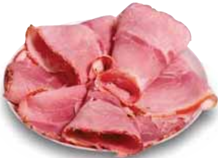
Prosciutto arrosto SALUMIFICIO PIACENTI senza glutine