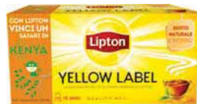
Tè yellow label LIPTON 25 filtri/38 g € 37,63 al kg