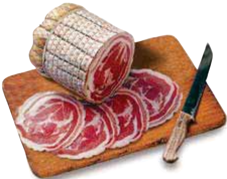
Pancetta coppata CAV. BOSCHI