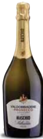
Prosecco di Valdobbiadene Superiore DOCG MASCHIO 75 cl € 5,85 al lt