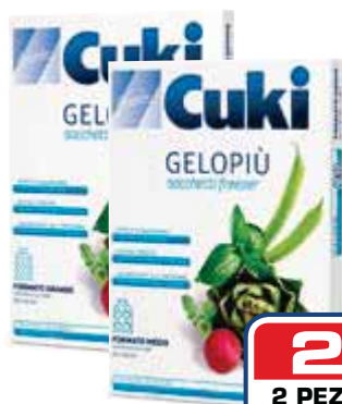
Sacchetti gelo CUKI piccoli - 40 pezzi medi - 20 pz grandi - 15 pezzi

2x1 2 PEZZI €2,99 1,50 AL PEZZO ANZICHÉ €2,99 AL PEZZO