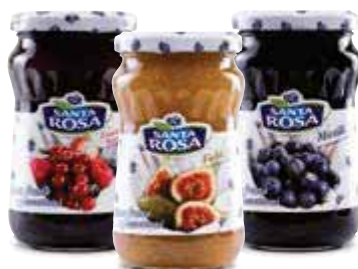
Delizia frutti di bosco/fichi/ mirtilli - 350 g € 5,69 al kg