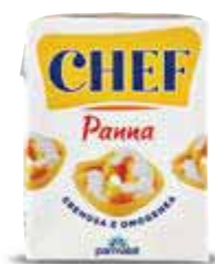
Panna UHT Chef PARMALAT