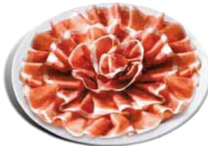
Prosciutto crudo stagionato