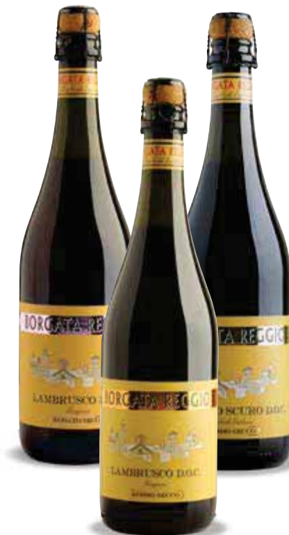
Lambrusco DOC BORGATA REGGIO rosso/rosato/scurο 75 cl € 2,92 al lt