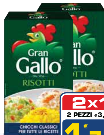
Riso GALLO risotti - 1 kg € 1,75 al kg

2x1 2 PEZZI €1,95 0,98 AL PEZZO ANZICHÉ €1,95 AL PEZZO