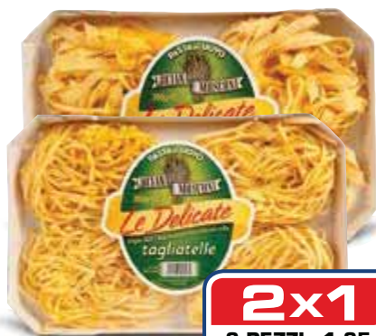
Pasta all'uovo Le Delicate LUCIANA MOSCONI formati assortiti 250 g € 3,90 al kg

2x1 2 PEZZI €1,08 0,54 AL PEZZO ANZICHÉ €1,08 AL PEZZO