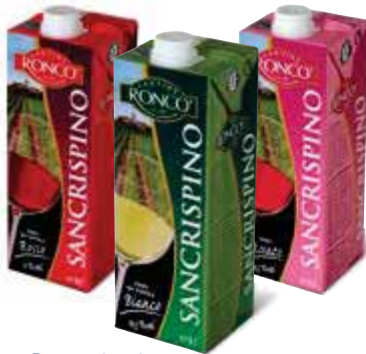
Vino Sancrispino RONCO bianco/rosso/rosato - 1 lt