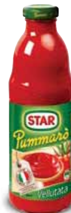
Pummarò Vellutata STAR 700 g € 1,13 al kg