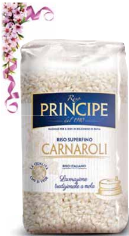
Riso Carnaroli PRINCIPE 1 kg