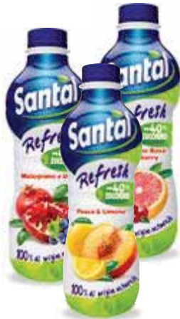
Santal Refresh PARMALAT pesca e limone/ melograno e uva/ pompelmo rosa/ ace lime - 1 lt