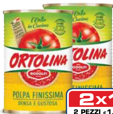
Polpa pomodoro ORTOLINA 400 g € 1,35 al kg

2x1 2 PEZZI €1,08 0,54 AL PEZZO ANZICHÉ €1,08 AL PEZZO