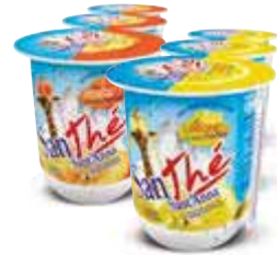
The SATHÈ limone/pesca 3 x 200 ml € 1,48 al lt