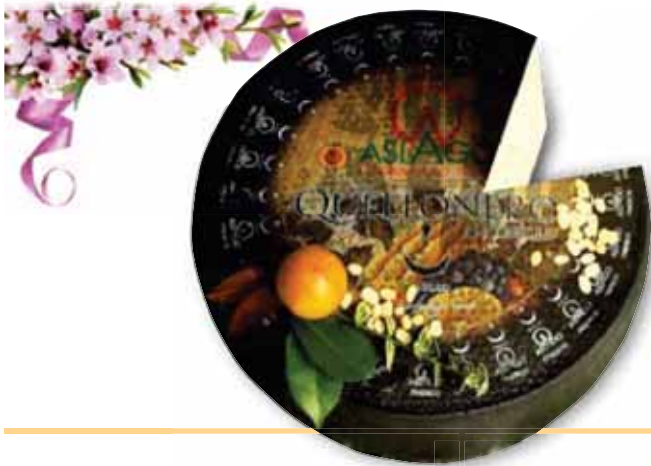
Asiago nero DOP TONIOLO CASEARIA

In offerta solo nei punti vendita con banco salumi e formaggi