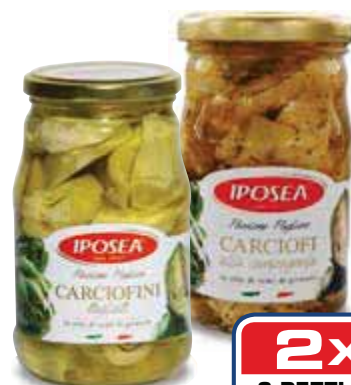
Sottoli IPOSEA carciofi alla campagnola/ carciofini/funghi tagliati - 290 g € 5,16 al kg

2x1 2 PEZZI €5,39 2,70 AL PEZZO ANZICHÉ €5,39 AL PEZZO