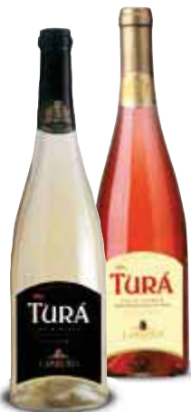
Turà frizzante IGT LAMBERTI rosè/bianco 75 cl € 3,05 al lt