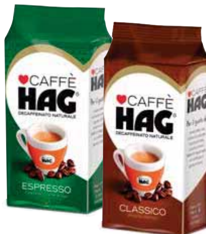
Caffè HAG classico/espresso 250 g € 9,96 al kg