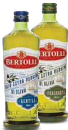
Olio extravergine di oliva BERTOLLI