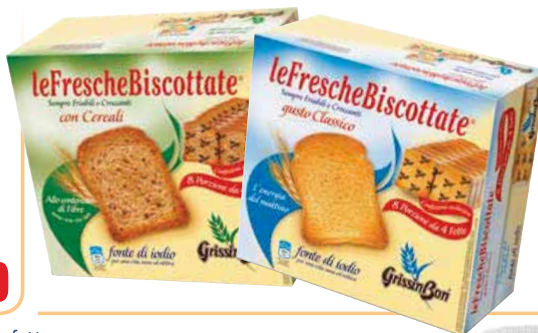
Fette biscottate GRISSIN BON gusto classico/ iposodiche/ integrali/cereali 250 g € 3,16 al kg