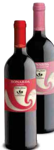
Bonarda DOC CANTINA VALTIDONE amabile/secca - 75 cl € 3,19 al lt

2x1 2 PEZZI €3,09 1,55 AL PEZZO ANZICHÉ €3,09 AL PEZZO