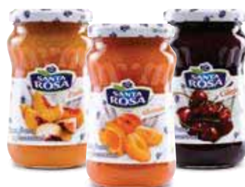
Classiche gusti assortiti - 350 g € 3,97 al kg