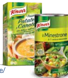
Minestrone/ Passato/ Vellutata/Zuppa KNORR