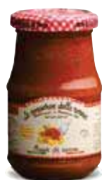
Ragù di carne LE CONSERVE DELLA NONNA 190 g € 8,37 al kg