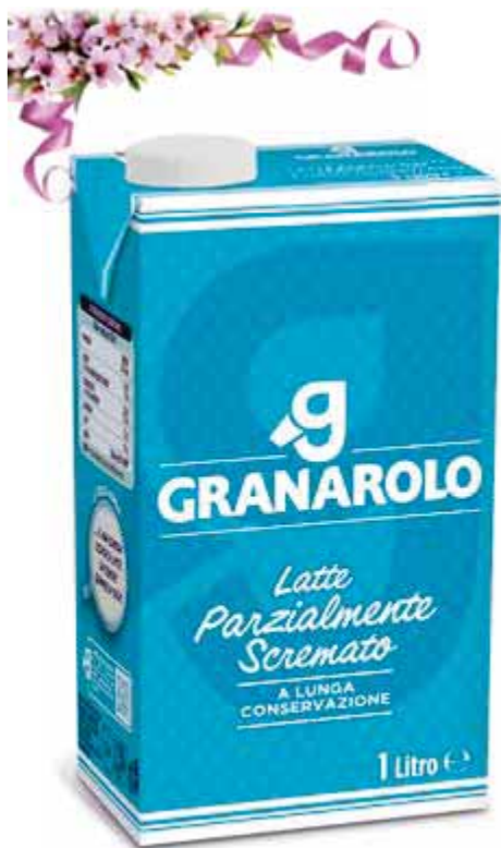
Latte UHT PS GRANAROLO 1 lt