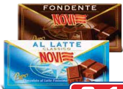
Cioccolato NOVI latte/fondente - 100 g latte e 5 cereali/ riso soffiato - 80 g € 6,45/8,06 al kg

2x1 2 PEZZI €3,49 1,75 AL PEZZO ANZICHÉ €3,49 AL PEZZO