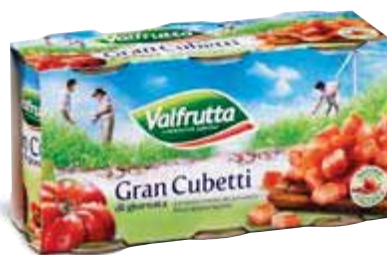
Polpa Gran Cubetti VALFRUTTA