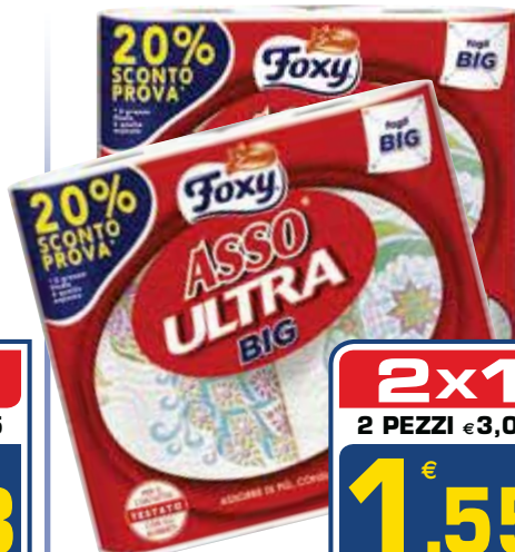
Carta casa Asso FOXY 2 maxi rotoli

2x1 2 PEZZI €1,95 0,98 AL PEZZO ANZICHÉ €1,95 AL PEZZO