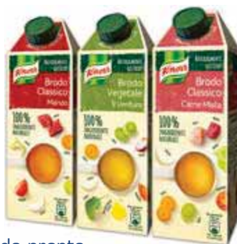
Brodo pronto KNORR

manzo/misto/vegetale 750 ml € 1,72 al lt