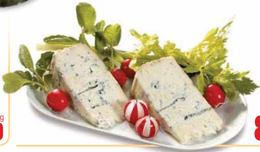
Gorgonzola DOP COLOMBO