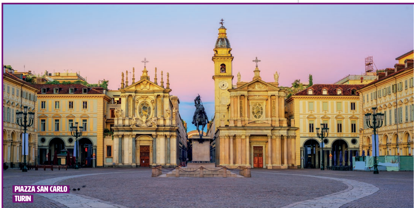
PIAZZA SAN CARLO TURIN