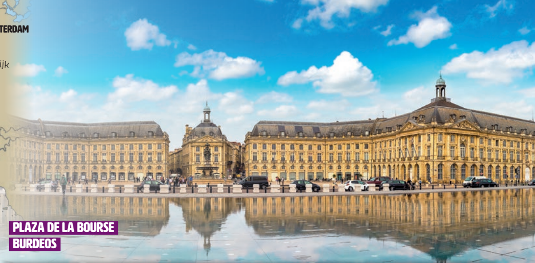
PLAZA DE LA BOURSE BURDEOS