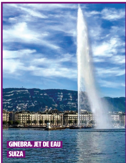
GINEBRA. JET DE EAU SUIZA

Vea los hoteles previstos para este viaje en la parte final del folleto y en su página web "Mi Viaje".