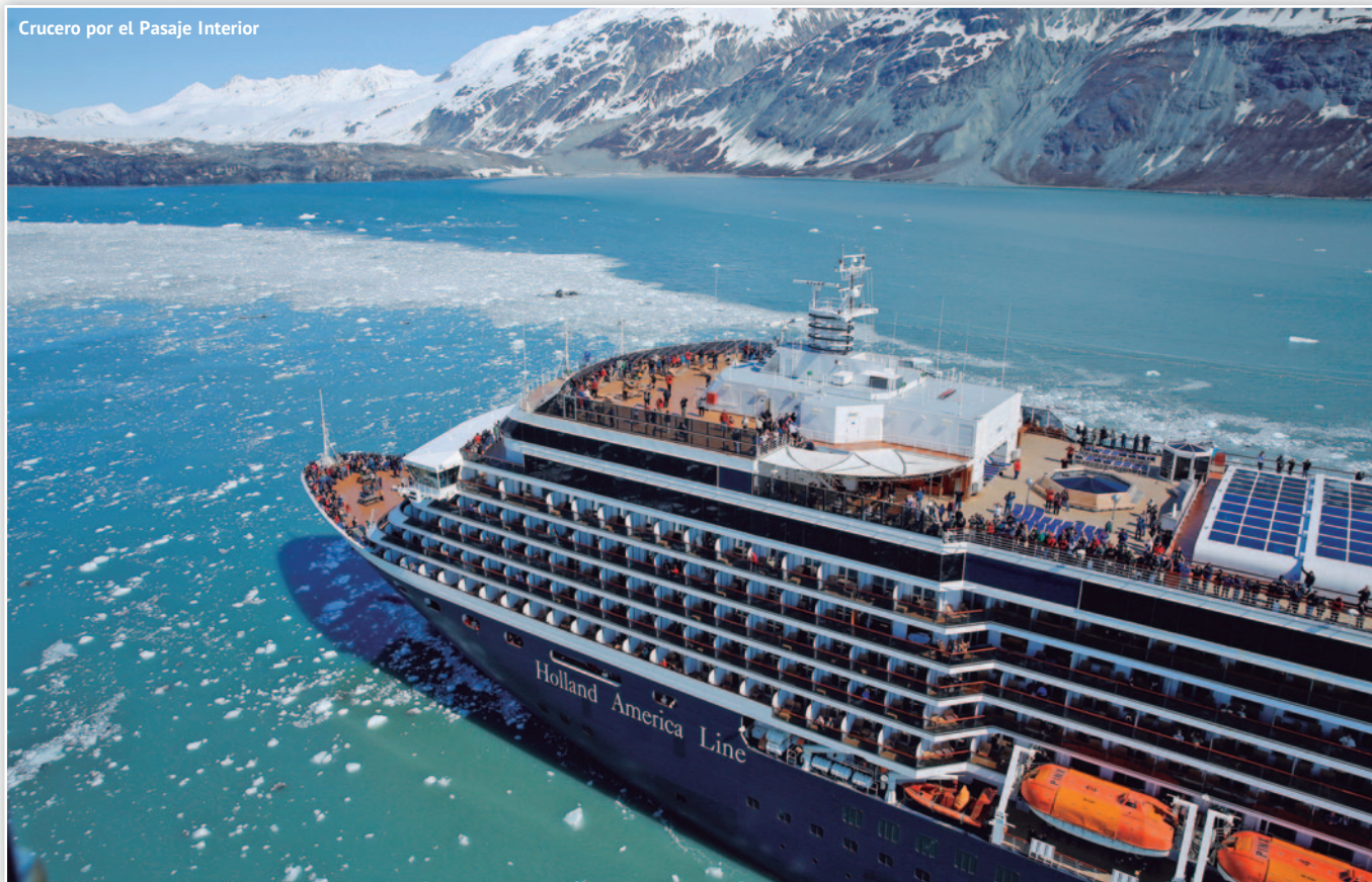
Crucero por el Pasaje Interior

- A bordo, la Cía. Naviera le ofrece en todos los puertos una gran variedad de excursiones opcionales en inglés. Web de la Naviera ( www.hollandamerica.com ), información y reserva. Si desea buena orientación sobre este tema, consulte con nosotros.