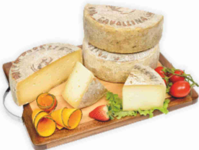
Formagella Valcavallina Paleni al kg € 11,90