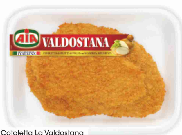
Cotoletta La Valdostana Aia g 200 al kg € 9,95