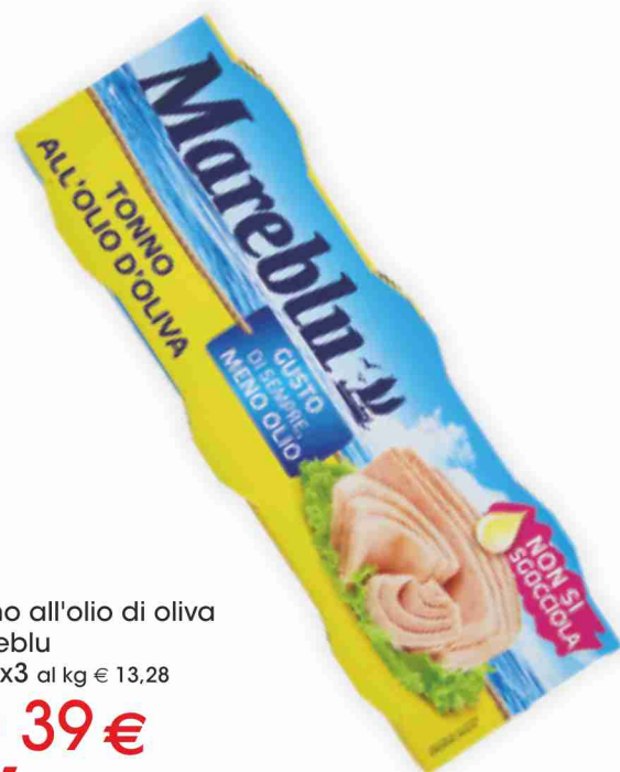
Tonno all'olio di oliva Mareblu g 60x3 al kg € 13,28