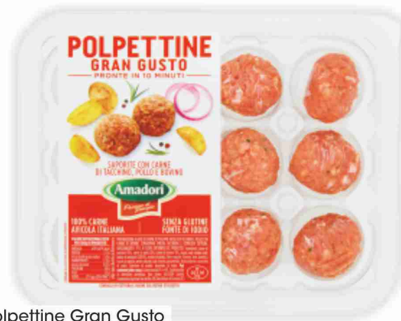
Polpettine Gran Gusto Amadori g 240 al kg € 9,54