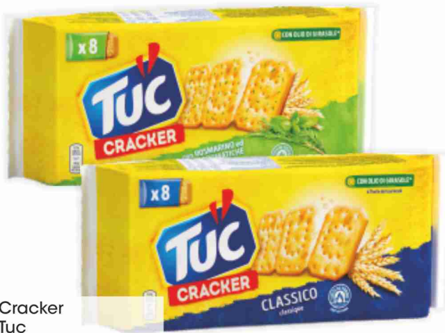
Cracker Tuc vari tipi, g 250/195 al kg € 6,76/8,67