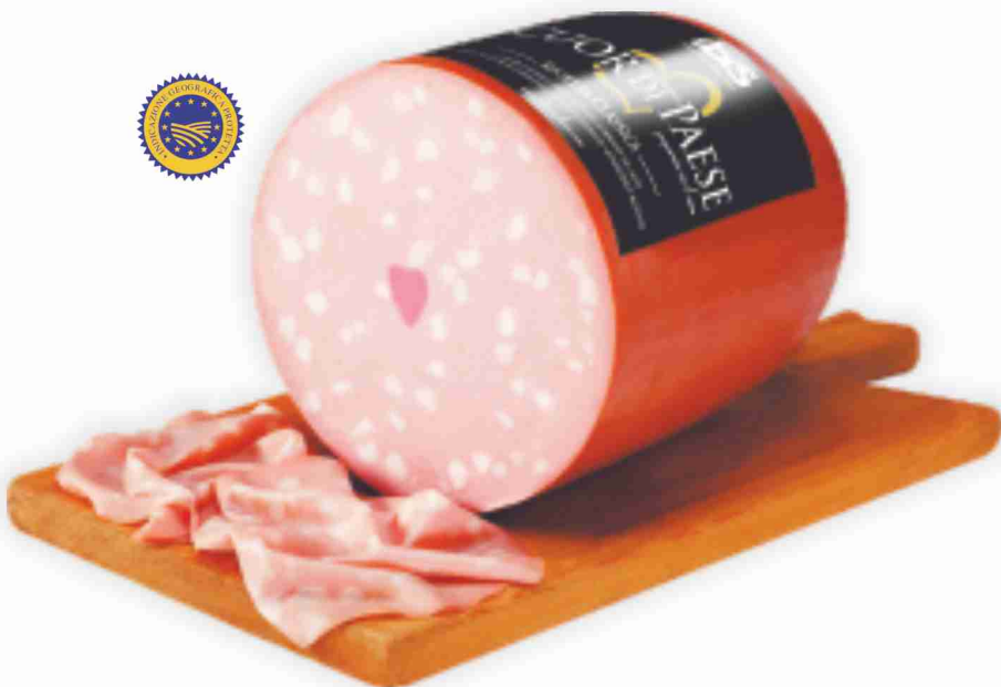
Mortadella Bologna I.G.P. Cuor di Paese Ibis al kg € 9,90