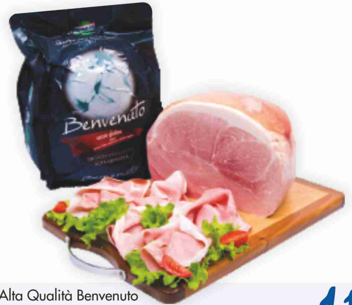
Prosciutto cotto Alta Qualità Benvenuto Kometa al kg € 11,90