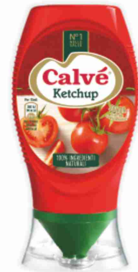
Ketchup Calvé vari tipi, ml 250 al litro € 4,76