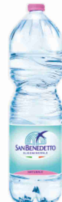
Acqua naturale San Benedetto litri 2 al litro € 0,15