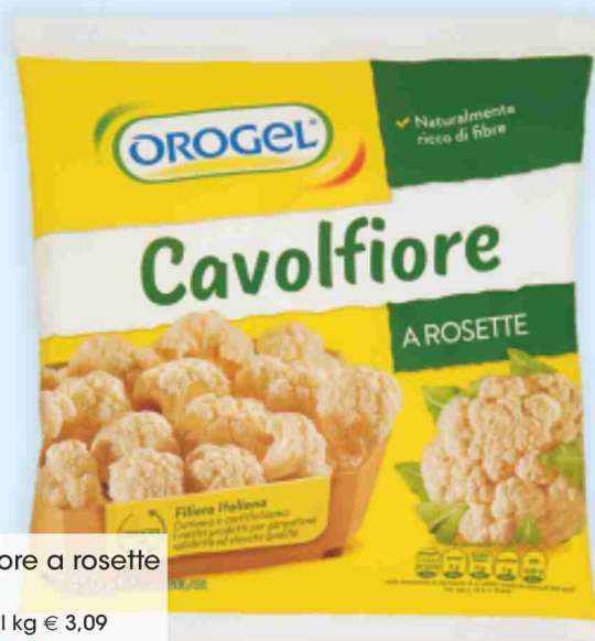
Cavolfiore a rosette Orogel g 450 al kg € 3,09