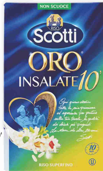
Riso Oro Insalate 10' Scotti superfino, kg 1 al kg € 1,79