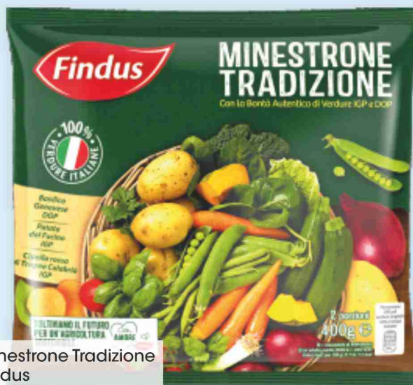
Minestrone Tradizione Findus g 400 al kg € 3,48