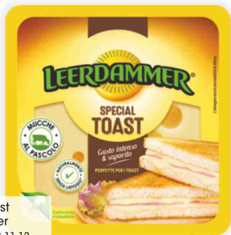
Special Toast Leerdammer g 125 al kg € 11,12