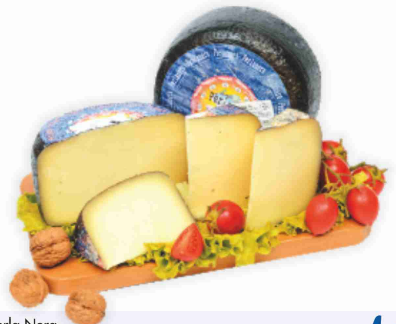
Pecorino Perla Nera Argiolas al kg € 12,90