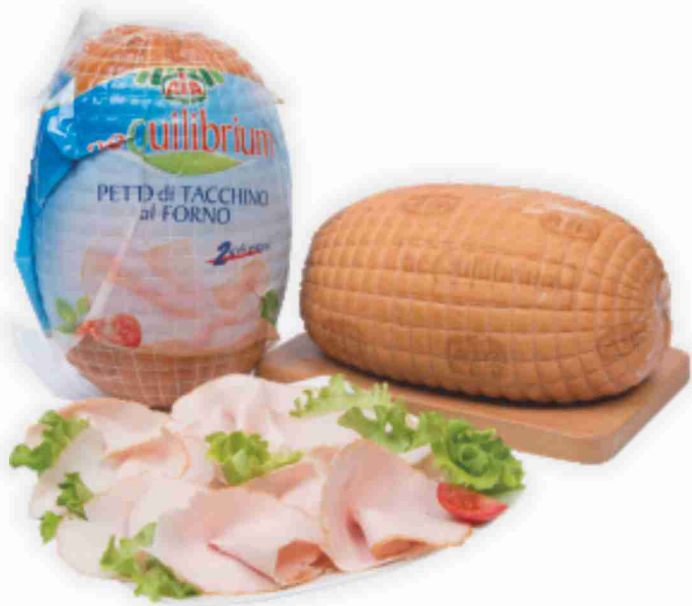
Petto di tacchino al forno Aequilibrium Aia al kg € 9,90