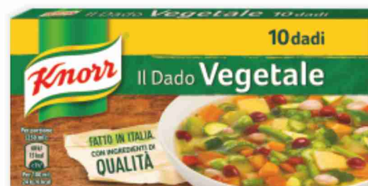
Dado Knorr vari tipi, g 100 al kg € 8,90