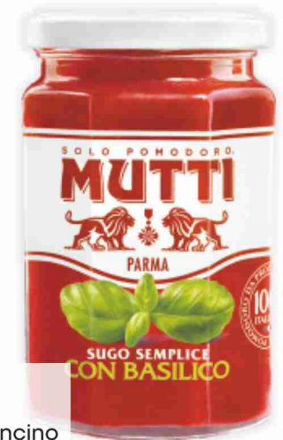
Sughi di pomodoro Mutti con basilico, peperoncino g 280 al kg € 4,25