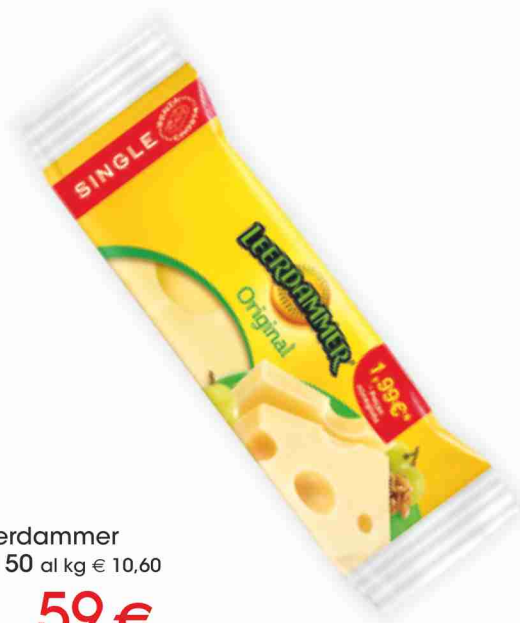
Leerdammer g 150 al kg € 10,60