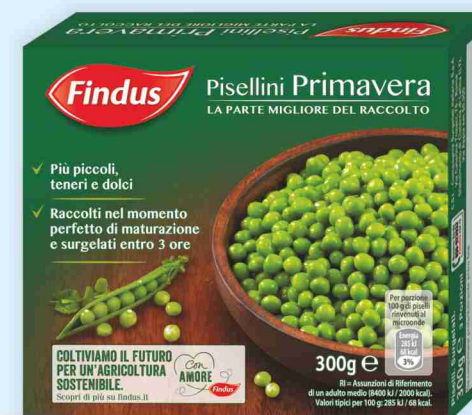
Pisellini primavera Findus g 300 al kg € 5,97