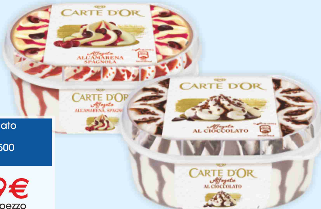
Gelato Affogato Carte d'Or vari gusti, g 500 al kg € 6,98