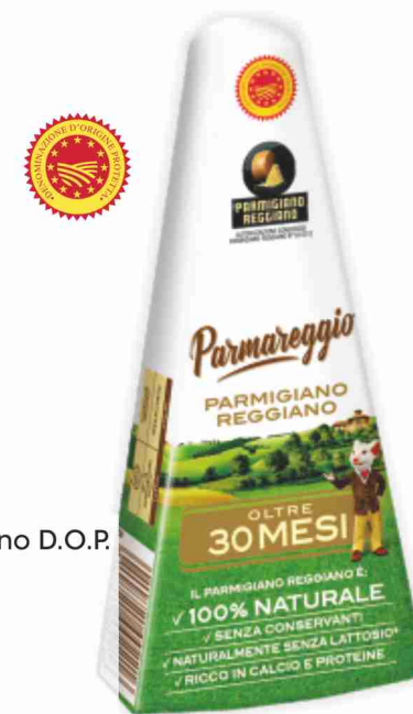
Parmigiano Reggiano D.O.P. Parmareggio 30 mesi g 250 al kg € 19,96