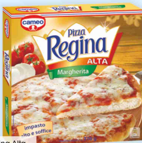
Pizza Regina Alta Cameo margherita g 370 al kg € 5,38