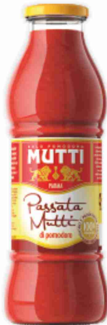
Passata di pomodoro Mutti g 400 al kg € 1,98