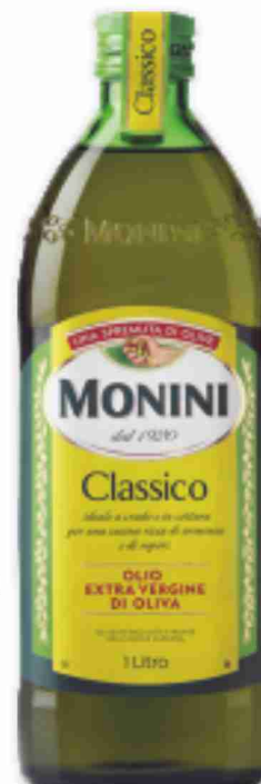
Olio E/Vergine di oliva Monini Classico litri 1 al litro € 3,89