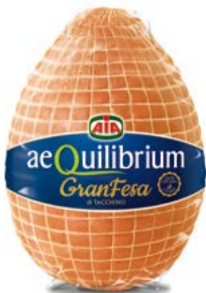
GRANFESA DI TACCHINO ARROSTO AEQUILIBRIUM AIA