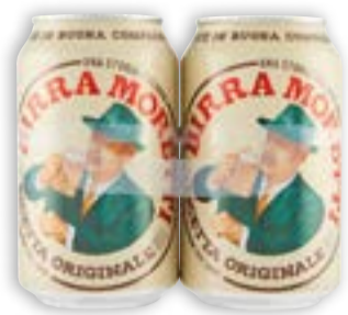
BIRRA MORETTI 2 x 33 cl € 1,80 al lt