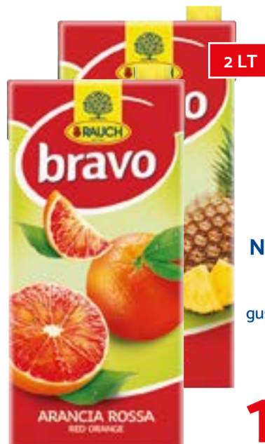
NETTARI BRAVO RAUCH gusti assortiti 2 Lt € 0,78 al lt