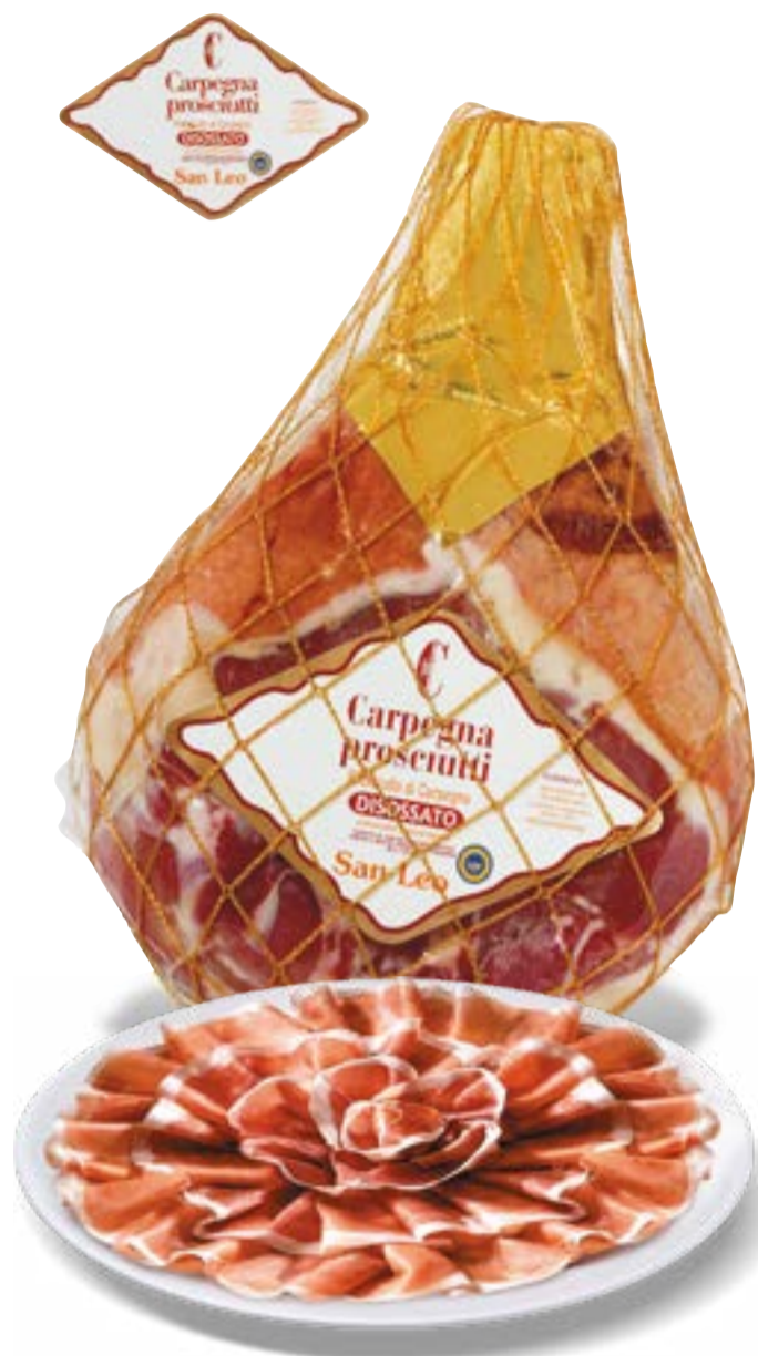
PROSCIUTTO CRUDO DOP CARPEGNA stagionato