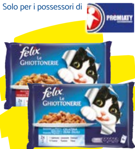
ALIMENTO PER GATTI LE GHIOTTONERIE FELIX gusti assortiti - 4 x 100 g € 3,13 al kg