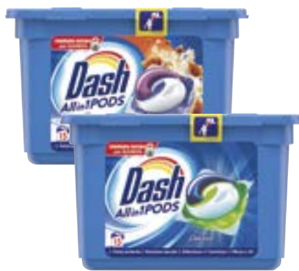
ECODOSI PODS DASH regular/lavanda/ ambra - 15 lavaggi antiodore - 13 lavaggi