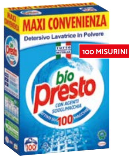
DETERSIVO LAVATRICE IN POLVERE BIO PRESTO 100 misurini/3,960 kg € 2,27 al kg