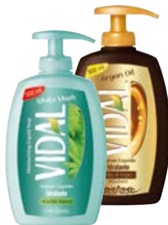
SAPONE LIQUIDO VIDAL argan oil/white musk 500 ml € 2,98 al lt