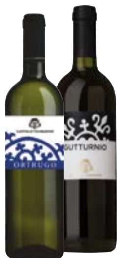
ORTRUGO/ GUTTURNIO DOC VICOBARONE frizzante - 75 cl € 2,99 al lt