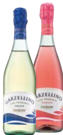
GARZELLINO IGT CIV & CIV bianco secco/amabile rosato secco 75 cl € 1,83 al lt