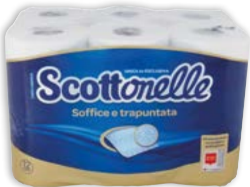
CARTA IGIENICA SCOTONELLE 12 rotoli