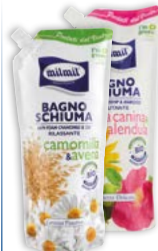
1 PEZZO € 2,29