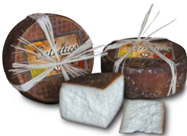
PECORINO SALVATICO F.LLI PETRUCCI