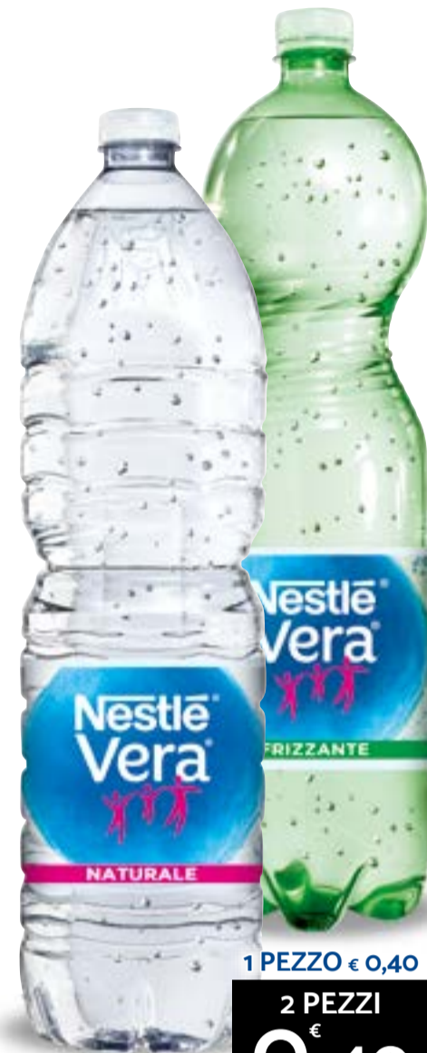
1 PEZZO € 0,40