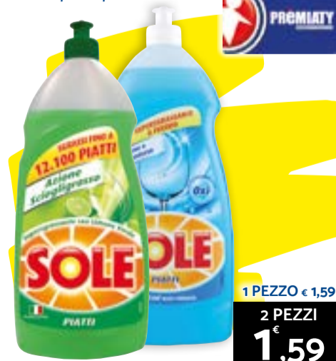
1 PEZZO € 1,59