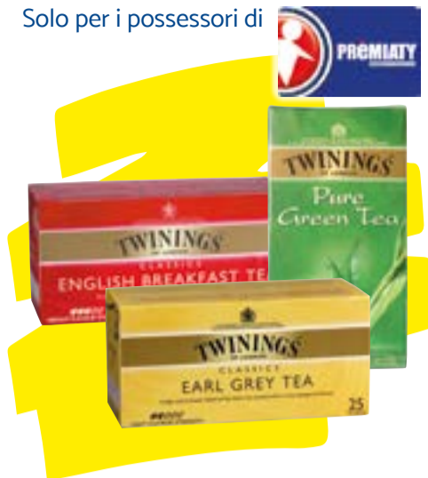
THE TWININGS assortiti - 25 filtri/50 g € 49,80 al kg