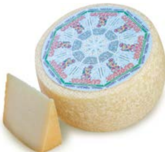
FORMAGGIO DI CAPRA CAPRIDOR ARGIOLAS