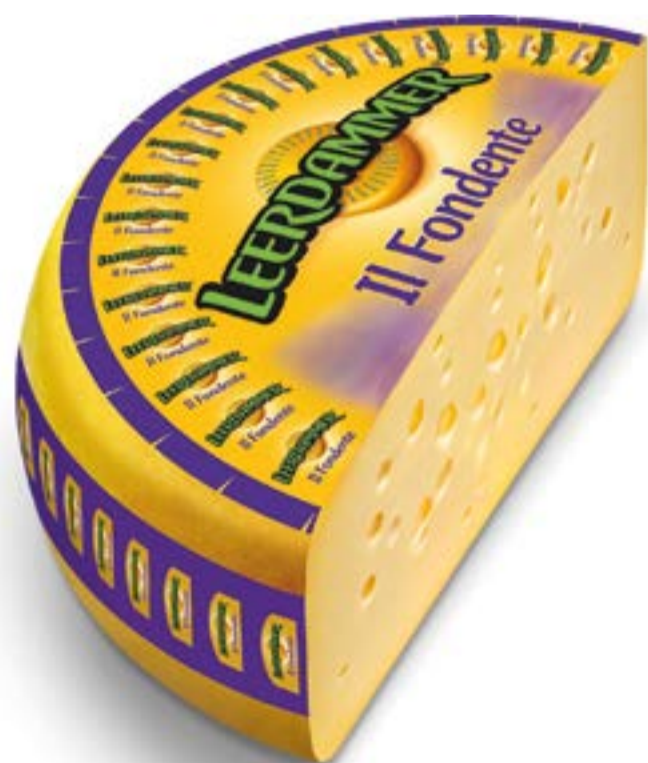
FORMAGGIO IL FONDENTE LEERDAMMER