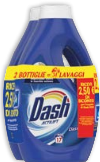
DETERSIVO LIQUIDO LAVATRICE DASH 2 x 17 lavaggi € 3,03 al lt