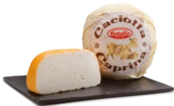
CACIOTTA DI CAPRA BOTALLA