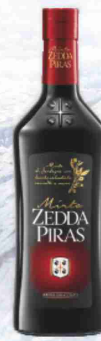
Mirto rosso di Sardegna Zedda Piras cl 50