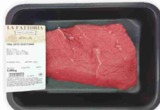
Tagliata di scottona La Fattoria