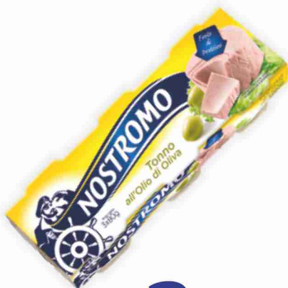
Tonno all'olio di oliva Nostromo g 80x3