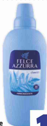
Ammorbidente Felce Azzurra 30 lavaggi