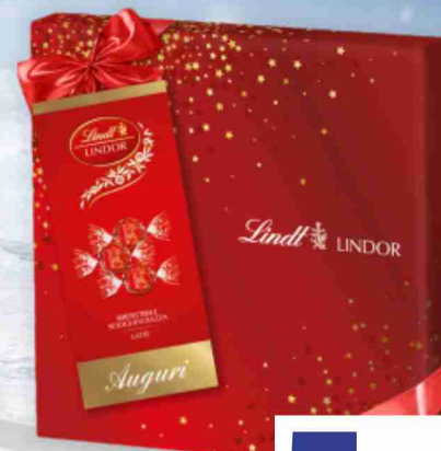
Praline Lindor Lindt latte, fondente, assortite g 287