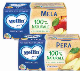
Omogeneizzati alla frutta Mellin vari gusti g 100x2