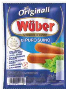
Würstel di suino Wüber g 100