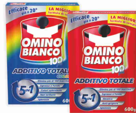
Additivo per bucato 100 più Omino Bianco normale, color g 600