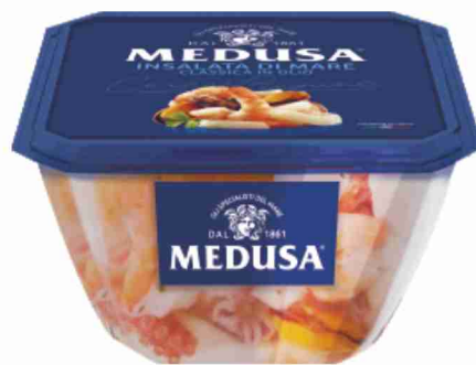
Insalata di mare Medusa g 150