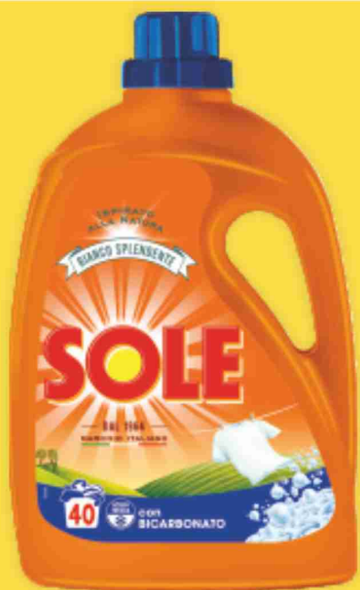
Detersivo liquido Sole vari tipi 40/37 lavaggi