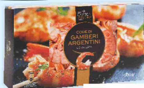
Code di gamberi argentini g 300