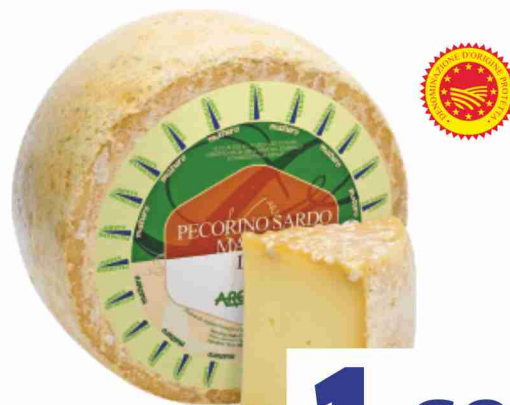
Pecorino Sardo maturo D.O.P. Argiolas al kg 16,90