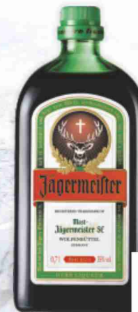
Amaro Jägermeister cl 70