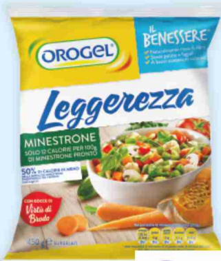
Minestrone leggerezza Orogel g 450