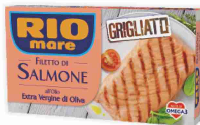
Salmone grigliato Rio Mare all'olio E/Vergine di oliva, al naturale g 125