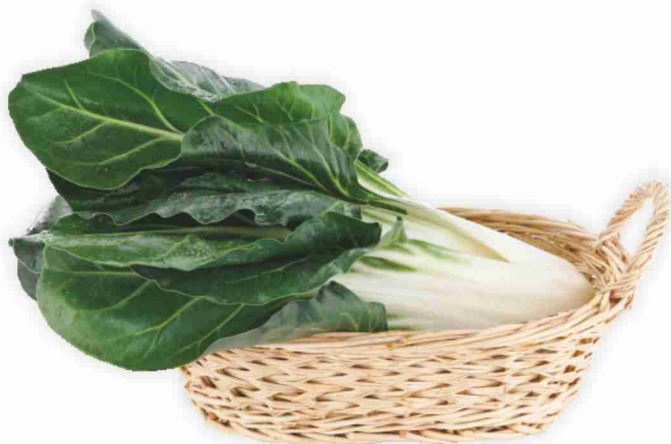
Biete da costa