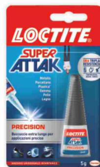
Super Attak Loctite g 5