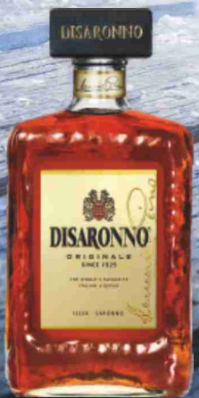
Amaretto Disaronno cl 70