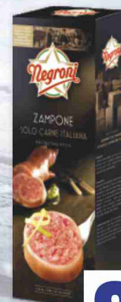
Zampone Negroni kg 1