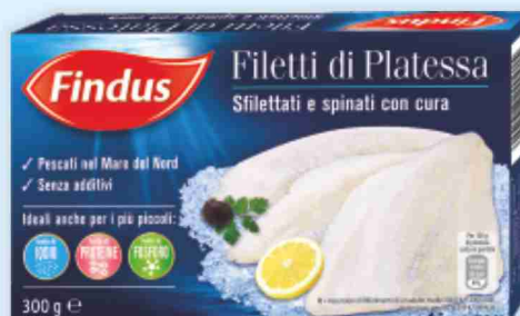
Filetti di platessa Findus g 300