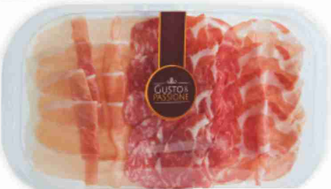
Antipasto emiliano g 120