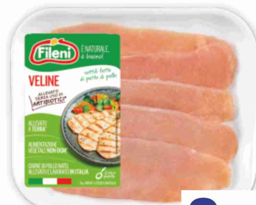
Veline di pollo Fileni