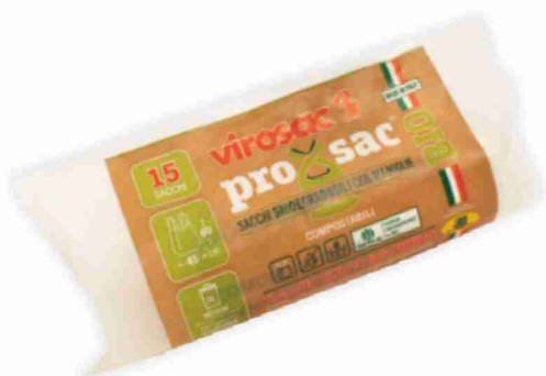
Sacchi biodegradabili con maniglie Virosac cm 45x60, pezzi 15