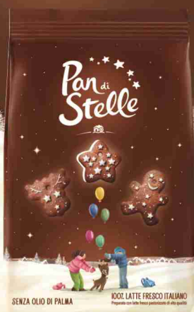
Biscotti g 350