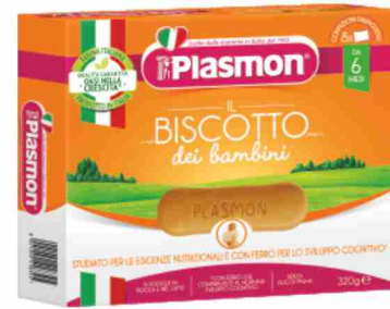
Biscotto Plasmon g 320