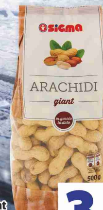
Arachidi Giant Sigma g 500