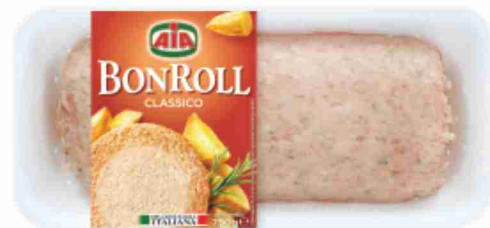
Bon Roll Aia classico, con speck g 750