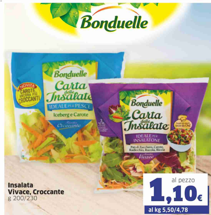
Insalata Vivace, Croccante g 200/230