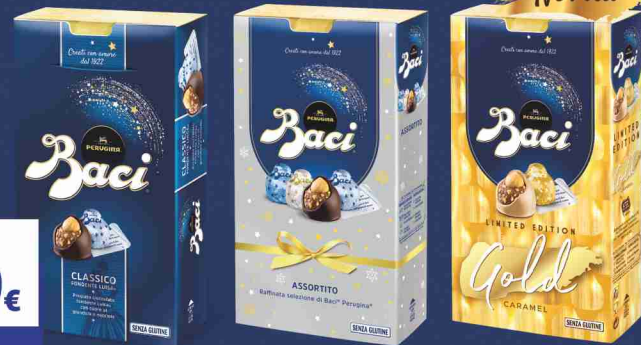
Baci vari tipi g 200/150