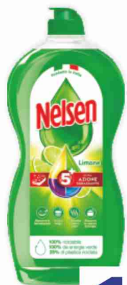
Detersivo per piatti Nelsen vari tipi ml 900