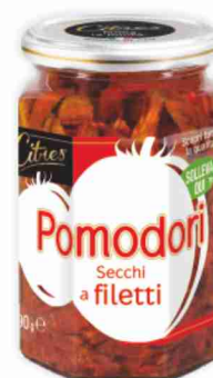
Pomodori secchi a filetti Citres g 290