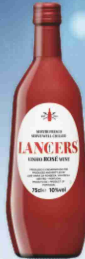
Vino rosé Lancers cl 75