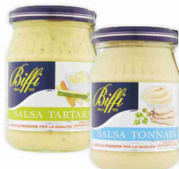
Salse Biffi vari tipi g 180/247