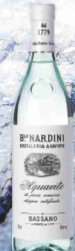
Acquavite Nardini cl 70