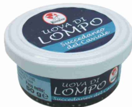
Uova di lompo Riunione nere, rosse g 50