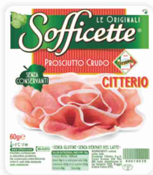
Prosciutto crudo Sofficette Citterio g 60