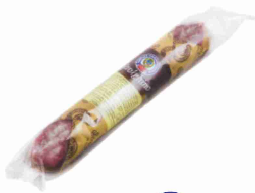
Strolghino Cav. Umberto Boschi g 190