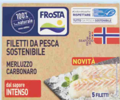
Filetti di merluzzo carbonaro Frosta g 240