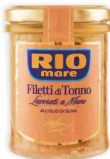
Filetti di tonno Rio Mare vari tipi g 180