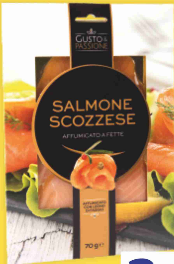
Salmone scozzese affumicato g 70