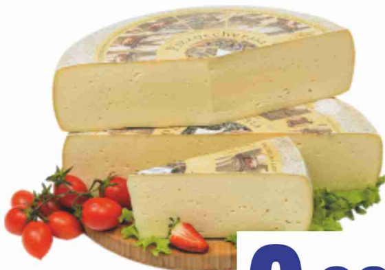
Pizzoccheraia Latteria Sociale Valtellina al kg 9,90