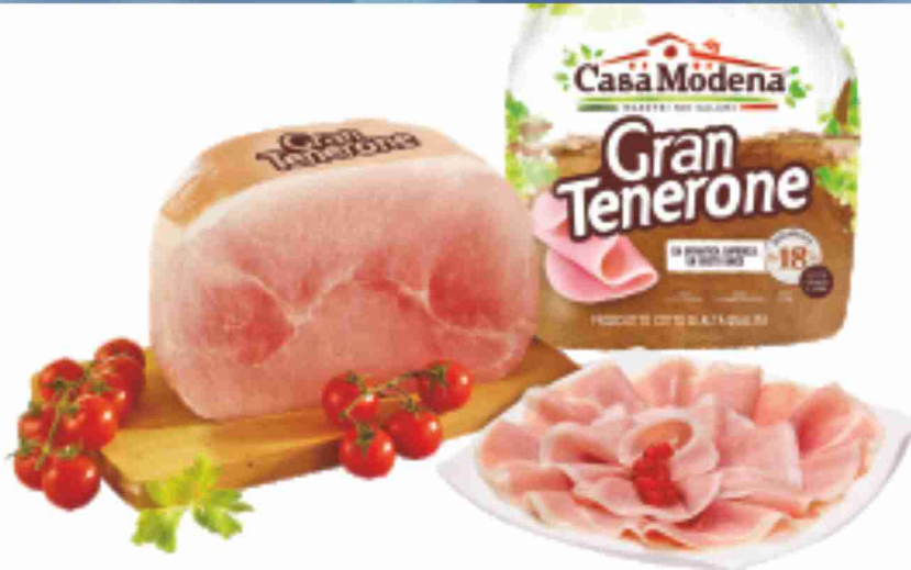
Prosciutto cotto di Alta Qualità Gran Tenerone Casa Modena al kg 14,90