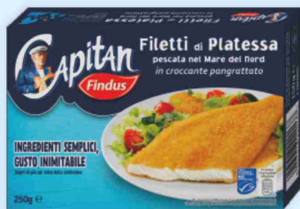
Filetti di platessa impanati Findus g 250