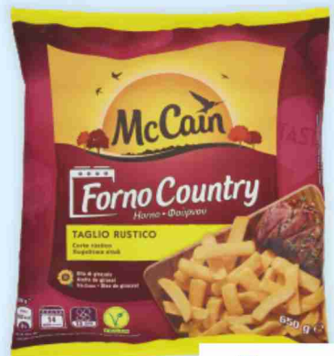
Patate Forno Country McCain g 650