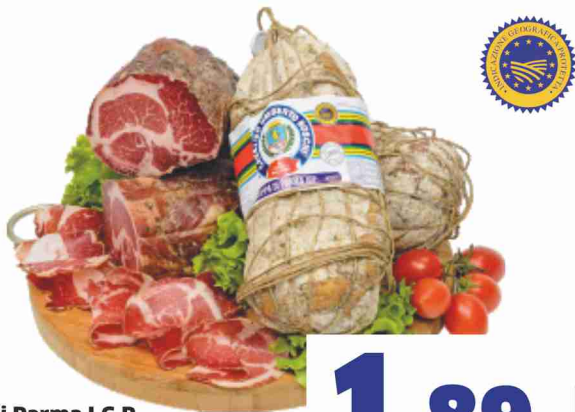
Coppa di Parma I.G.P. Cav. Umberto Boschi al kg 18,90