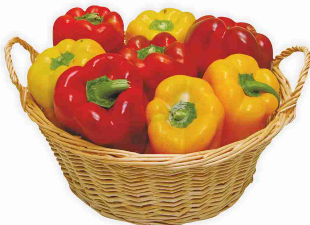
Peperoni gialli e rossi