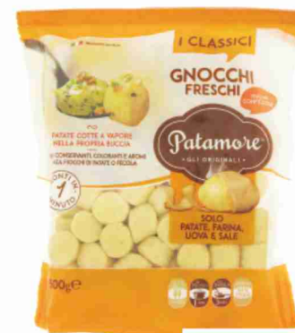
Gnocchi freschi Patamore g 500