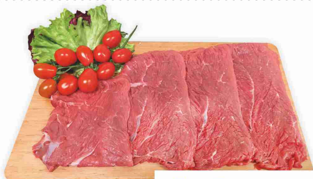
Scaloppe di bovino adulto femmina