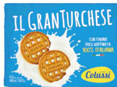
Biscotti Il Granturche Colussi g 400