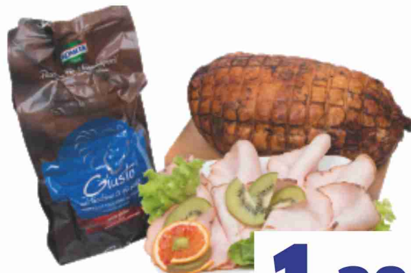
Petto di tacchino rustico Kometa al kg 13,90