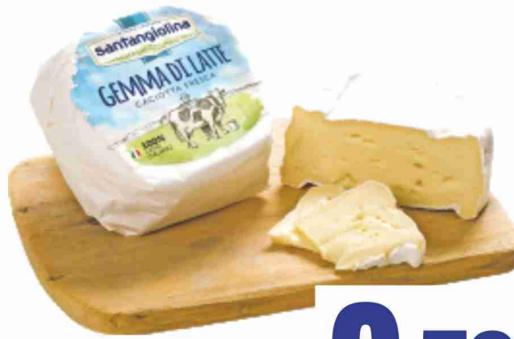
Caciotta fresca Gemma di latte Santangiolina al kg 7,90