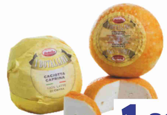
Caciotta caprina Botalla al kg 18,90