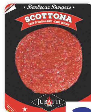
Maxi burger di scottona Jubatti BBQ g 200