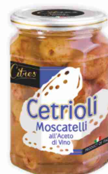
Cetrioli Moscatelli all'aceto di vino Citres g 540, sgocc. g 330