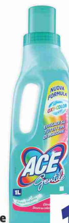
Candeggina Gentile Ace vari tipi litri 1