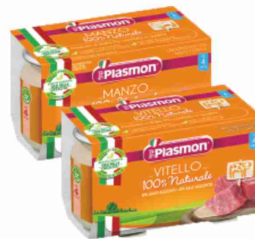
Omogeneizzati di carne Plasmon vari gusti g 80x2