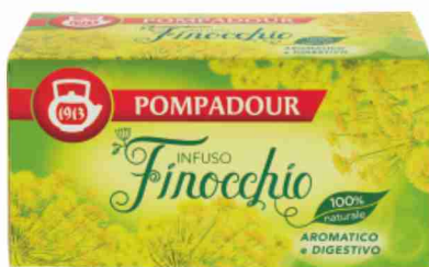
Infusi Pompadour vari tipi, 20 filtri da g 60 a g 30