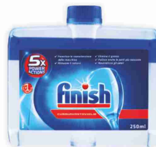
Curalavastoviglie Finish liquido vari tipi ml 250 tabs pezzi 3