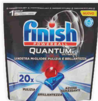
Detersivo per lavastoviglie Finish Quantum Ultimate classico, limone 20 tabs