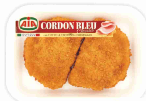
Cordon Bleu Aia classico g 245