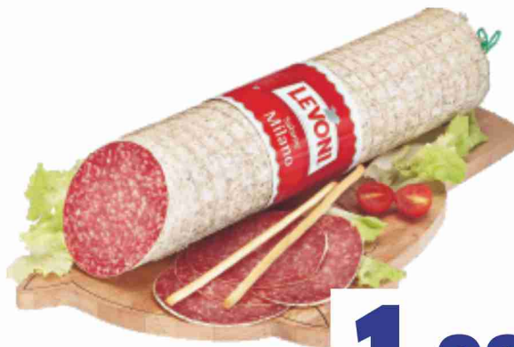
Salame Milano Levoni al kg 19,90