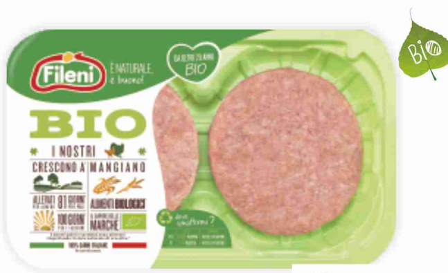
Hamburger di pollo BIO Fileni g 200