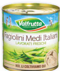
Fagiolini medi Valfrutta g 400