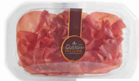
Bresaola g 80