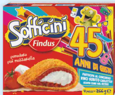
Sofficini Findus vari gusti g 266