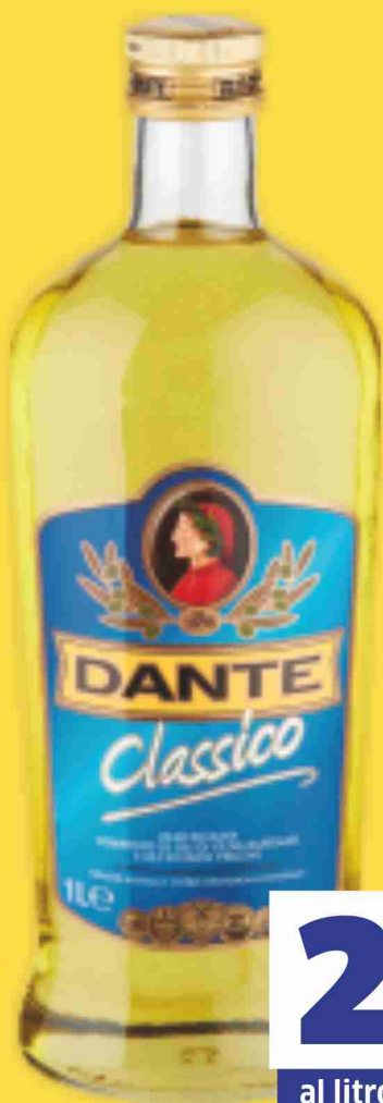
Olio di oliva Dante Classico litri 1