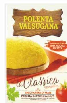
Polenta Valsugana vari tipi g 375/330