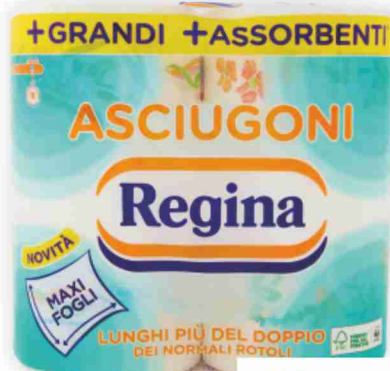
Asciugoni maxi Regina 2 rotoli