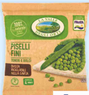
Piselli fini La Valle degli Orti g 450