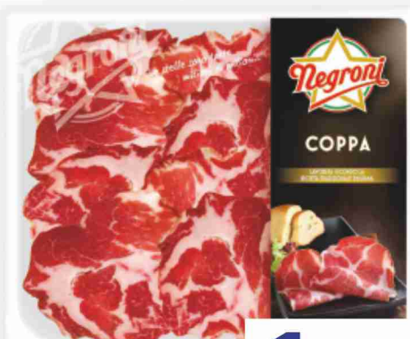
Coppa Negroni g 100