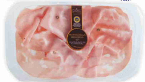
Mortadella I.G.P. g 110