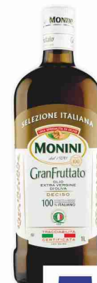
Olio E/Vergine di oliva Monini Gran Fruttato litri 1