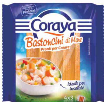
Bastoncini di mare Coraya g 180