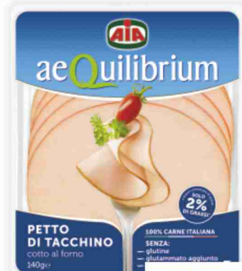
Petto di tacchino al forno Aequilibrium Aia g 140