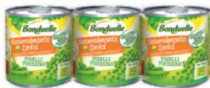
Piselli finissimi Bonduelle g 160x3