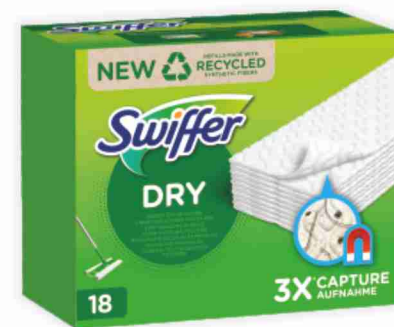
Panni Swiffer vari tipi pezzi 18/16/12