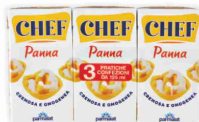
Panna da cucina Chef Parmalat ml 125x3