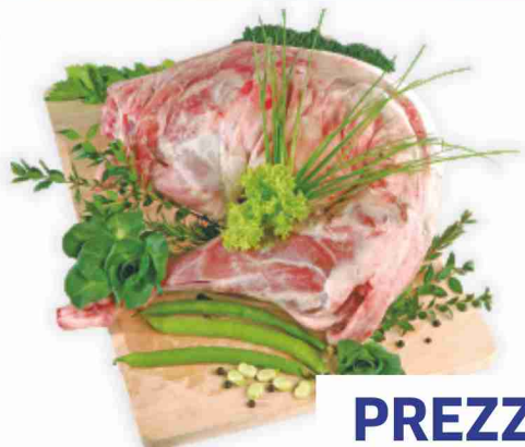
Agnello di Sardegna I.G.P. intero o metà