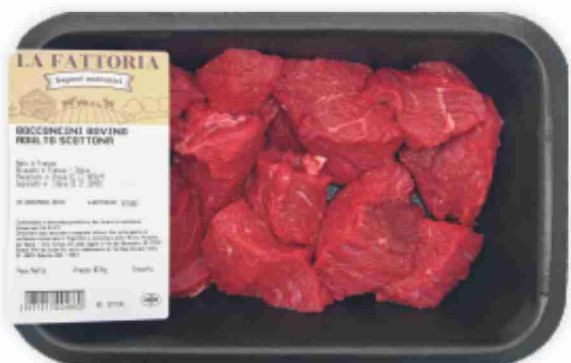
Bocconcini di scottona La Fattoria