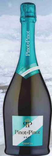
Spumante brut Pinot di Pinot Gancia cl 75