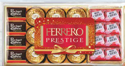
Prestige Ferrero g 246