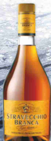
Brandy stravecchio Branca cl 70