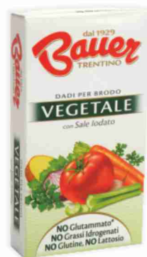
Dadi Bauer vari tipi g 60