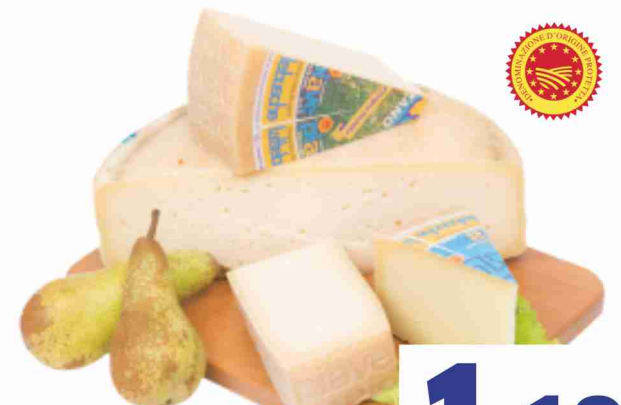
Piave D.O.P. Centro Veneto Formaggi al kg 11,90