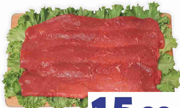
Fettine sceltissime di coscia di bovino adulto femmina