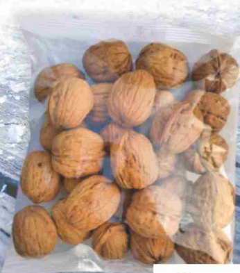
Noci calibro 36+ Eurocereali g 350