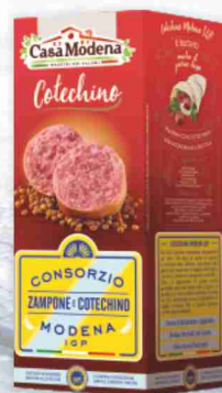
Cotechino Modena I.G.P. Casa Modena g 500