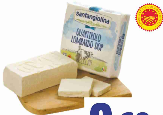
Quartiolo Lombardo D.O.P. Santangiolina al kg 6,90