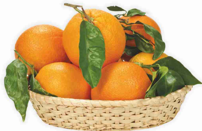
Arance Navel con foglia