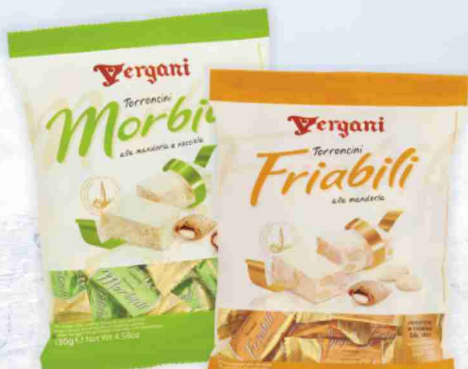
Torroncini Vergani vari tipi g 130