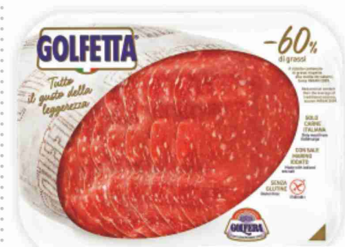
Salame Golfetta Golfera g 100