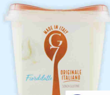
Gelati G7 vari gusti g 500