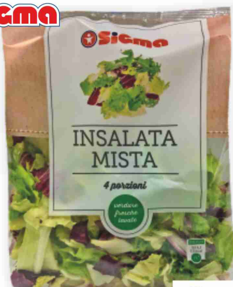
Insalata mista g 200