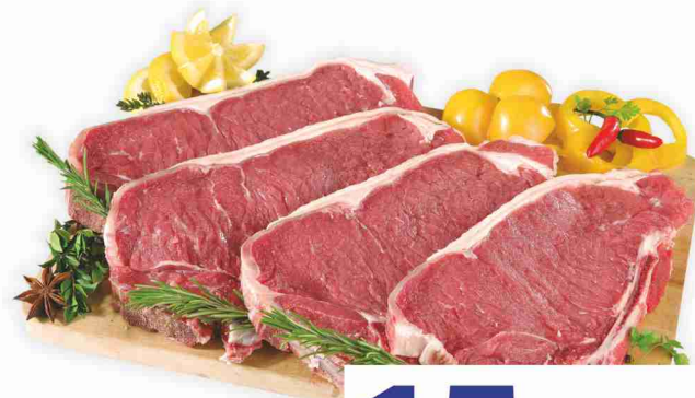
Costata di bovino adulto femmina con osso