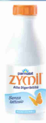
Latte U.H.T. Zymil Parmalat parz. scremato litri 1