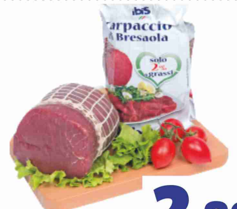
Carpaccio di bresaola Ibis al kg 28,90