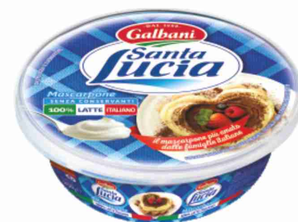
Mascarpone Santa Lucia Galbani g 250