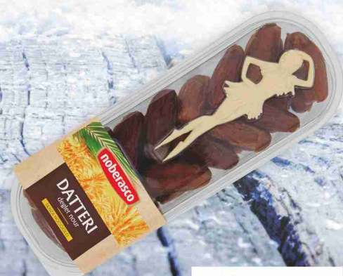
Datteri denocciolati Noberasco g 200