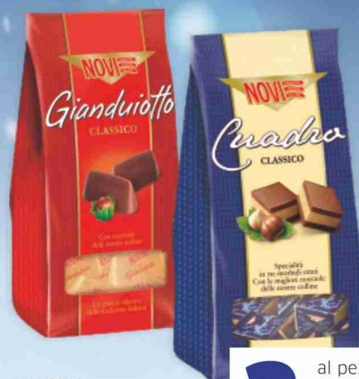
Ciocolatini Novi vari tipi da g 160 a g 130