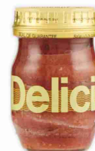
Filetti di alici in olio di oliva Delicious g 90