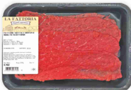
Fettine sottili di scottona La Fattoria