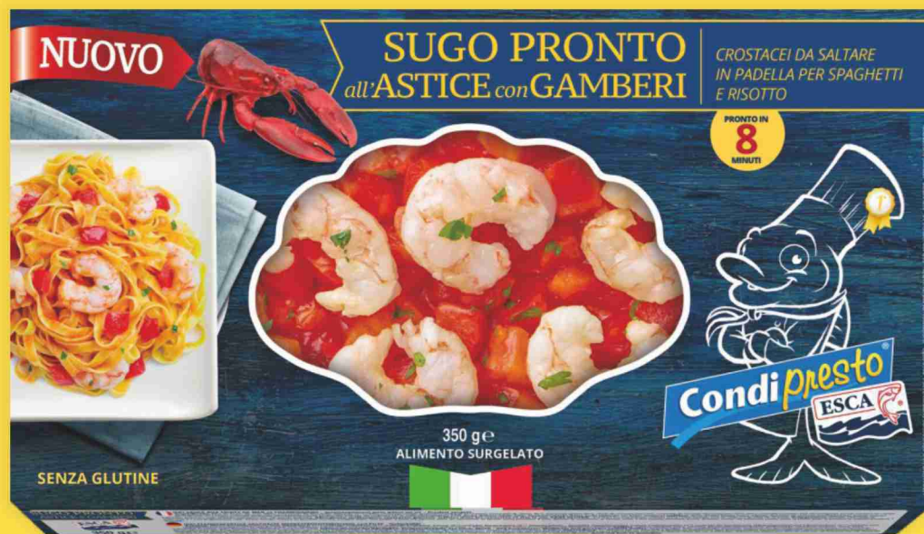
Sugo pronto all'astice con gamberi Esca g 350