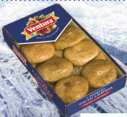
Fichi Lerida Ventura g 250