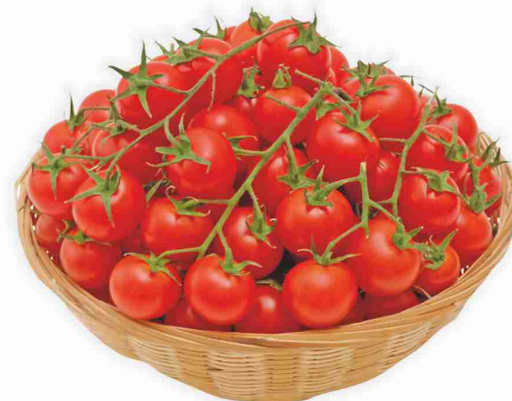
Pomodori ciliegino g 500