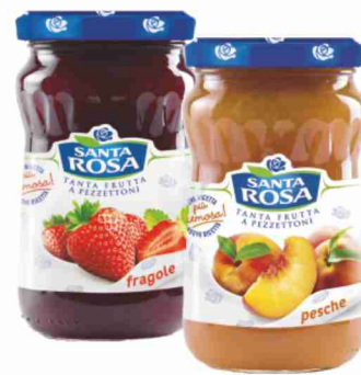
Confetture Santa Rosa vari gusti g 350