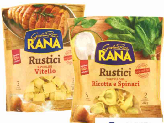
Pasta fresca ripiena Rustici Rana vari tipi g 250