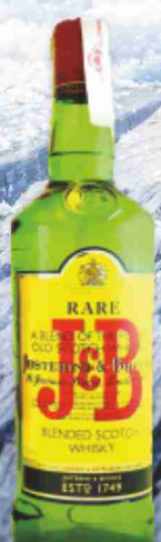
Whisky J&B cl 70