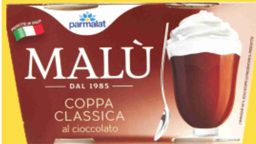
Coppa Malù Parmalat classica g 200