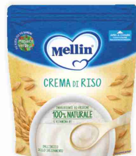
Crema Mellin vari tipi g 200