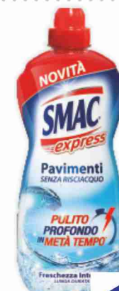
Detergente per pavimenti Smac Express vari tipi litri 1