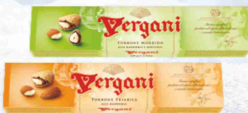
Torrone Vergani friabile alle mandorle, morbido alle mandorle e nocciole g 150