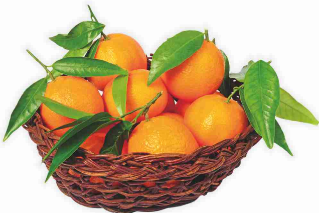
Clementine con foglia