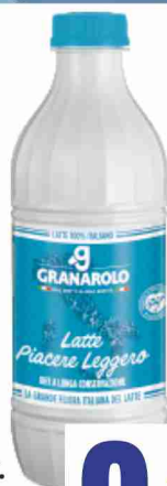
Latte U.H.T. Granarolo piacere leggero parz. scremato litri 1