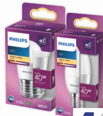
Lampadine LED Philips luce calda, naturale vari tipi, 40/60W