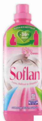
Detersivo per capi delicati Soflan classic 15 lavaggi