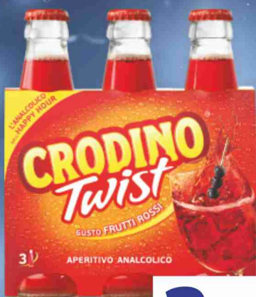
Aperitivo analcolico Crodino Twist vari tipi cl 17,5x3