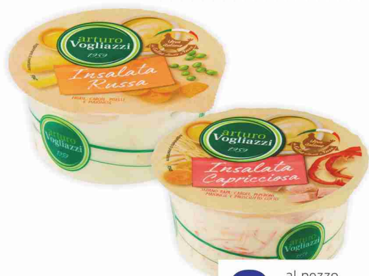
Insalate Vogliazzi capricciosa, russa g 150