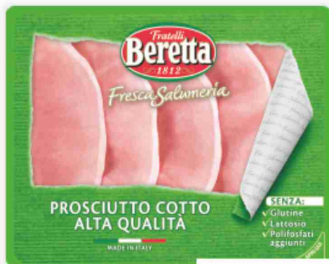
Prosciutto cotto Fresca Salumeria Beretta g 120