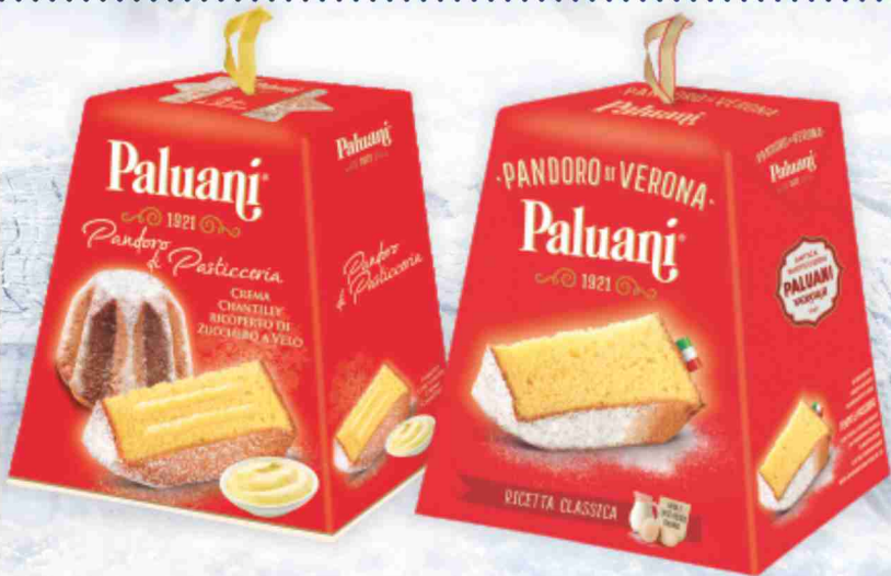
Pandoro Paluanj vari tipi kg 1/g 750