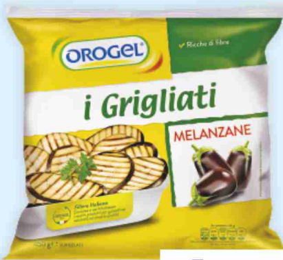
Melanzane grigliate Orogel g 450