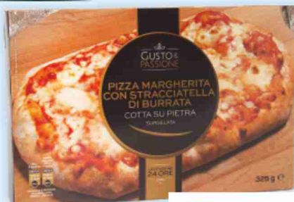
Pizza margherita con stracciatella di burrata, salsiccia e friarielli g 325/330