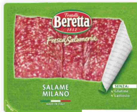
Salame Milano Fresca Salumeria Beretta g 100