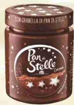
Crema spalmabile g 330