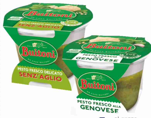
Pesto fresco Buitoni alla genovese, senz'aglio g 130