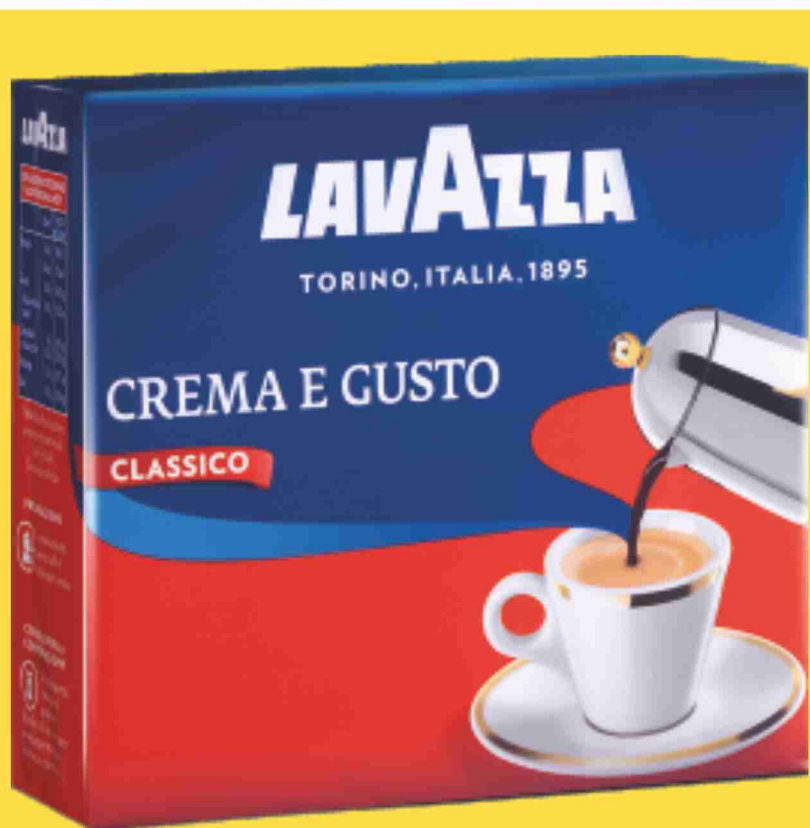
Caffè Crema e Gusto Lavazza classico g 250x2