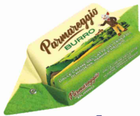
Burro Parmareggio g 200