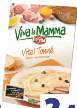
Vitel tonné Viva la Mamma Beretta g 180