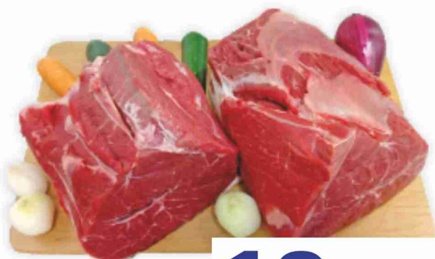
Polpa di bovino adulto femmina per brasato