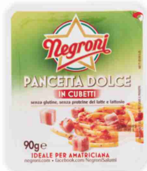
Pancetta a cubetti Negroni dolce, affumicata g 90