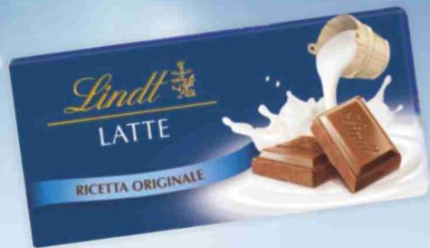
Tavolette di cioccolato Lindt latte, fondente g 100