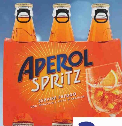
Spritz Aperol cl 17,5x3