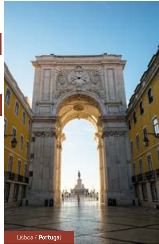
Lisboa / Portugal

Visita panorámica de la ciudad. Tarde libre.