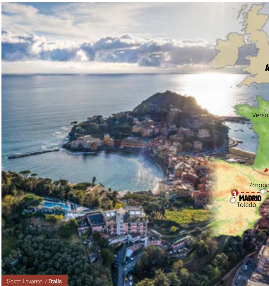
Sestri Levante / Italia