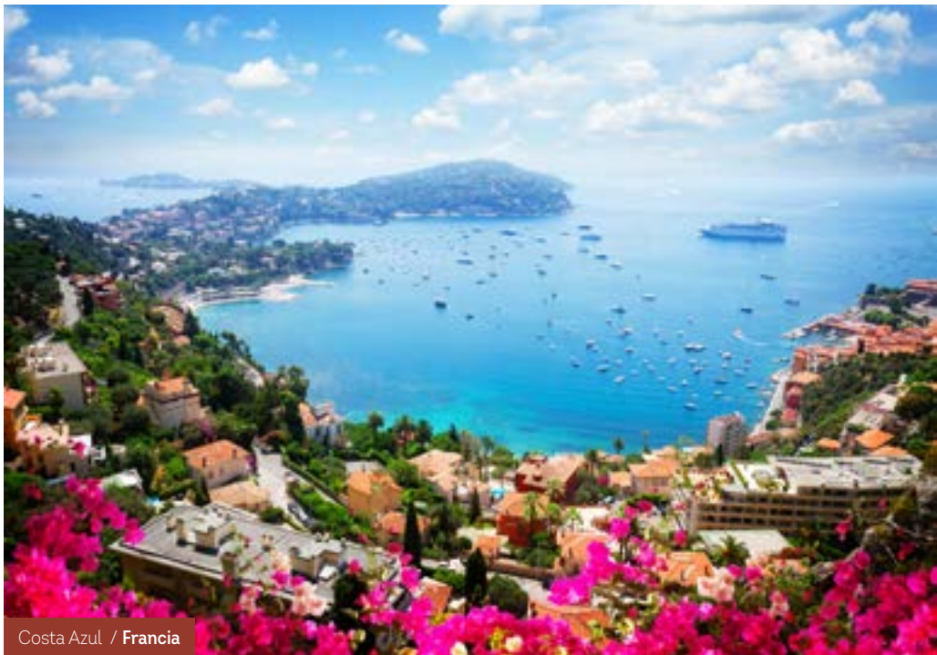
Costa Azul / Francia