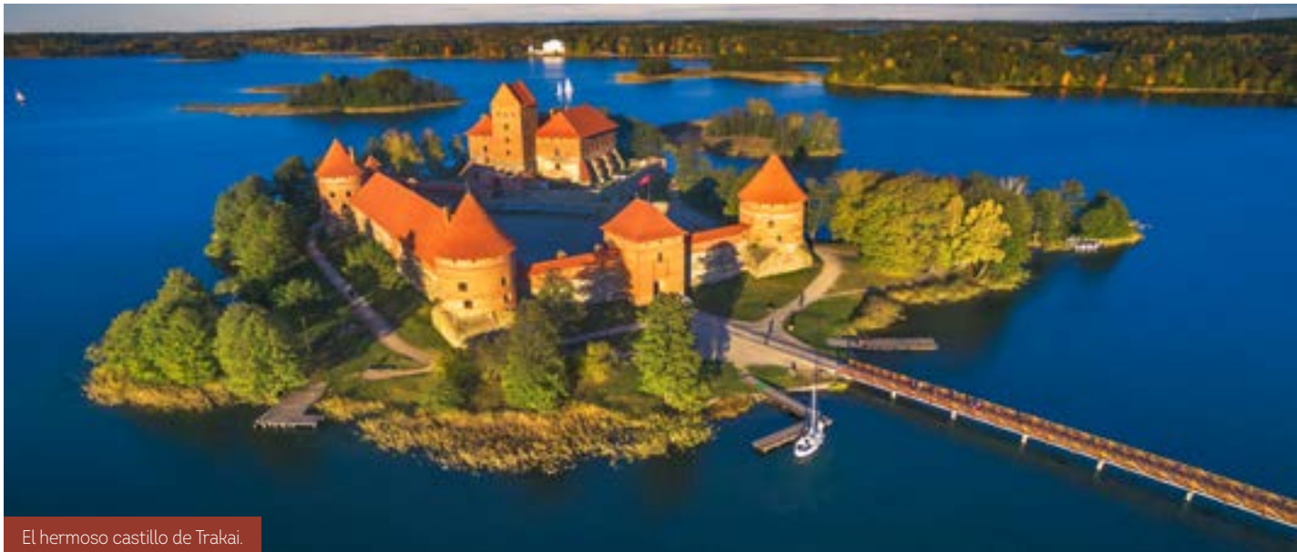
El hermoso castillo de Trakai.