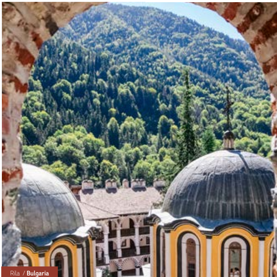
Rila / Bulgaria

Después del desayuno, fin de los servicios.