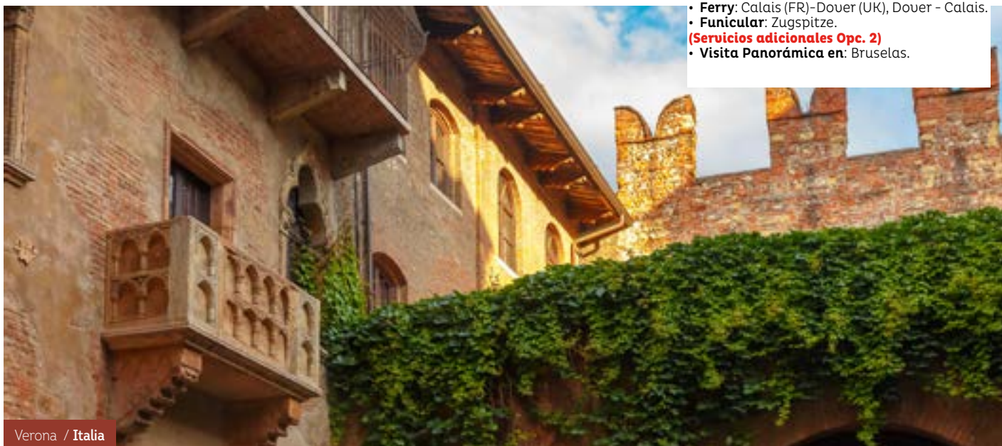
Verona / Italia