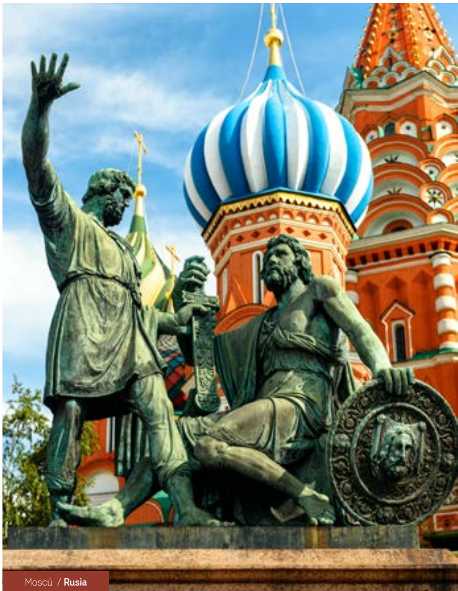
Moscú / Rusia

Visita panorámica de Copenhague, la capital danesa, la mayor ciudad de Escandinavia.