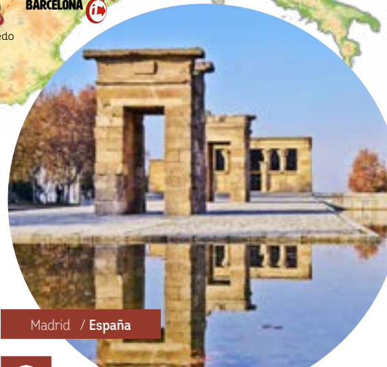
Madrid / España