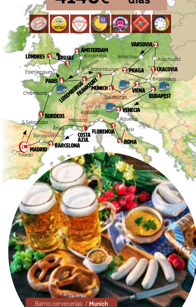
Barrio cervecerías / Munich

En nuestra primera parada tras salir de Barcelona tomaremos un trenecito turístico para conocer las bodegas de Freixenet. Posteriormente parada en Zaragoza donde puede conocer la Basílica del Pilar. Llegada a Madrid al final del día. Fin de los servicios.