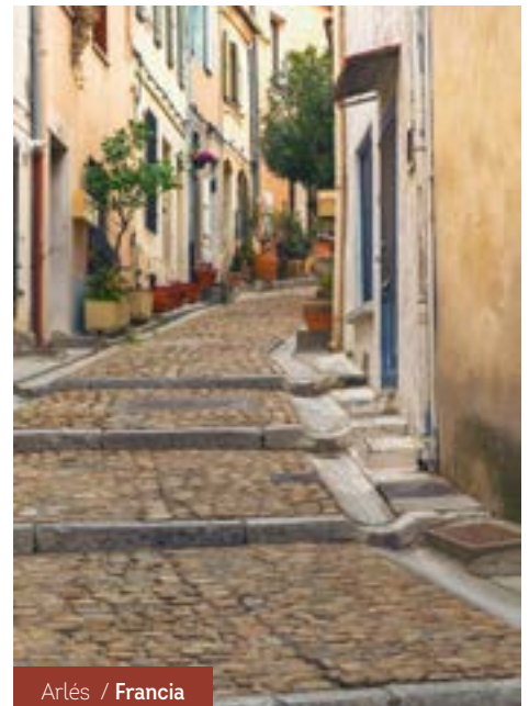
Arlés / Francia