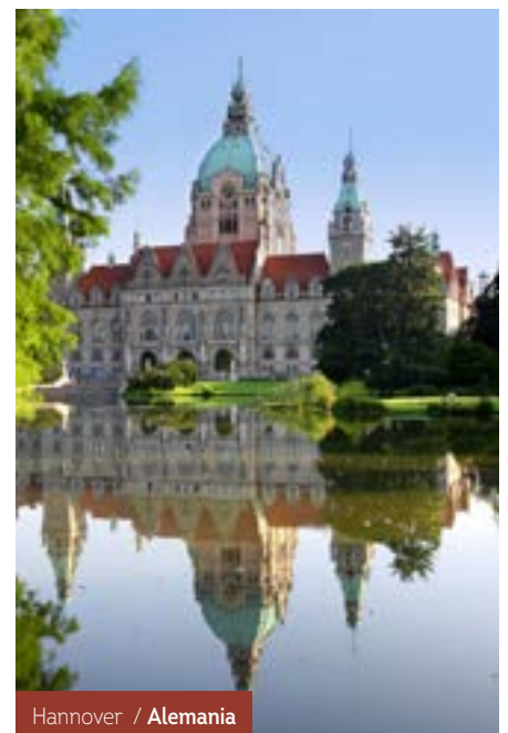
Hannover / Alemania