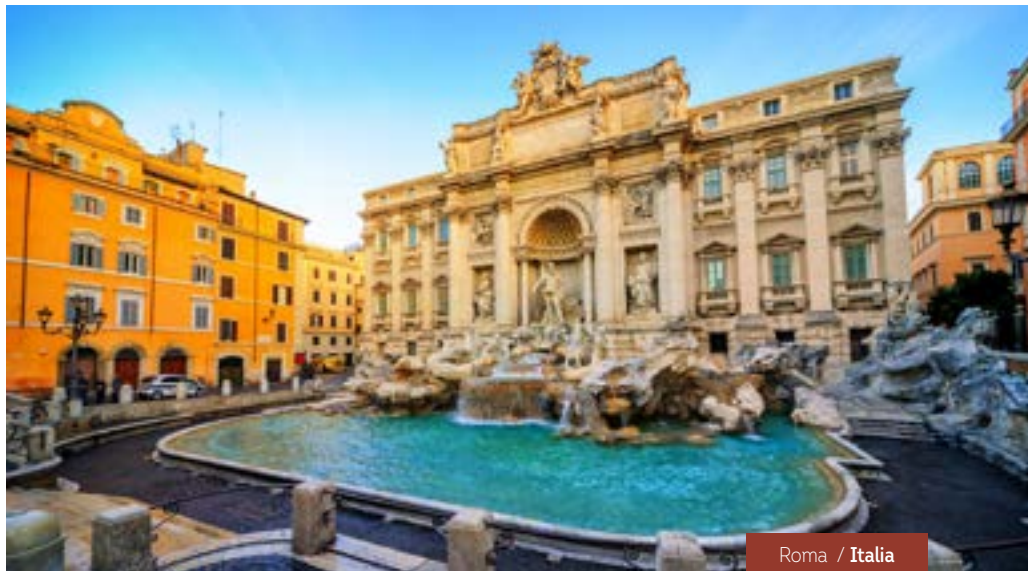
Roma / Italia