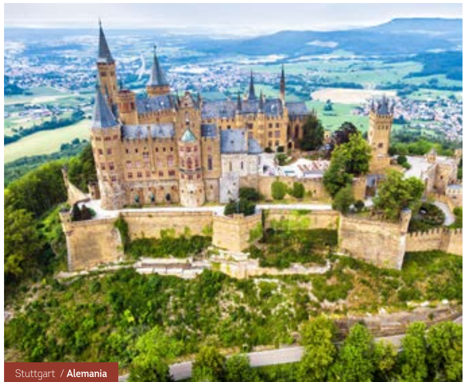
Stuttgart / Alemania

Etapas de paisajes extraordinarios de alta montaña. Subimos en teleférico a Reutte,