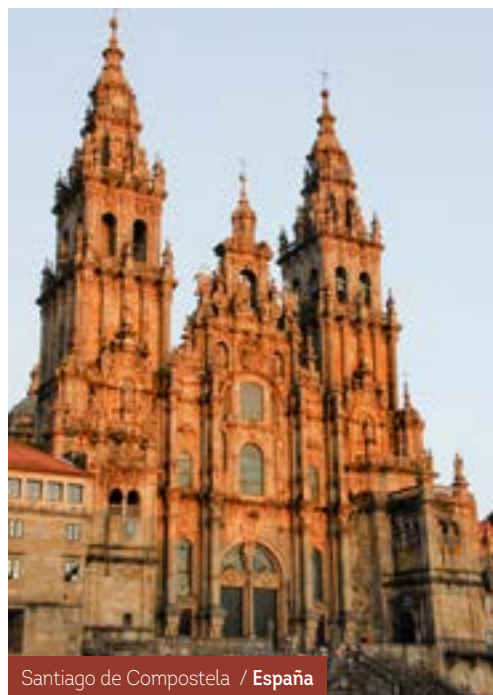
Santiago de Compostela / España