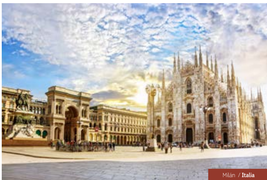
Milán / Italia