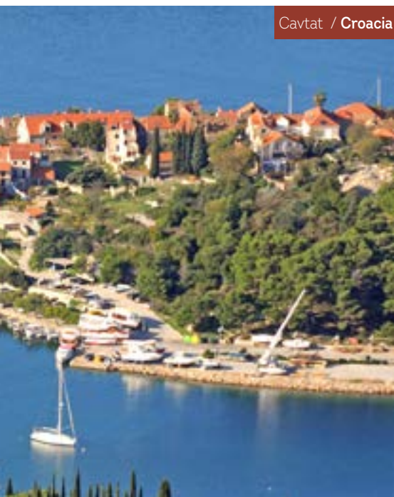
Cautat / Croacia

Después del desayuno, fin de los servicios.