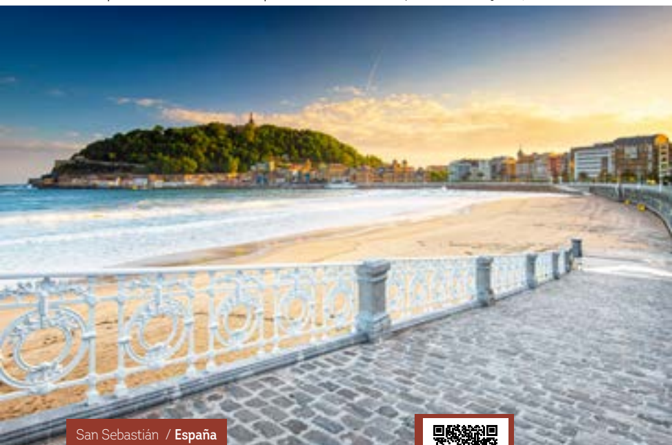
San Sebastián / España