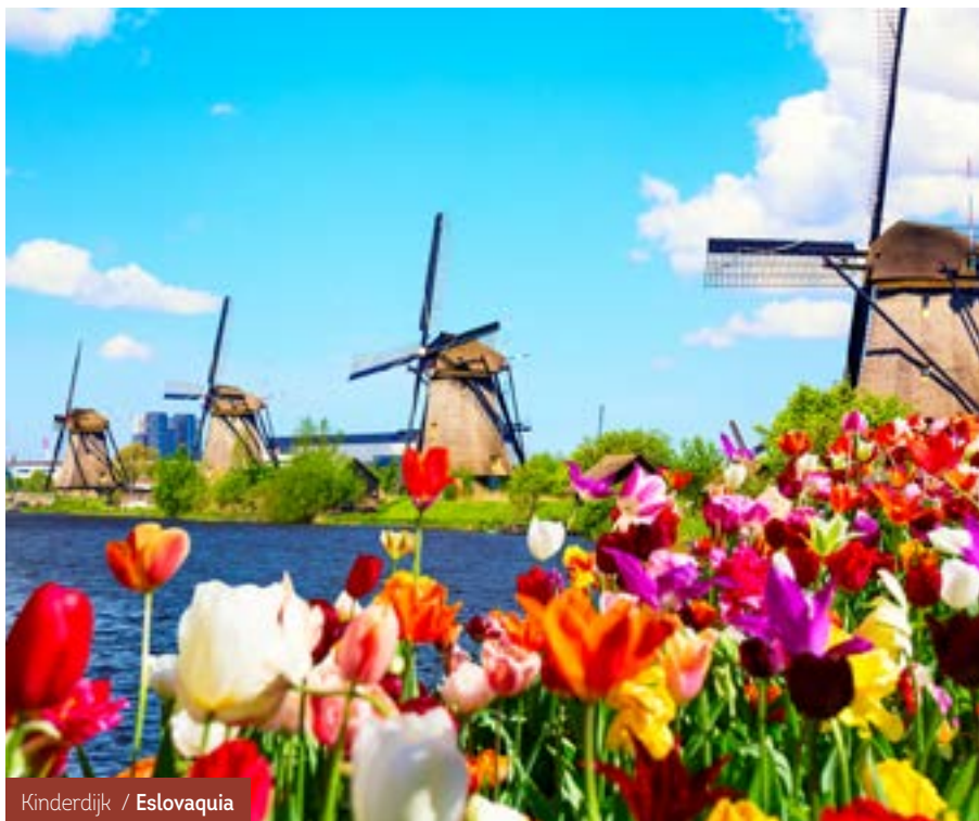
Kinderdijk / Eslovaquia