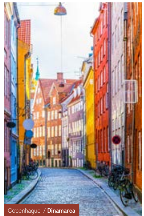
Copenhague / Dinamarca