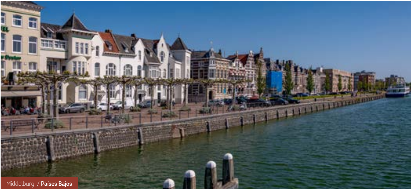
Middelburg / Países Bajos