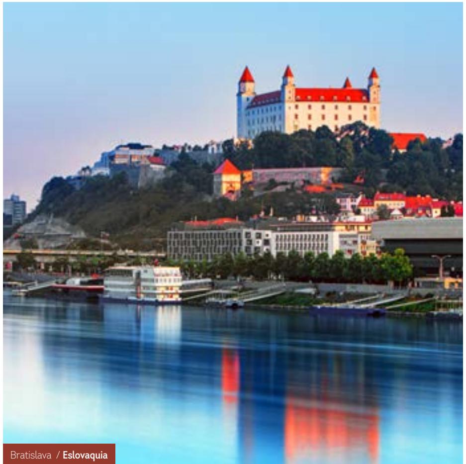
Bratislava / Eslovaquia

Etapa de paisajes extraordinarios de alta montaña. Subimos en teleférico a Reutte, en Alemania, para ver la panorámica de cumbres nevadas y disfrutar de los Alpes. Caminaremos