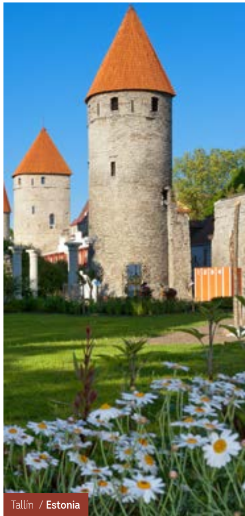
Tallin / Estonia

Después del desayuno, fin de los servicios.