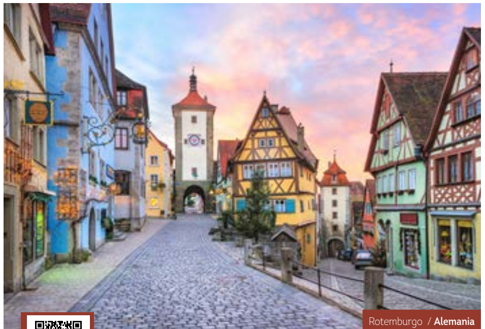
Rotemburgo / Alemania