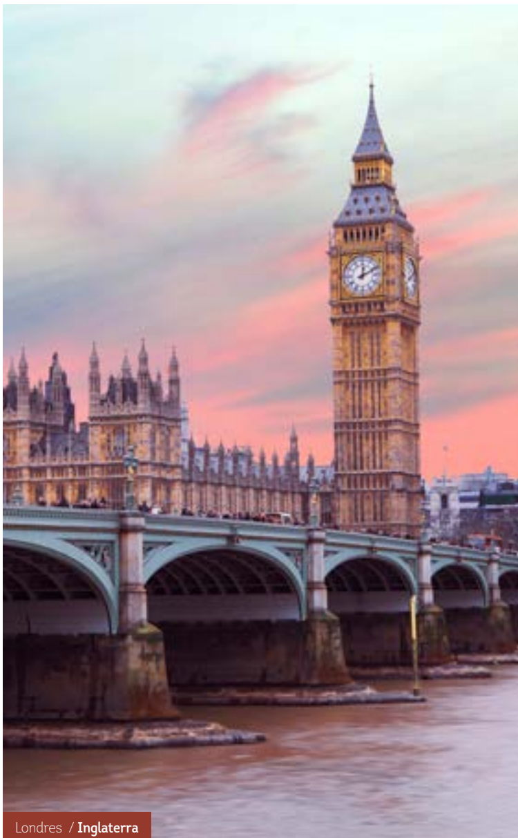
Londres / Inglaterra

Después del desayuno, fin de los servicios.