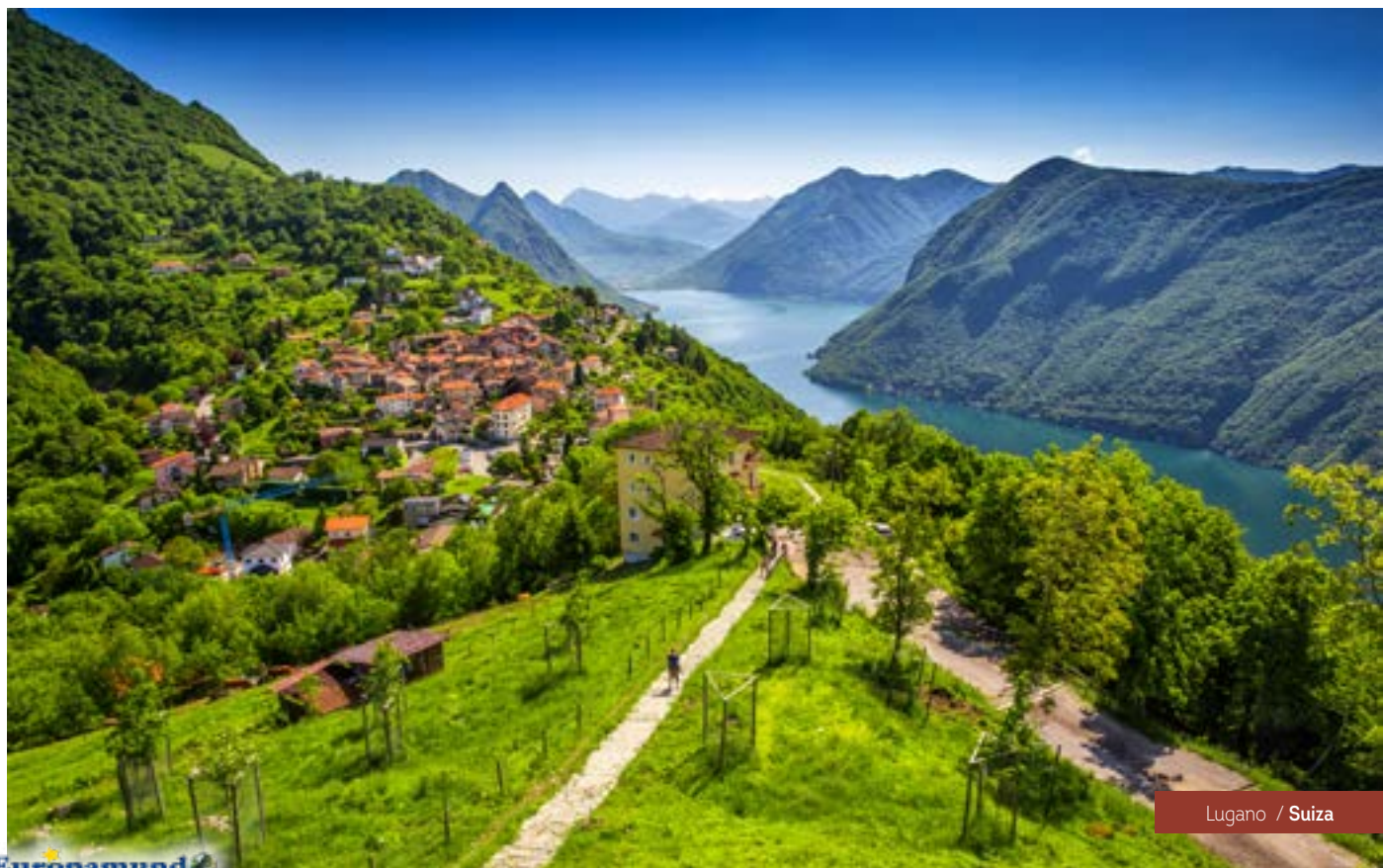
Lugano / Suiza

Etapa de paisajes extraordinarios de alta montaña. Subimos en teleférico a Reutte, en Alemania,