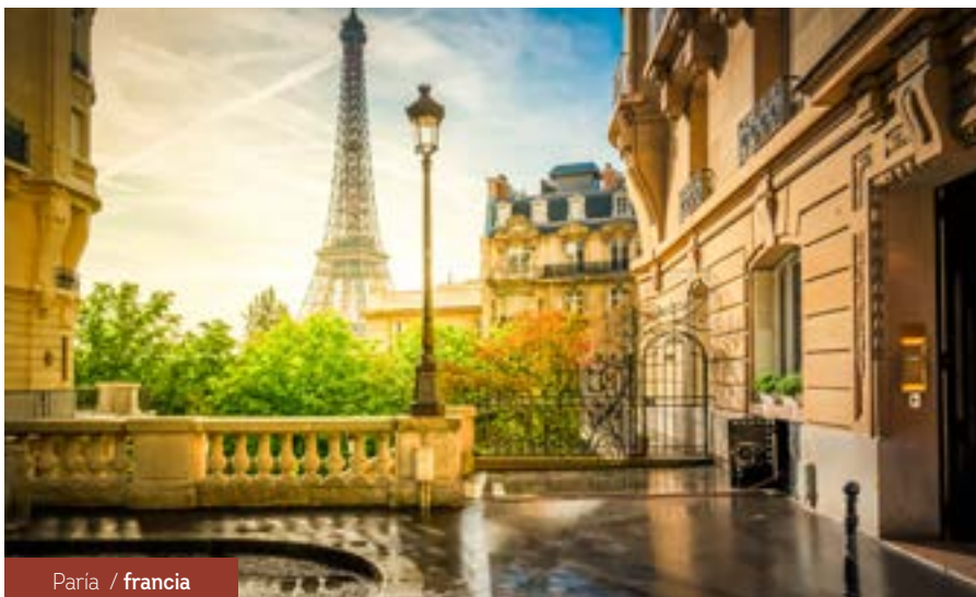
París / francia