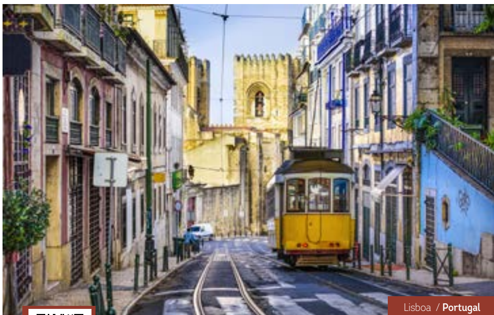
Lisboa / Portugal