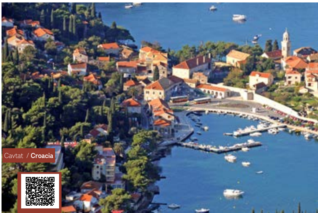
Cavtat / Croacia

Visita panorámica de Varsovia, capital de Polonia.