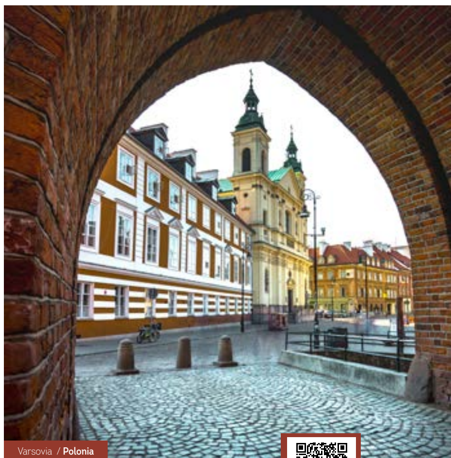
Varsovia / Polonia