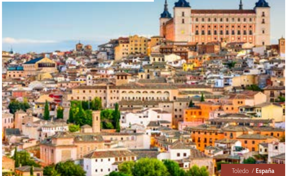
Toledo / España