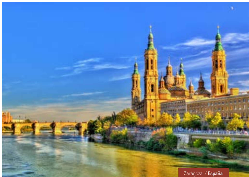
Zaragoza / España