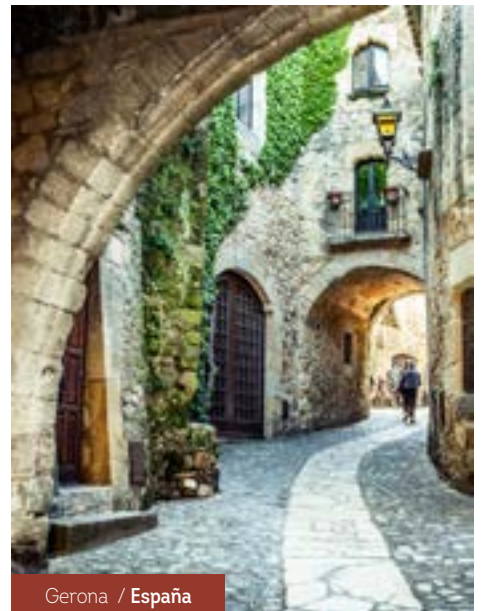
Gerona / España