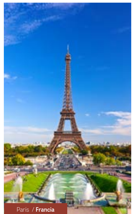
París / Francia