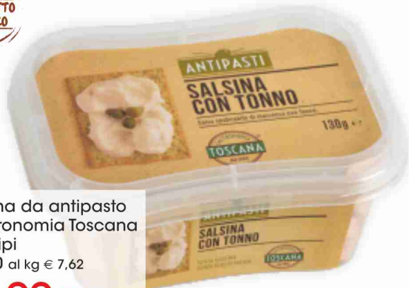
Salsina da antipasto Gastronomia Toscana vari tipi g 130 al kg € 7,62