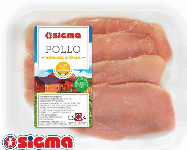
sigma Petto di pollo a fette