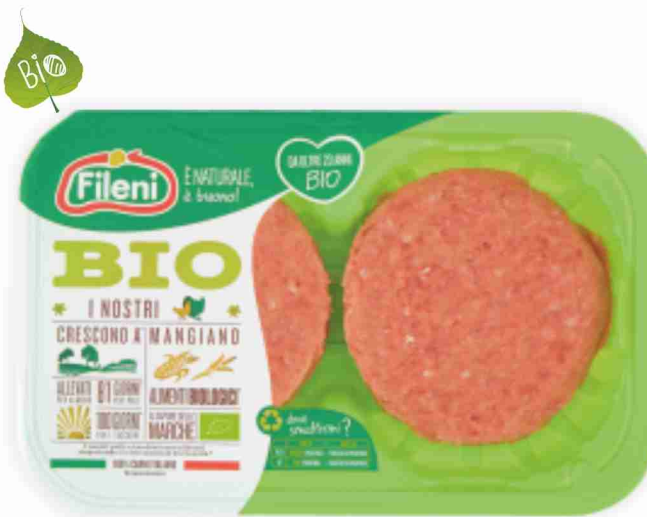
Hamburger di pollo BIO Fileni g 200 al kg € 14,45