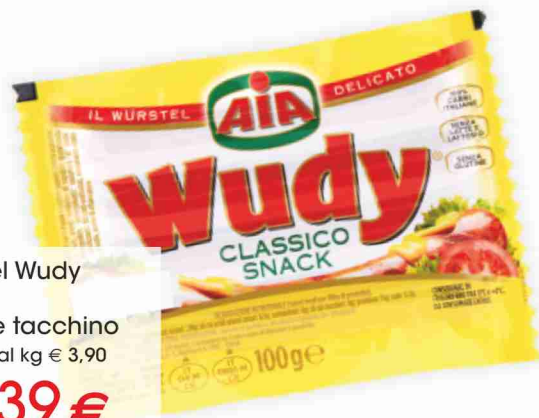
Würstel Wudy Aia pollo e tacchino g 100 al kg € 3,90