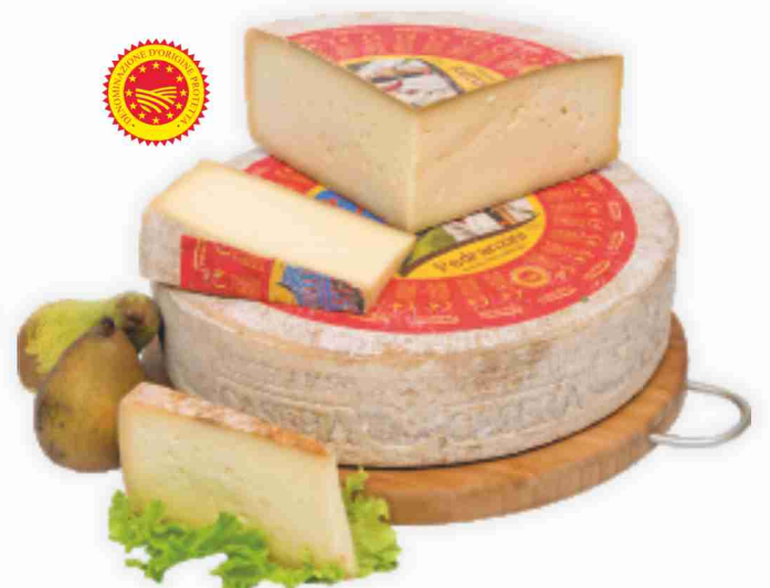
Casera D.O.P. Pedranzini al kg € 11,90