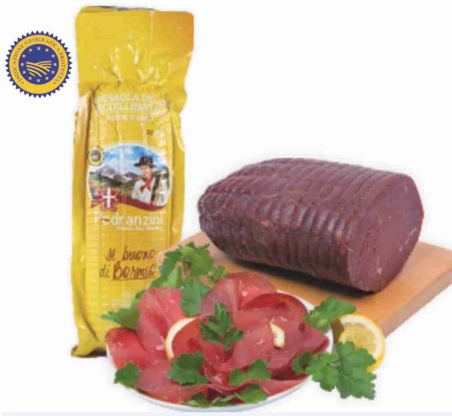
Bresaola della Valtellina I.G.P. Pedranzini al kg € 28,90