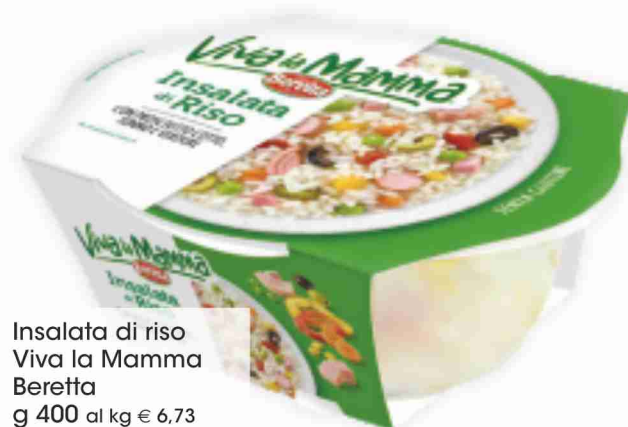
Insalata di riso Viva la Mamma Beretta g 400 al kg € 6,73