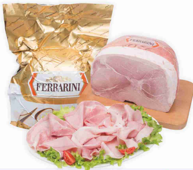
Prosciutto cotto 1956 Alta Qualità Ferrarini al kg € 15,90