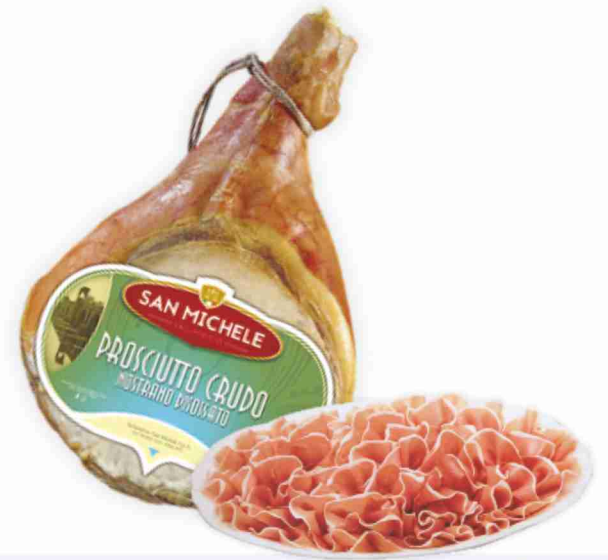
Prosciutto crudo nazionale San Michele al kg € 15,90