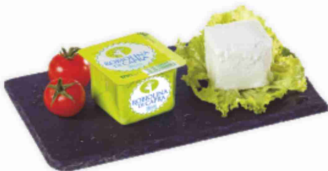
Robiola di capra 3B Latte al kg € 16,90