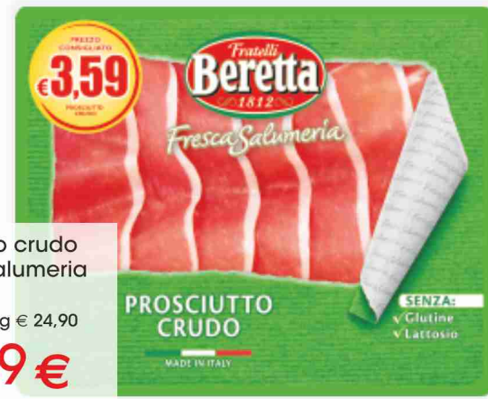
Prosciutto crudo Fresca Salumeria Beretta g 100 al kg € 24,90