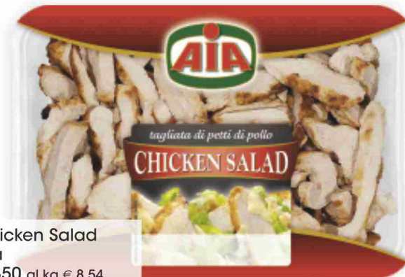
Chicken Salad Aia g 350 al kg € 8,54