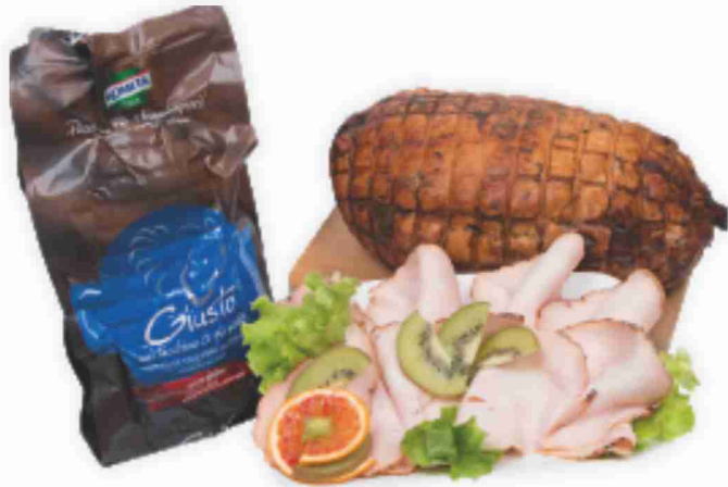
Petto di tacchino rustico Kometa al kg € 13,90