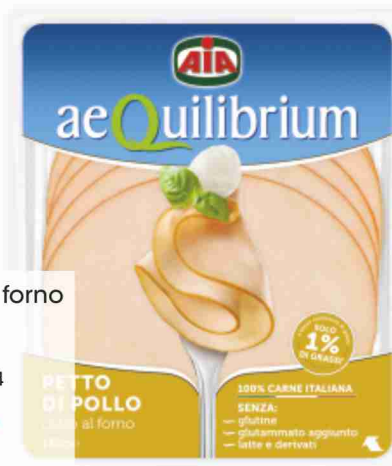
Petto di pollo al forno Aequilibrium Aia g 140 al kg € 10,64