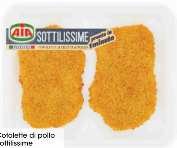
Cotolette di pollo Sottilissime Aia g 140 al kg € 7,07