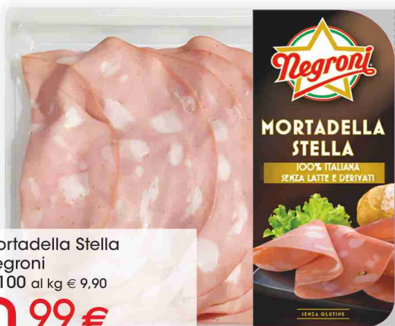
Mortadella Stella Negroni g 100 al kg € 9,90