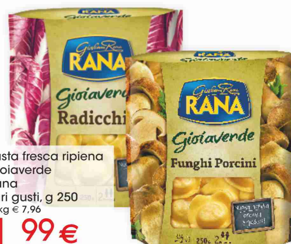
Pasta fresca ripiena Gioiaverde Rana vari gusti, g 250 al kg € 7,96