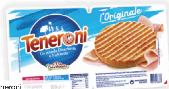
Teneroni Originali Casa Modena l'originale, mozzarella g 150 al kg € 12,60