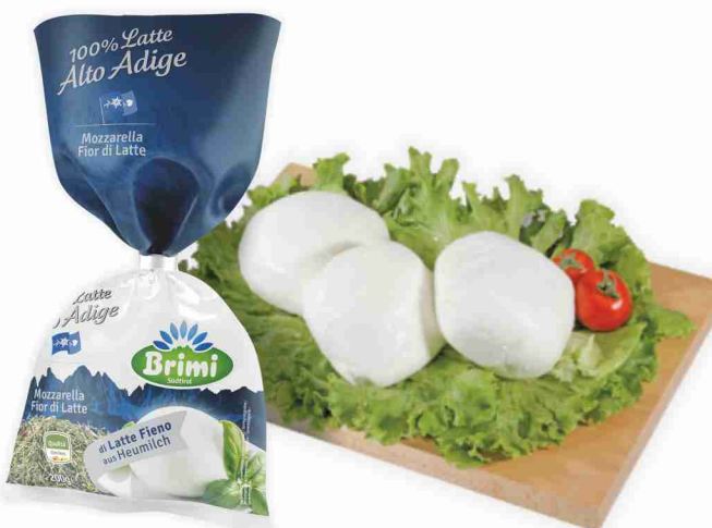
Mozzarella fior di latte Brimi g 200 al kg € 9,95