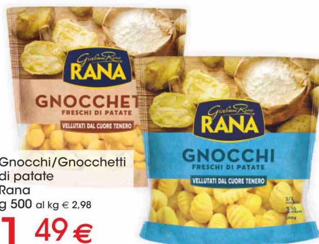
Gnocchi/Gnocchetti di patate Rana g 500 al kg € 2,98