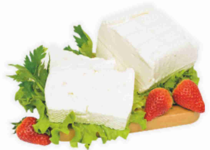
Primosale Osella al kg € 9,90