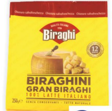
Biraghi Biraghi g 250