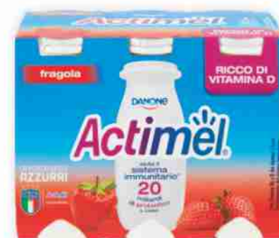
Actimel Danone vari gusti g 100x6