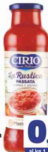
Passata La Rustica Cirio g 680