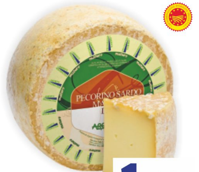
Pecorino Sardo maturo D.O.P. Argiolas al kg 16,90