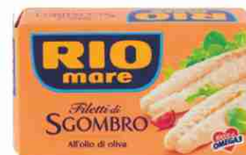
Filetti di sgombrò Rio Mare vari tipi g 125