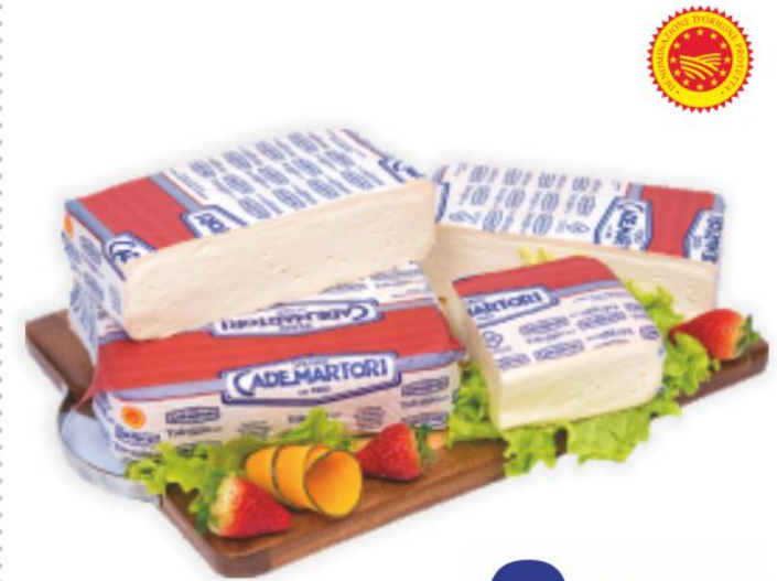
Taleggio D.O.P. Cademartori al kg 9,90