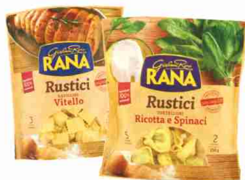
Pasta fresca ripiena Rustici Rana vari tipi g 250