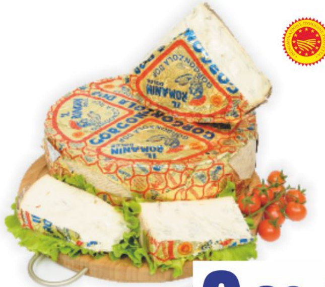
Gorgonzola dolce D.O.P. Il Romanin al kg 8,90