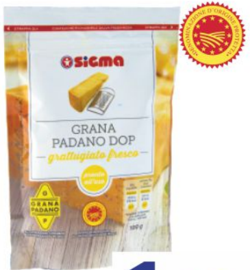
Grana Padano D.O.P. Sigma grattugiato g 100