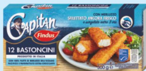
12 Bastoncini di merluzzo Findus g 300