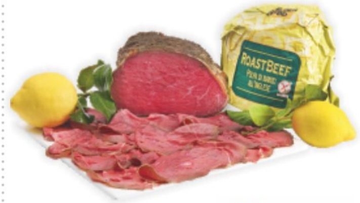
Roast beef all'inglese Goldenfood al kg 22,90