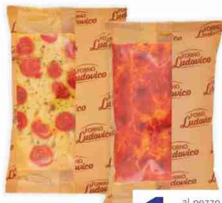
Focaccia Forno Ludovico vari tipi g da 170 a 135