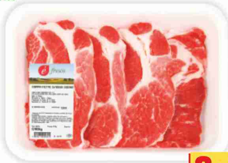
Coppa di suino a fette senza osso È Fresco