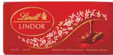
Tavoletta di cioccolato Lindor Lindt vari tipi g 100