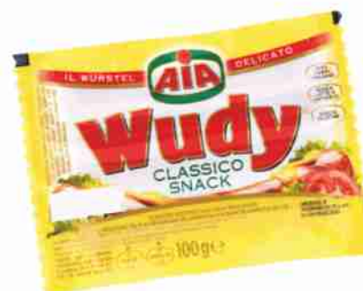
Würstel Wudy Aia classico snack g 100