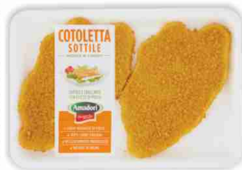
Cotoletta sottile Amadori g. 300