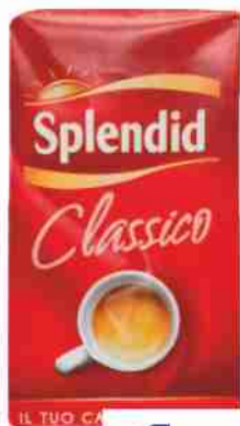
Caffè classico Splendid g 250