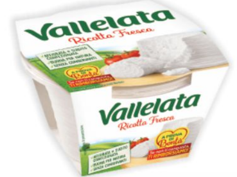
Ricotta fresca Vallelata g 250