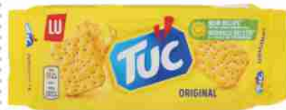
Tuc Original LU g 100