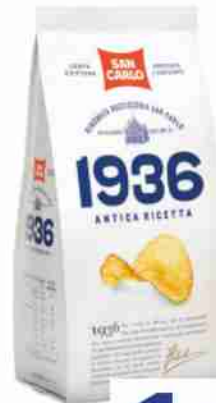
Patine 1936 San Carlo antica ricetta g 150