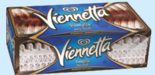
Viennetta Algida vaniglia g 360