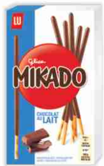
Mikado Lu cioccolato al latte, fondente