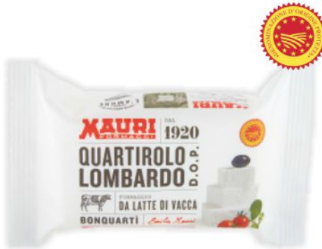
Quartirolo lombardo D.O.P. Mauri g 200