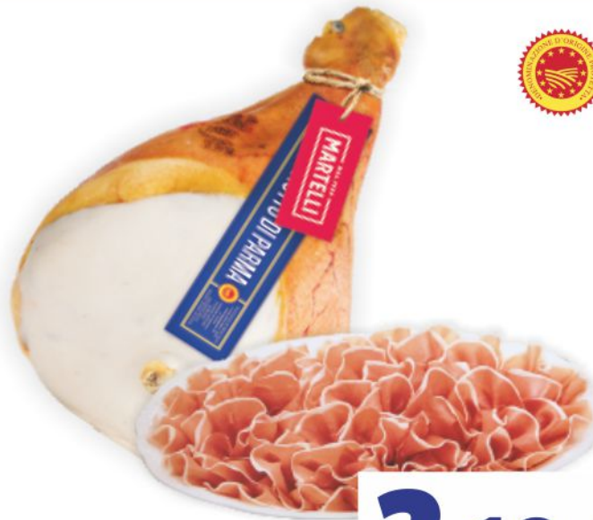
Prosciutto di Parma D.O.P. Martelli al kg 21,90