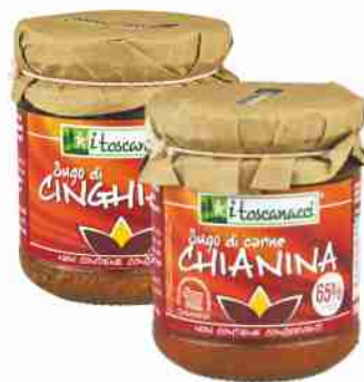
Sughi di carne I Toscanacci vari tipi g 180