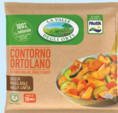
Contorno ortolano La Valle Degli Orti g 400