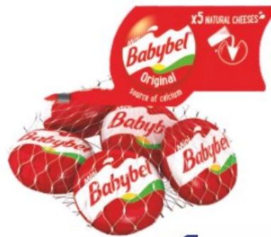
Mini Babybel g 100