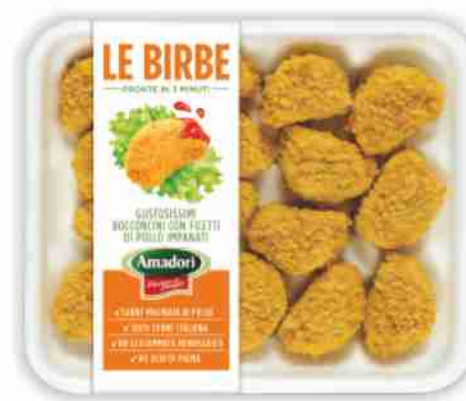
Birbe di pollo Amadori g. 300