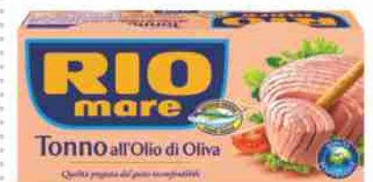
Tonno all'olio di oliva Rio Mare g 160x2