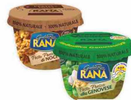
Sughi freschi Rana vari tipi g da 225 a 140