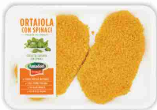
Ortaiola con spinaci Amadori g. 220