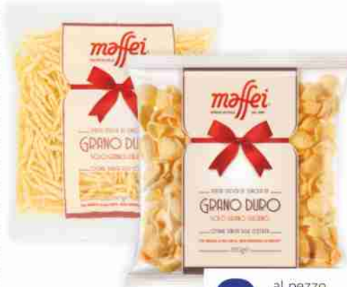
Pasta fresca Maffei vari formati g 250