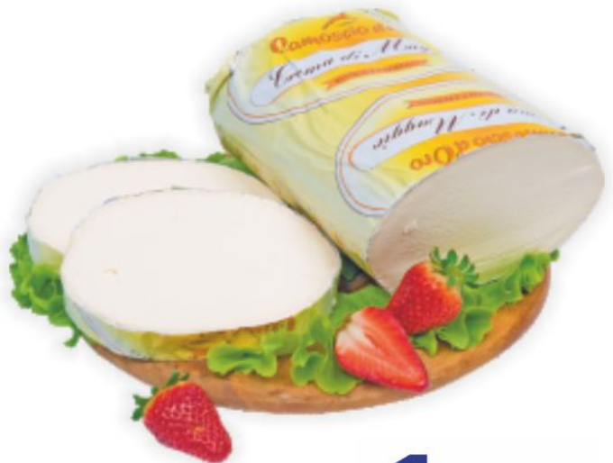
Crema di Maggio Camoscio D'oro al kg 12,90