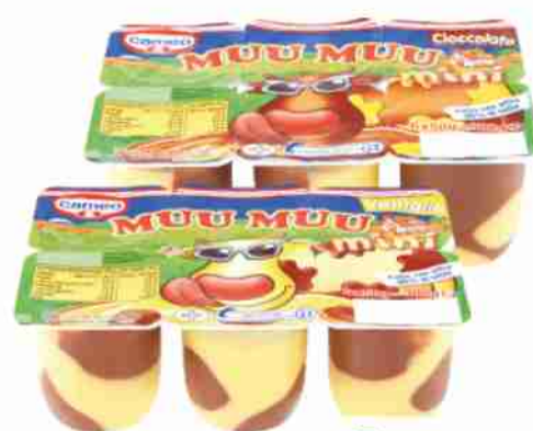
Dessert Muu Muu mini Cameo vaniglia, cioccolato g 50x6