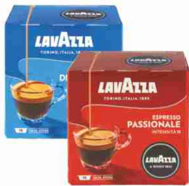
16 Capsule Espresso A Modo Mio Lavazza vari tipi g 120