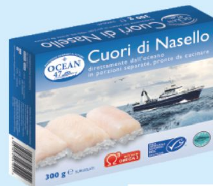
Cuori di nasello Ocean 47 g 300