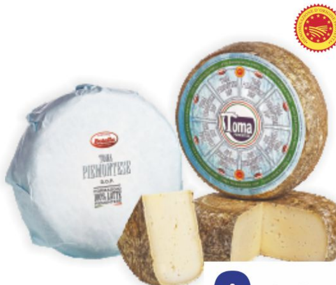
Toma Piemontese D.O.P. Botalla al kg 9,90