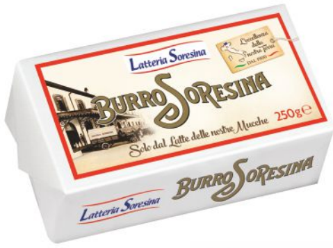
Burro Soresina g 250