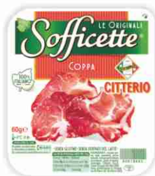
Coppa Sofficette Citterio g 60