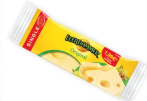
Leerdammer g 150