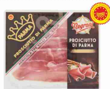
Prosciutto di Parma D.O.P. Negroni g 80