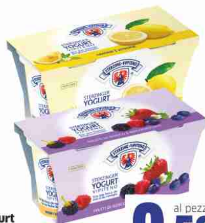
Yogurt Vipiteno vari gusti g 125x2