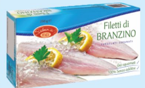
Filetti di pesce Salmon Club branzino, orata g 250