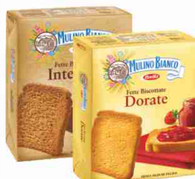
Fette Biscottate Mulino Bianco Dorate, Integrali g 315