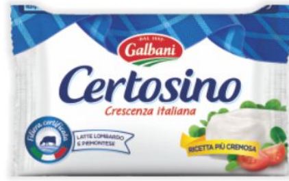
Certosino Galbani g 100