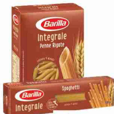
Pasta di semola integrale Barilla vari formati g 500