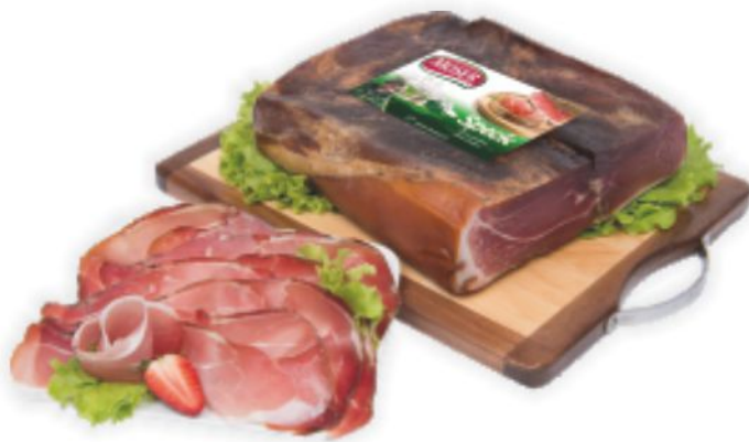
Speck Moser al kg 14,90