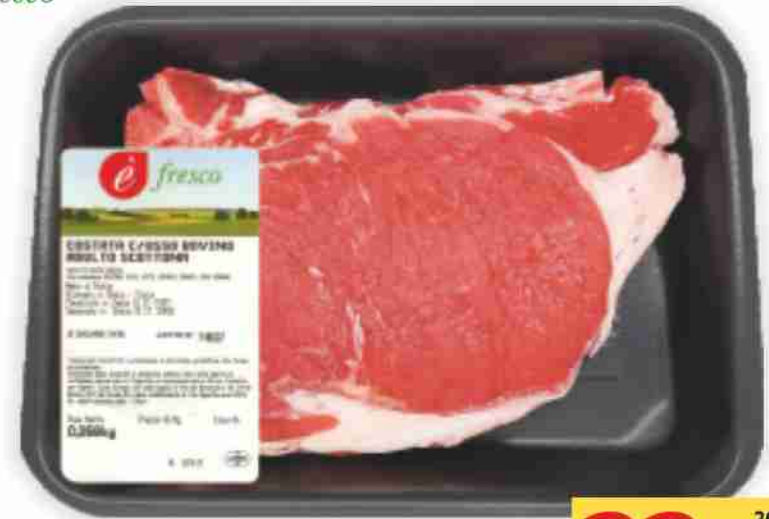
Costata di scottona È Fresco