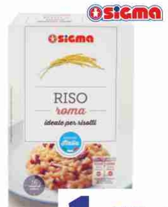
Riso Roma Kg 1