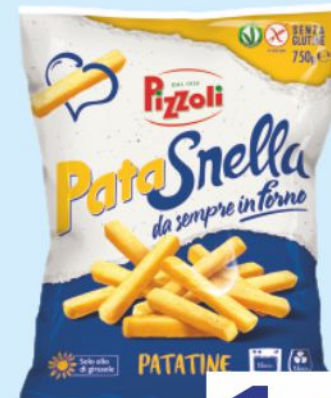
Patatine Patasnella Pizzoli g 750