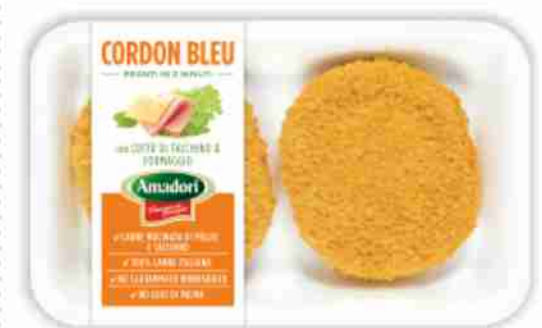
Cordon Bleu Amadori g. 250