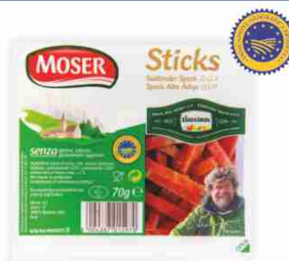
Sticks di speck Alto Adige I.G.P. Moser g 70