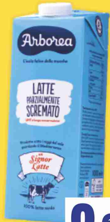
Latte UHT Arborea parz. scremato litri 1