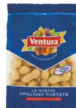
Arachidi Giant Israele Ventura g 400