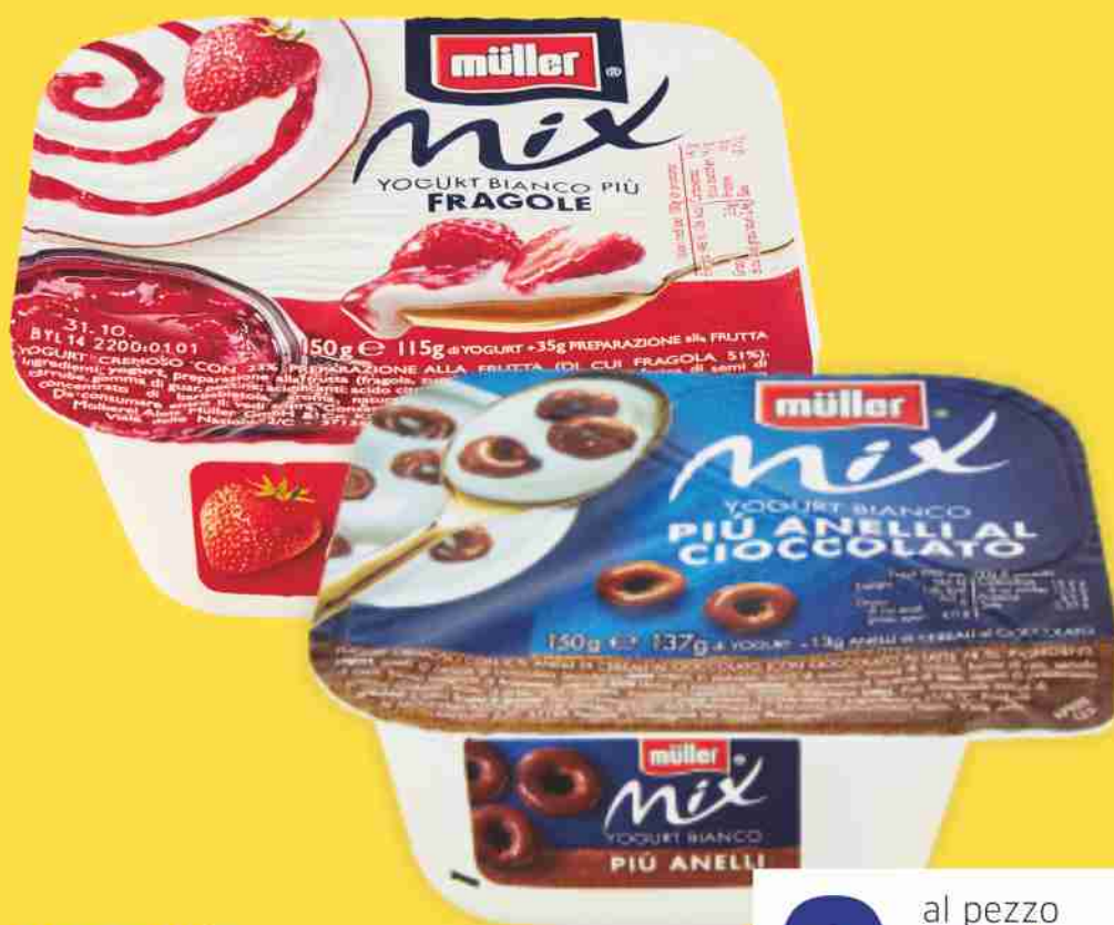
Yogurt Mix Müller vari gusti g 150/120