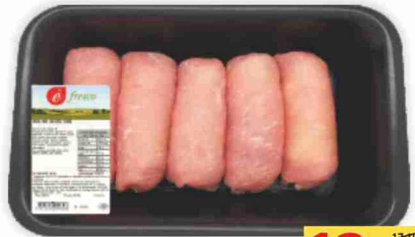
Involtino gustoso di suino È Fresco