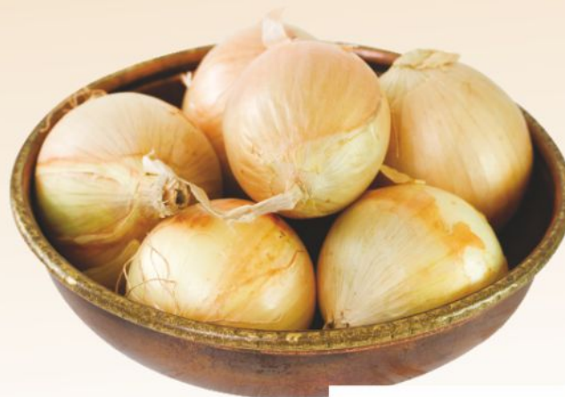
Cipolle ramate di Montoro g 500

Viene spesso usata nella preparazione di prelibatezze caratterizzate dalla lunga cottura, come il 'Ragù alla Genovese', eccellenza della cucina campana, ma, per apprezzarne l'essenza, può essere semplicemente preparata al forno con un filo d'olio ed un pizzico di pepe.