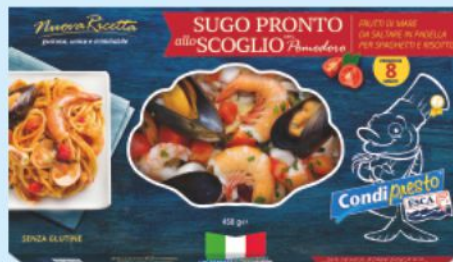
Sugo pronto allo scoglio Condi presto Esca g 450