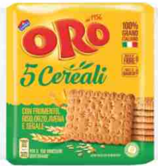
Biscotti Oro Saiwa vari tipi g 400