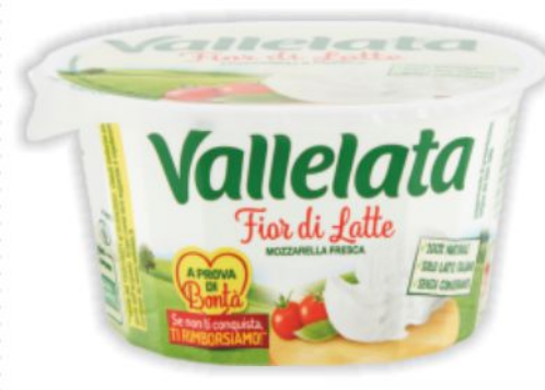
Mozzarella fresca Vallelata g 125