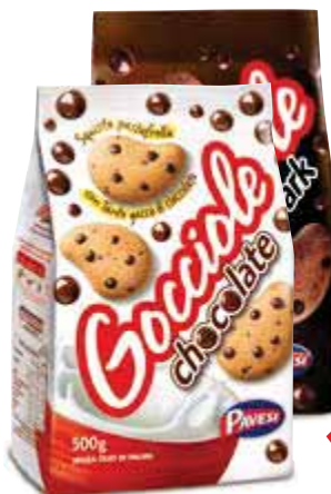
Goccioline PAVESI classiche 500 g € 3,38 al kg extra dark 400 g € 4,23 al kg