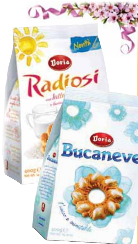
Bucaneve/Radiosi DORIA 400 g € 2,48 al kg