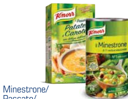
Minestrone/ Passato/ Vellutata/Zuppa KNORR