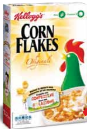
Corn Flakes KELLOGG'S 375 g € 4,51 al kg