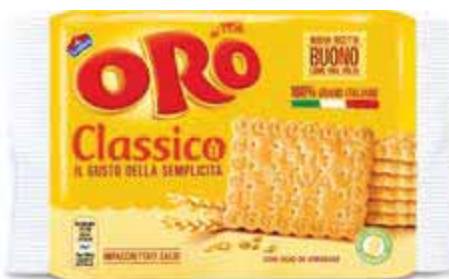
Oro SAIWA 250 g € 3,96 al kg