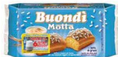
Buondi MOTTA classico - 6 pz/198 g € 6,52 al kg