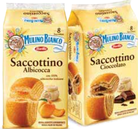
Saccottino MULINO BIANCO albicocca/ciocolato 8 pz/336 g € 5,63 al kg