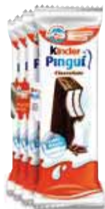
Kinder Pinguì FERRERO cacao/cocco - 4 pz/120 g € 12,42 al kg