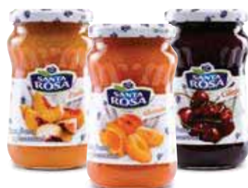
Classiche gusti assortiti - 350 g € 3,97 al kg