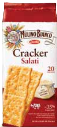
Cracker MULINO BIANCO salati/non salati/ integrali - 500 g € 2,98 al kg