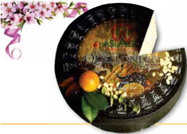
Asiago nero DOP TONIOLO CASEARIA

In offerta solo nei punti vendita con banco salumi e formaggi