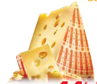
Emmentaler Switzerland DOP