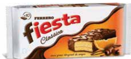
Fiesta FERRERO 360 g € 6,92 al kg