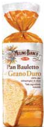
Panbauletto di grano duro MULINO BIANCO 400 g € 2,48 al kg