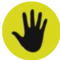
Die Schwarze Hand