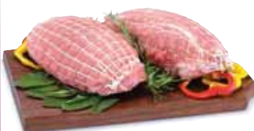
Arrosti di vitello