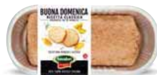
Buona Domenica classica