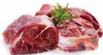
Polpa spalla di bovino adulto Scottona