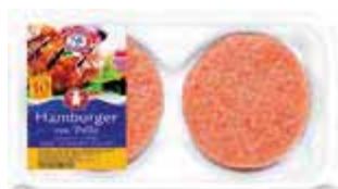
Hamburger di pollo