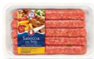
Salsicce di pollo