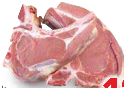
Braciolo di vitello