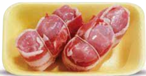
Fagottini di coniglio ripieno LA BUONA TAVOLA