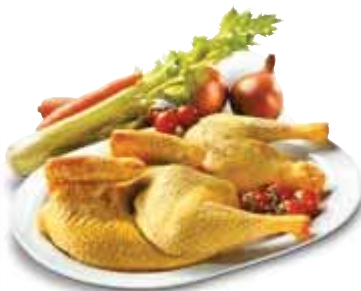
Cappone a metà/quarti