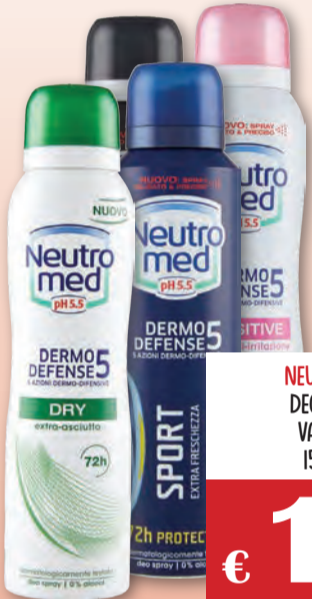
NEUTROMED DEO SPRAY VARI TIPI 150 ML