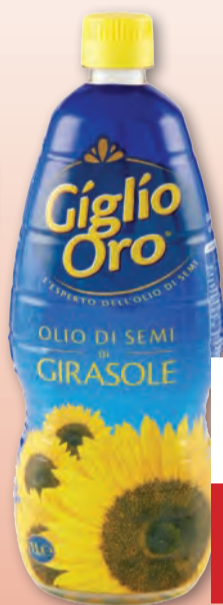
GIGLIO ORO OLIO DI SEMI DI GIRASOLE 1 LT