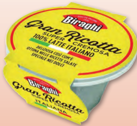
BIRAGHI GRAN RICOTTA SUPER CREMOSA 230 GR