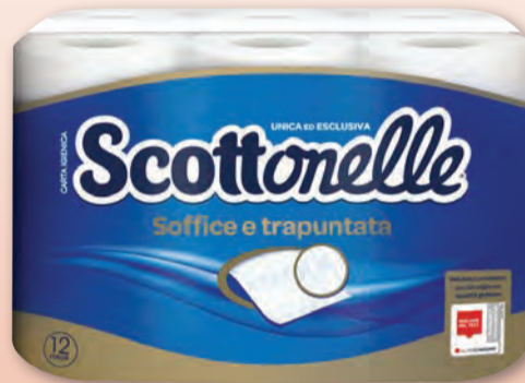
SCOTTONELLE CARTA IGIENICA 12 ROTOLI