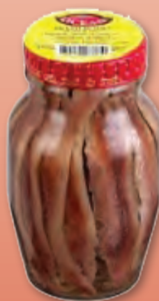
OCEAN FILETTI DI ALICI OLIO DI SEMI VASO 160 GR