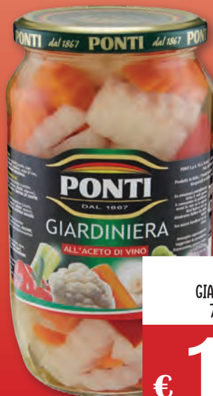
PONTI GIARDINIERA 700 GR