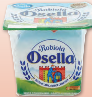
KRAFT ROBIOLA OSELLA 100 GR