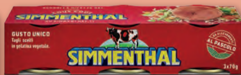
SIMMENTHAL CARNE 70 GR X 3