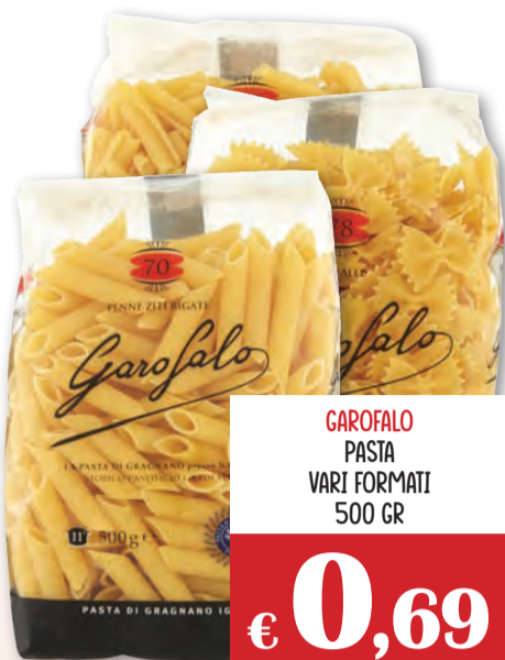
GAROFALO PASTA VARI FORMATI 500 GR