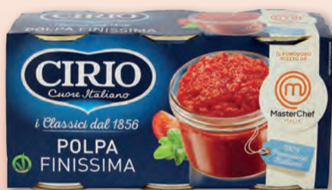
CIRIO POLPA FINISSIMA LATTI. 400 GR X 3