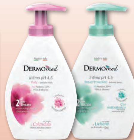
DERMOMED DETERG. INTIMO CALENDULA/ANTIBATT. 300 ML