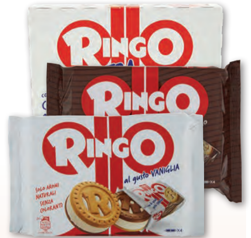
SAMMONTANA GELATO RINGO CACAO/VANIGLIA/EXTRA X4