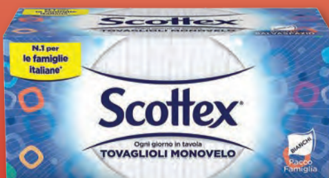
SCOTTEX TOVAGLIOLI F.TO FAMIGLIA X240