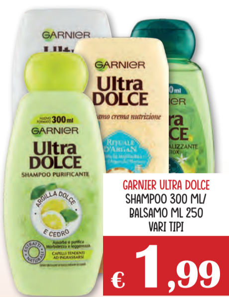
GARNIER ULTRA DOLCE SHAMPOO 300 ML/ BALSAMO ML 250 VARI TIPI