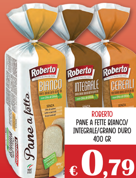
ROBERTO PANE A FETTE BIANCO/ INTEGRALE/GRANO DURO 400 GR