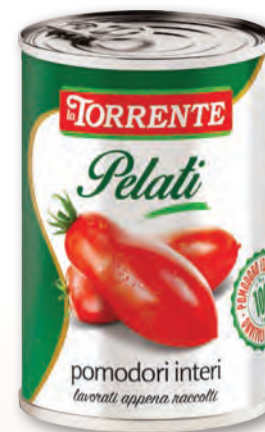
LA TORRENTE POMODORI PELATI LATTI. 400 GR