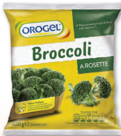
OROGEL BROCCOLI ROSETTE 400 GR