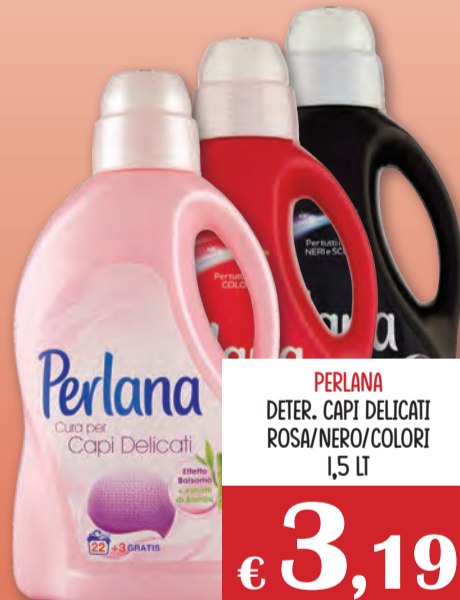
PERLANA DETER. CAPI DELICATI ROSA/NERO/COLORI 1,5 LT