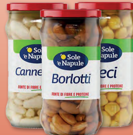
O'SOLE 'E NAPULE FAGIOLI CANNELLINI/ BORLOTTI/CECI LESSATI 295 GR