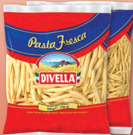
DIVELLA PASTA FRESCA VARI FORMATI 500 GR