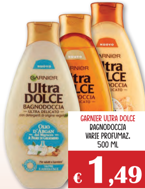
GARNIER ULTRA DOLCE BAGNODOCCIA VARI PROFUMAZ. 500 ML