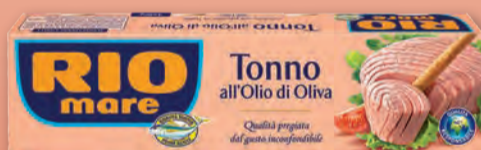
RIO MARE TONNO ALL'OLIO DI OLIVA 80 GR X 4