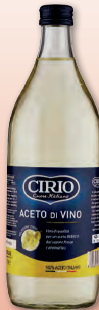
CIRIO ACETO DI VINO BIANCO 1 LT