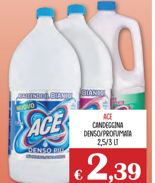
ACE CANDEGGINA DENSO/PROFUMATA 2,5/3 LT