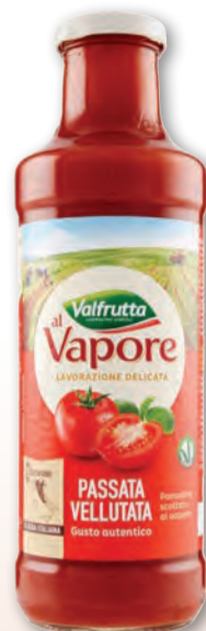
VALFRUTTA PASSATA VELLUTATA AL VAPORE 700 ML