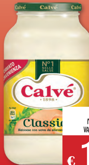
CALVÉ MAIONESE VASO 880 ML