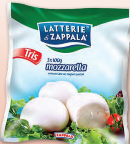
ZAPPALA' BOCCONCINI TRIS 100 GR X3