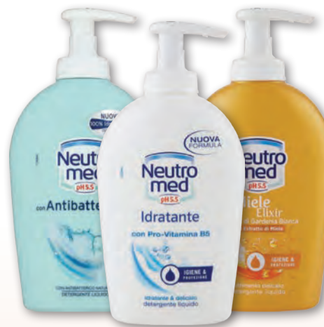
NEUTROMED SAPONE LIQUIDO VARI PROFUMAZ. 300 ML