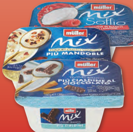
MULLER YOGURT MIX VARI GUSTI 150 GR