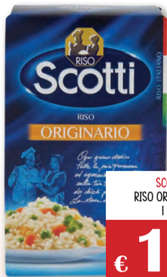
SCOTTI RISO ORIGINARIO 1 KG