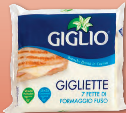
GIGLIO GIGLIETTE 175 GR