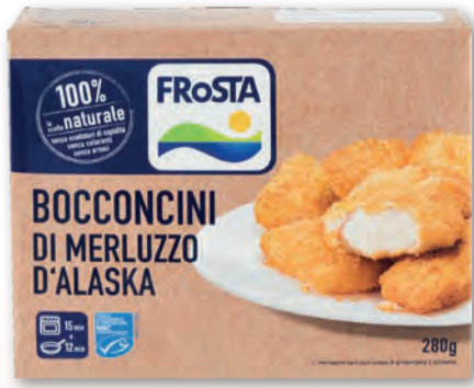
FROSTA BOCCONCINI DI MERLUZZO D'ALASKA 280 GR