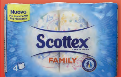
SCOTTEX CARTA CASA FAMILY 4 ROTOLI

I Prezzi sono validi fino alla fine dell'offerta, salvo eventuali aumenti d'imposta, errori tipografici e fino ad esaurimento scorte. Le foto sono rappresentative. Al fine di evitare acquisti che possano snaturare l'attività di vendita al dettaglio, volta essenzialmente al consumatore finale, si informa che non saranno vendute a singoli clienti quantità di merce vistosamente eccedenti il bisogno familiare.