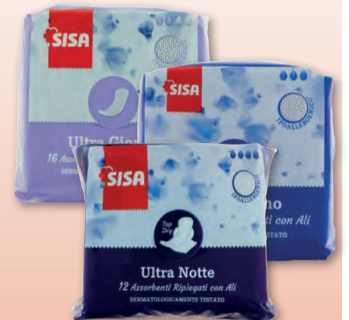
SISA ASSORBENTI ULTRA VARI TIPI 12/14/16 PZ