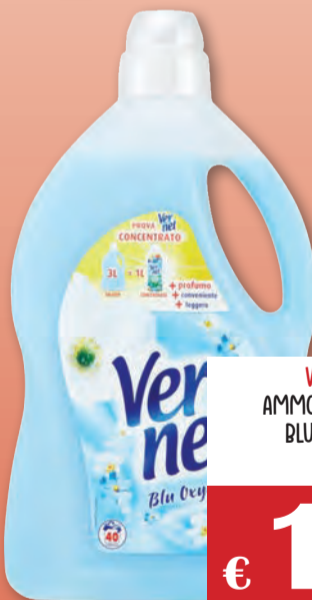
VERNEL AMMORBINDENTE BLU OXYGEN 3 LT