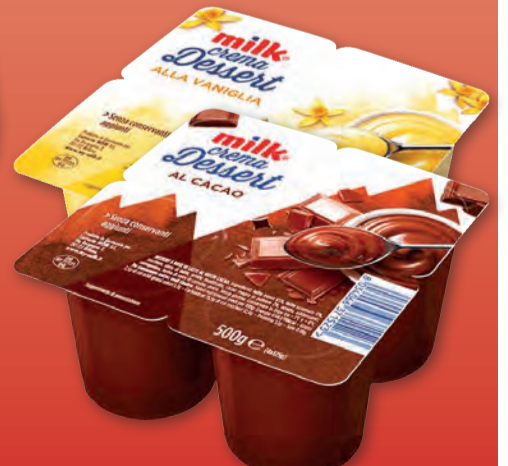
MILK DESSERT CREMA AL CACAO/VANIGLIA 125 GR X 4