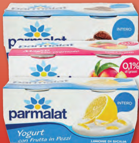
PARMALAT VELLUTATO/MAGRO VARI GUSTI 125 GR X2