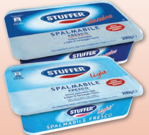
STUFFER FORMAGGIO SPALMABILE FRESCO/LIGHT 200 GR