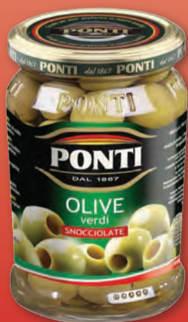
PONTI OLIVE VERDI DENOCCIOLATE VETRO 290 GR