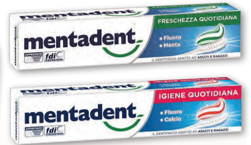
MENTADENT DENTIFRICIO PROTEZIONE FAMIGLIA WHITE/FRESH 100 ML