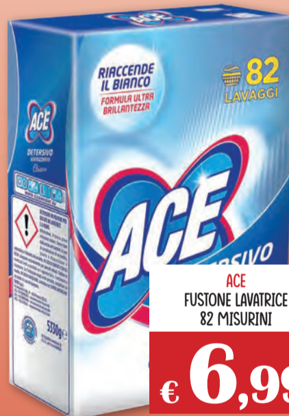
ACE FUSTONE LAVATRICE 82 MISURINI