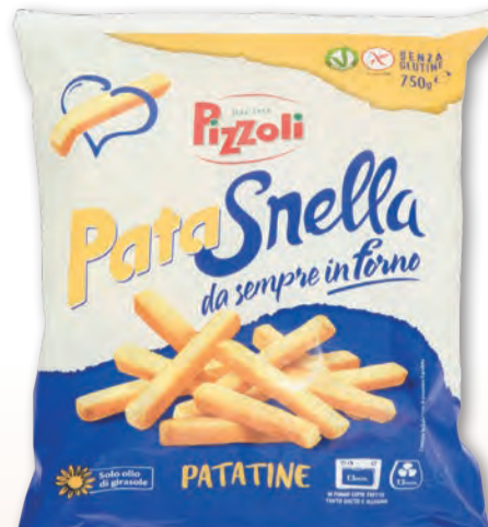
PIZZOLI PATASNELLA PATATE STICK 750 GR