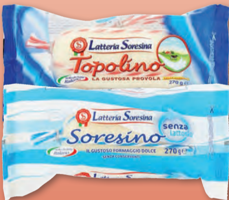
SORESINA PROVOLA TOPOLINO CLASSICA/S. LATTOSIO 270 GR