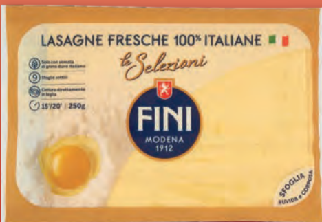
FINI LASAGNE SFOLGIA 250 GR