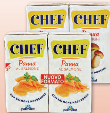
PARMALAT CHEF PANNA UHT SALMONE/FUNGHI 125 ML X 2