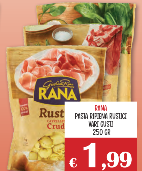
RANA PASTA RIPIENA RUSTICI VARI GUSTI 250 GR