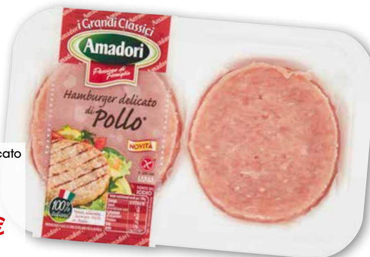
Hamburger delicato di pollo Amadori g 204 al kg € 7,30