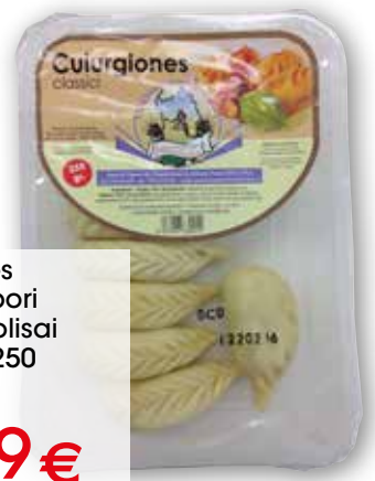
Culurgiones Antichi Sapori del Mandrolisai classici, g 250 al kg € 8,76