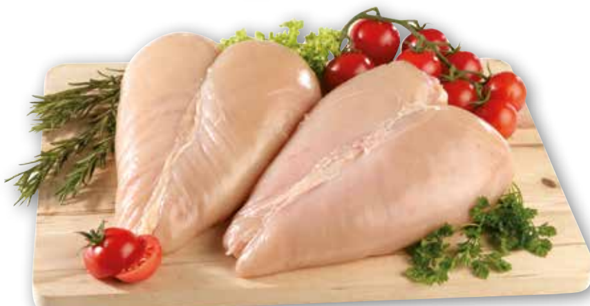
Petto di pollo intero Sigma