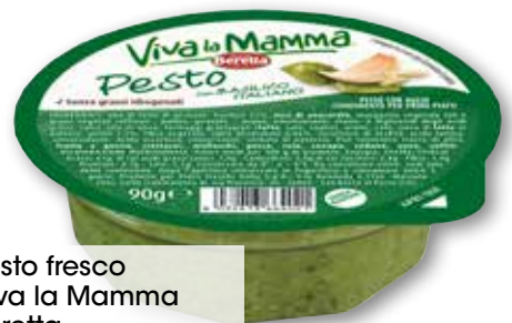
Pesto fresco Viva la Mamma Beretta classico, senz'aglio g 90 al kg € 9,89