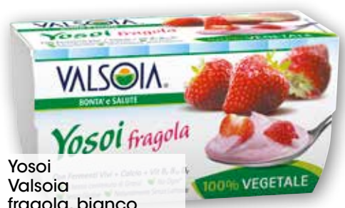
Yosoï Valsoia fragola, bianco cremoso, ciliegia g 125x2 al kg € 3,96