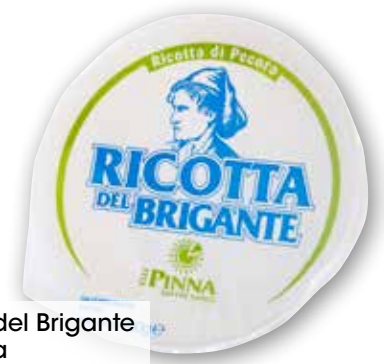
Ricotta del Brigante F.Ili Pinna g 250 al kg € 4,76