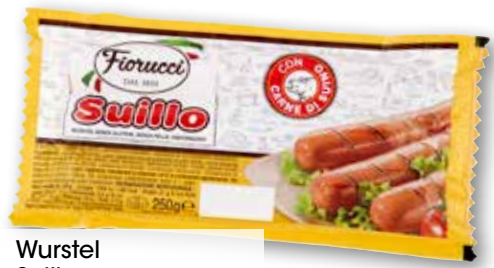
Wurstel Suillo g 250 al kg € 3,96