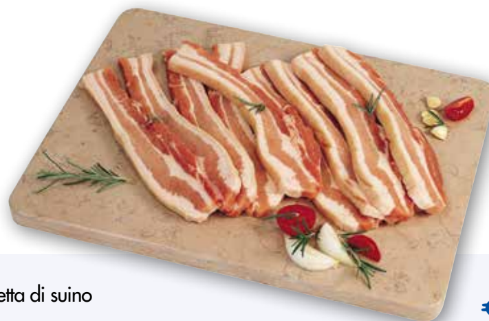
Pancetta di suino