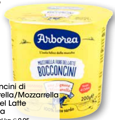
Bocconcini di mozzarella/Mozzarella Fiore del Latte Arborea g 200 al kg € 9,95