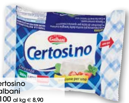
Certosino Galbani g 100 al kg € 8,90