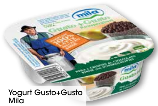
Yogurt Gusto+Gusto Mila vari gusti, g 150 al kg € 3,27