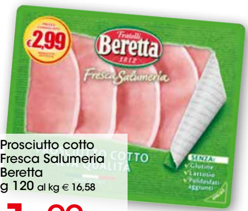
Prosciutto cotto Fresca Salumeria Beretta g 120 al kg € 16,58