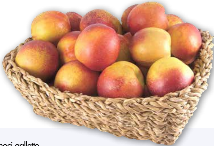
Pesche noci gallette