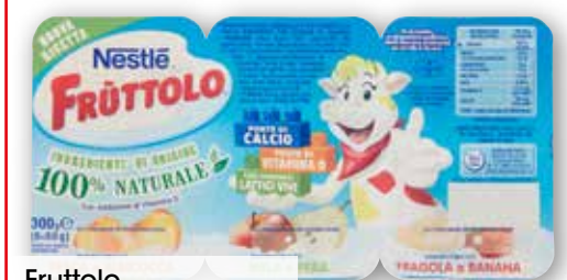
Fruttolo Nestlé gusti assortiti g 300 al kg € 4,63