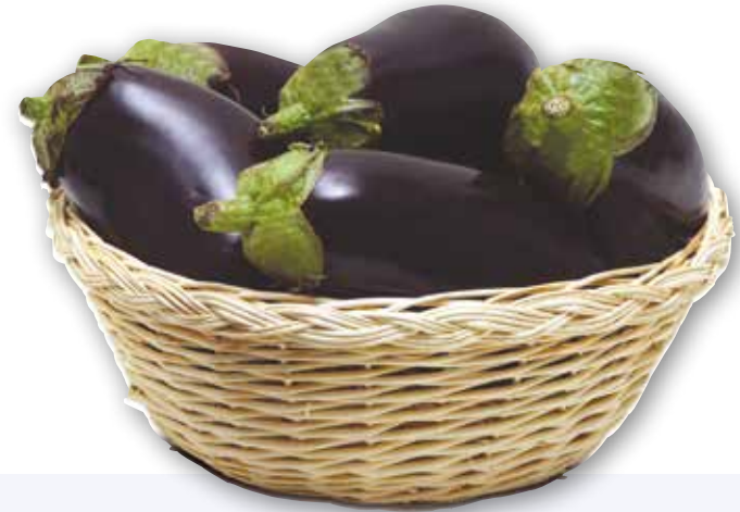
Melanzane nere tonde