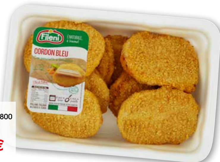
Cordon Bleu conf. famiglia, g 800 al kg € 3,74