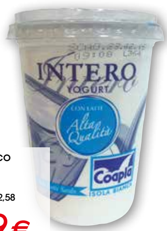
Yogurt bianco Coopla intero g 500 al kg € 2,58