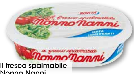
Il fresco spalmabile Nonno Nanni g 150 al kg € 7,93