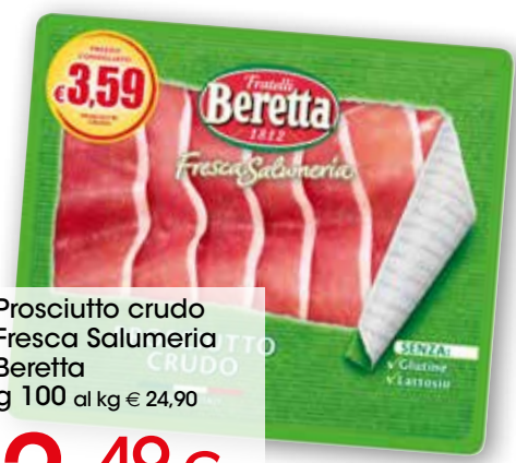
Prosciutto crudo Fresca Salumeria Beretta g 100 al kg € 24,90