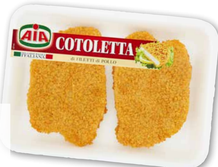
Cotoletta di pollo Aia g 230 al kg € 8,65