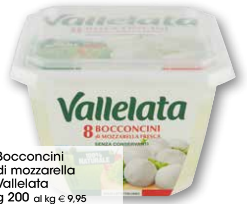
Bocconcini di mozzarella Vallelata g 200 al kg € 9,95