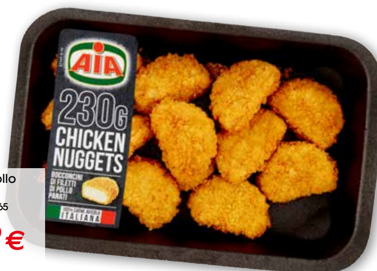
Nagghy di pollo Aia g 230 al kg € 8,65