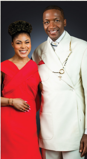
ഉണ്ടായിരിക്കും - നിങ്ങളുടെ കുട്ടികൾക്ക് എന്തൊരു ഉപദേശമാണ്!