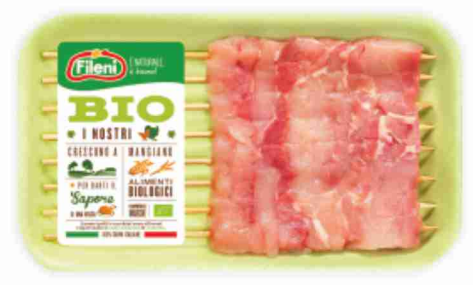
Arrosticini di pollo BIO g 170 al kg \in 17,59