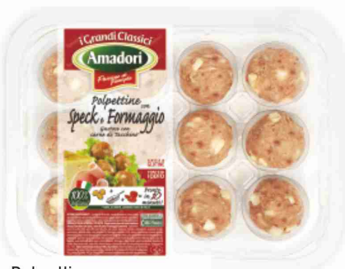
Polpettine con speck e formaggio Amadori g~240~\text{al}~\text{kg} \in 9{,}54