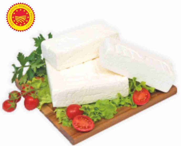
Quartirolo Lombardo D.O.P. Cademartori al kg € 10,90