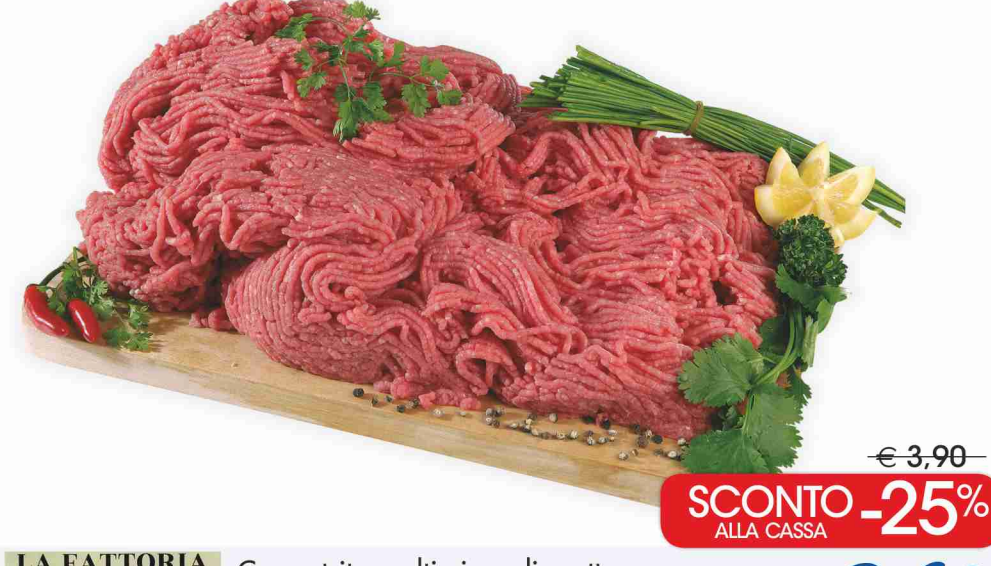
Carne trita sceltissima di scottona confezione g 300 al kg € 9,73

Lonza di suino a fette nazionale in confezione