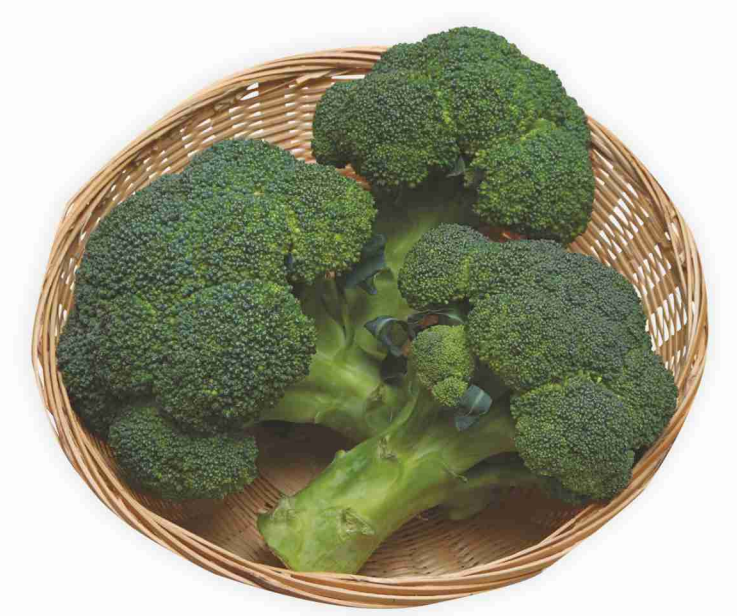
Broccoletti g 500 al kg € 2,38