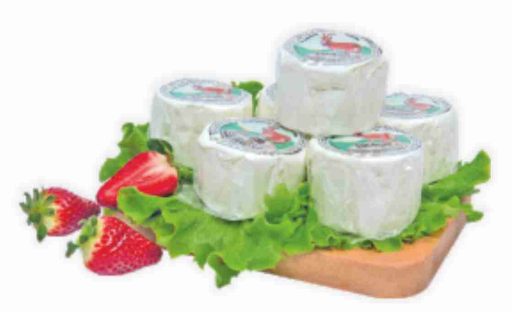
Caprino di pura capra Caseificio dell'Alta Langa