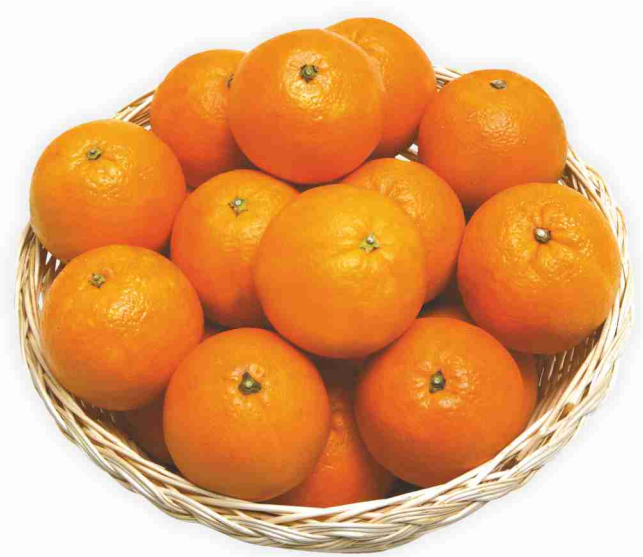
Arance rete kg 1 al kg € 1,59