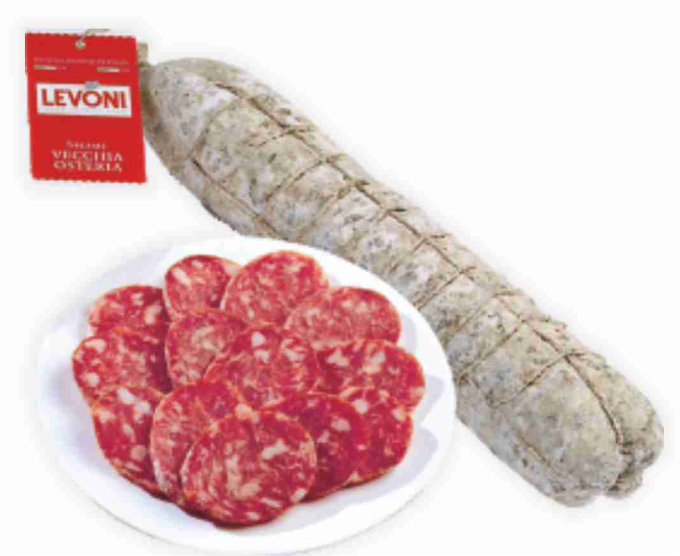
Salame Mantovano Vecchia Osteria al kg € 21,90