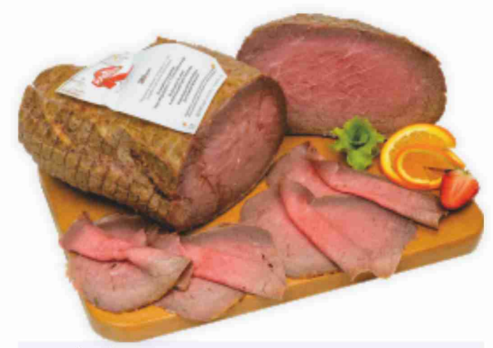
Roastbeef Raspini al kg € 20,90