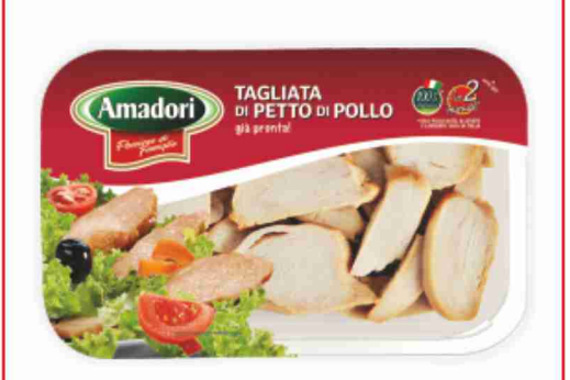
Tagliata di pollo Amadori g 280 al kg € 9,96