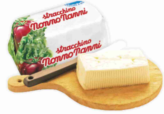
Stracchino Nonno Nanni al kg € 11,90