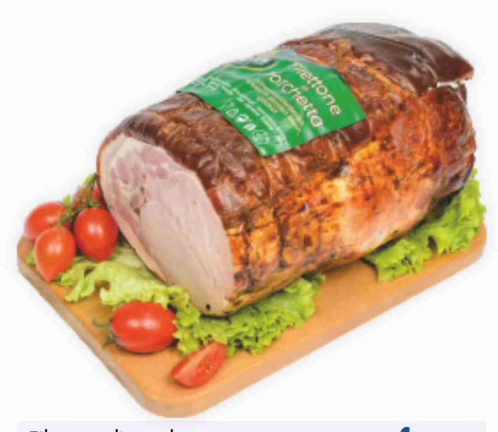
Filettone di porchetta Senfter al kg € 14,90