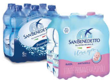
0,90 SAN BENEDETTO ACQUA NATURALE/ FRIZZANTE 50 CL X 6