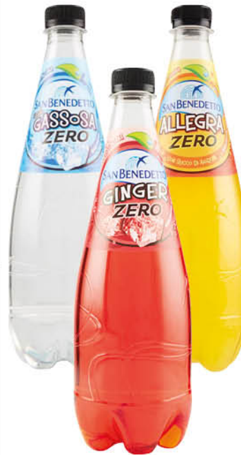
0,45 SAN BENEDETTO ZERO LIMONE/ GASSOSA/GINGER/ ARANCIATA - 75 CL