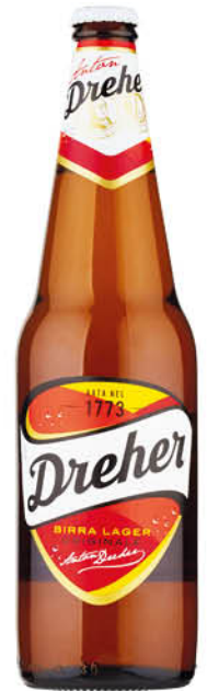
0,79 DREHER BIRRA 66 CL