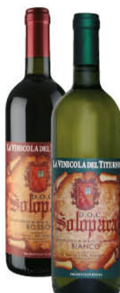
TITERNO VINO SOLOPACA DOC BIANCO/ROSSO 75 CL