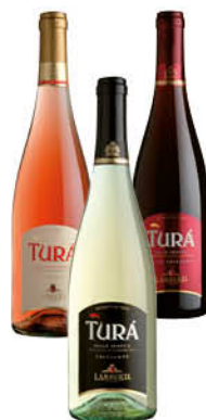
TURÀ VINO FRIZZANTE BIANCO/ ROSA/ROSSO 75 CL