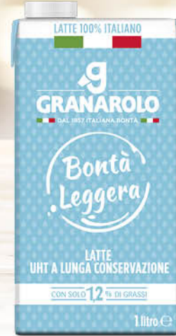
GRANAROLO BONTÀ LEGGERA LATTE UHT 100% ITALIANO 1 LITRO