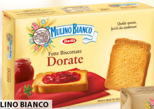
MULINO BIANCO FETTE BISCOTTATE DORATE X 72 - 630 GR