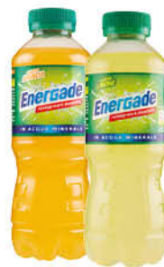
0,59 ENERGADE VARI GUSTI 50 CL