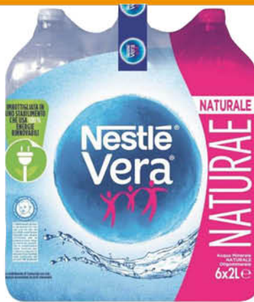
VERA ACQUA NATURALE 2 LITRI X 6