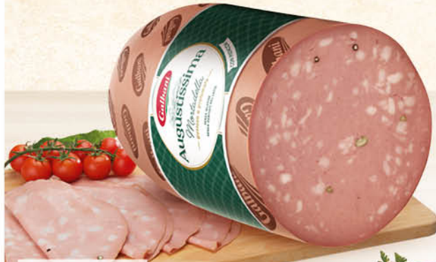
GALBANI AUGUSTISSIMA MORTADELLA L'ETTO