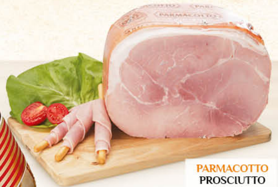
PARMACOTTO PROSCIUTTO COTTO ALTA QUALITÀ L'ETTO