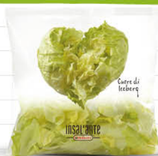
ORTOROMI CUORI DI ICEBERG G. 200 - AL PEZZO