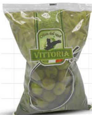
VITTORIA OLIVE VERDI SICILIA O BUSTA G. 500