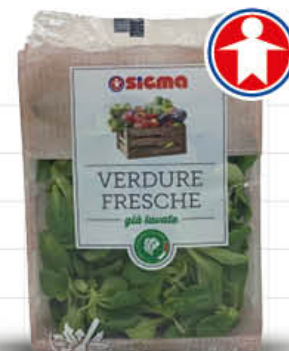
SIGMA VALERIANA G. 80 - AL PEZZO