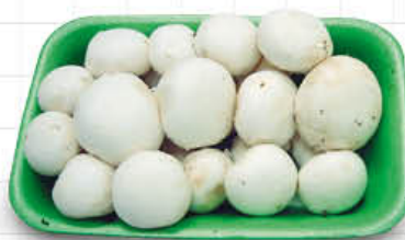
FUNGHI CHAMPIGNON MEDI - G. 300 AL PEZZO