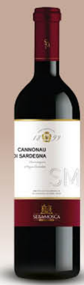
SELLA & MOSCA VINO CANNONAU DI SARDEGNA DOC CL. 75