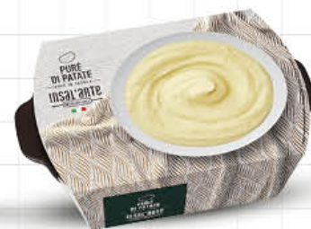
ORTOROMI PURE DI PATATE G. 400 - AL PEZZO