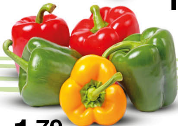
PEPERONI CAT. 1 - AL KG.