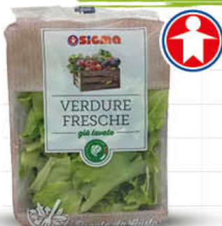
SIGMA LATTUGHINO G. 100 - AL PEZZO