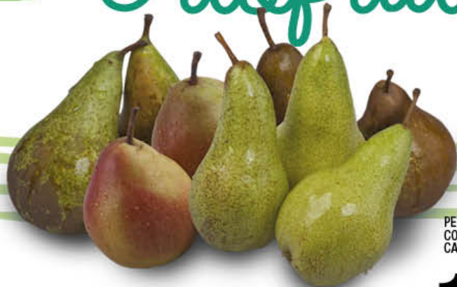
PERE CONFERENCE CAT. 1 - AL KG.

Riscopri i sapori e i profumi della terra direttamente sulla tua tavola. Lasciati sorprendere dalla nostra selezione di ortaggi, frutta e verdura di prima scelta. Prodotti coltivati nel rispetto della natura e del cliente. Grazie al nostro assortimento riscoprirai la genuinità e la naturalezza del BIO.