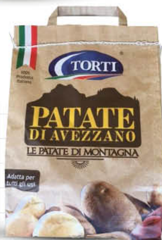
TORTI PATATE AVEZZANO SACCO DI CARTA KG. 1,5 - AL PEZZO