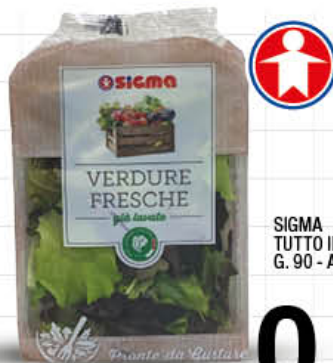
SIGMA TUTTO INSIEME G. 90 - AL PEZZO