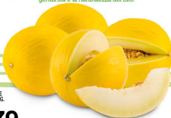
MELONI GIALLI CAT. 1 - AL KG.