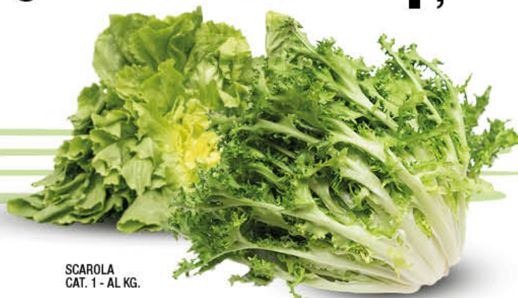
SCAROLA CAT. 1 - AL KG.