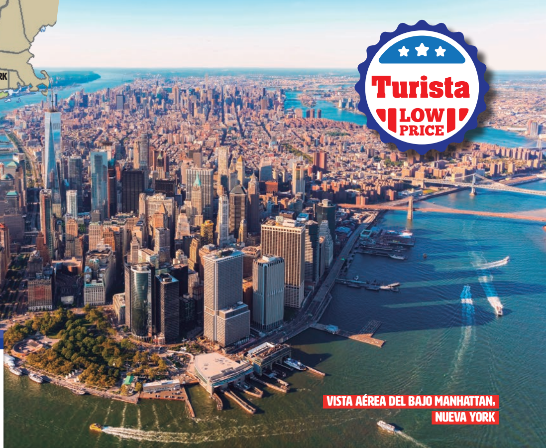
VISTA AÉREA DEL BAJO MANHATTAN, NUEVA YORK