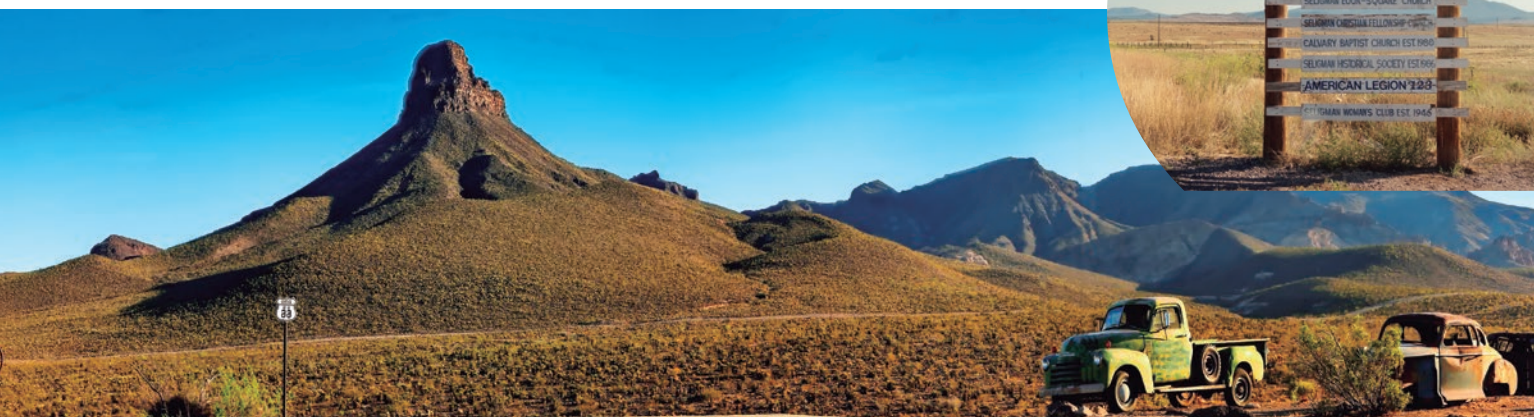
ROUTE 66 IN ARIZONA . SELIGMAN