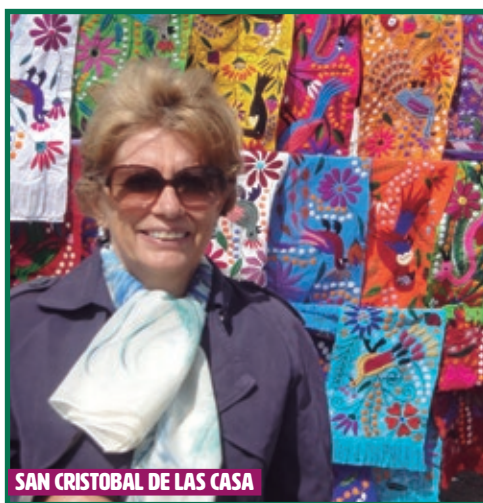
SAN CRISTOBAL DE LAS CASA

07 JUE. San Cristobal- Ocosingo- Agua Azul- Misol Ha- Palenque.- Etapa de hermosos paisajes de montaña en el interior de Chiapas , zonas habitadas por comunidades que han mantenido su lengua y tradiciones de origen Maya. Una parada en OCOSINGO , la capital regional. Tras ello seguimos a AGUA AZUL , entrada incluida al Parque Nacional, almuerzo incluido y tiempo para caminar o bañarse entre las más de 50 cascadas de