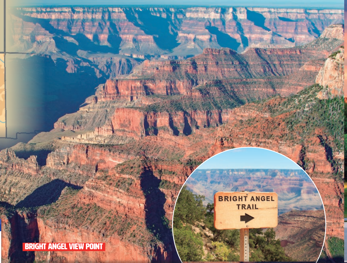
BRIGHT ANGEL VIEW POINT