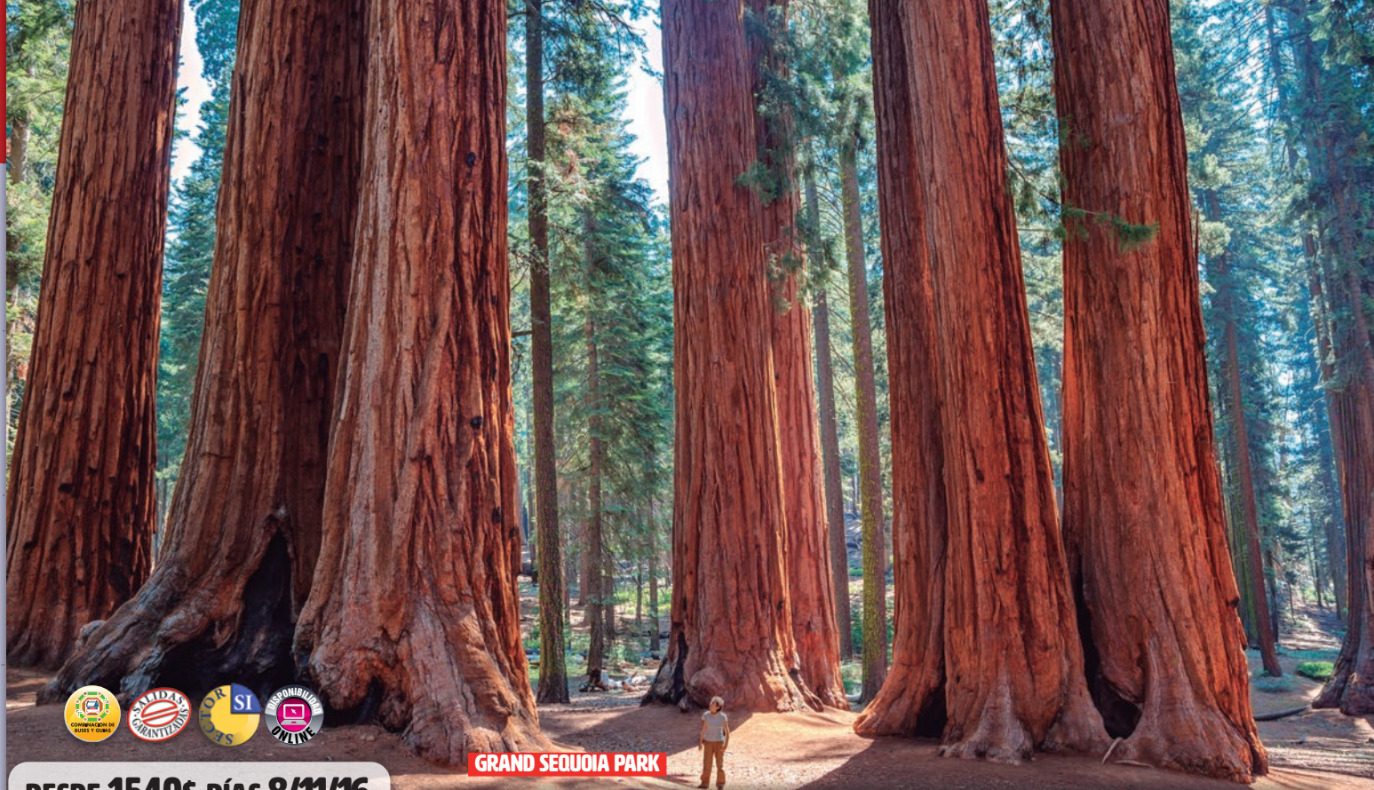
GRAND SEQUOIA PARK