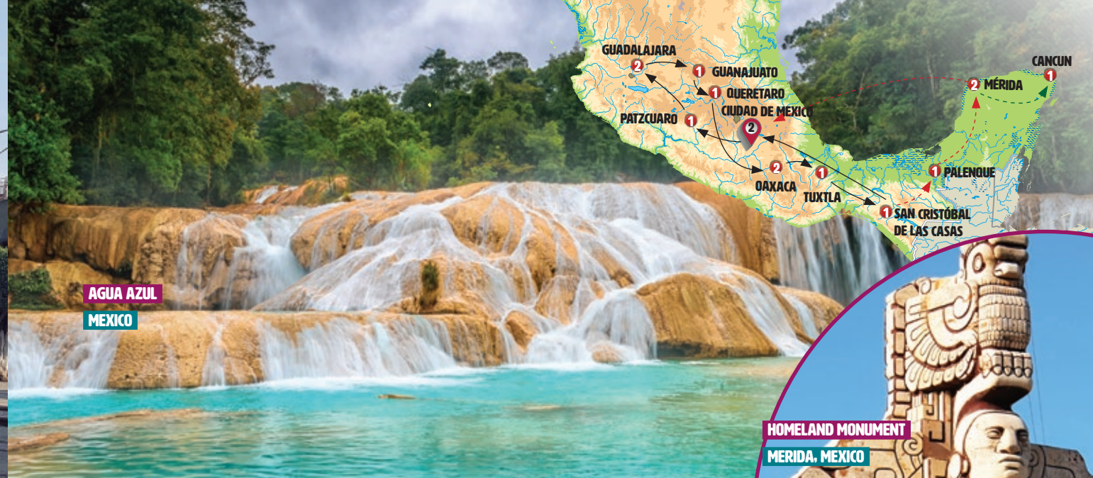
AGUA AZUL MEXICO

conocemos el Santuario de ATOTONILCO , conocido como "Santuario de Dios y la Patria", patrimonio de la Humanidad (en ocasiones no podremos visitar su interior por los retiros que se realizan). Posteriormente llegamos a QUERETARO , con su bellísimo centro colonial, su plaza de armas y sus animados restaurantes y calles peatonales.