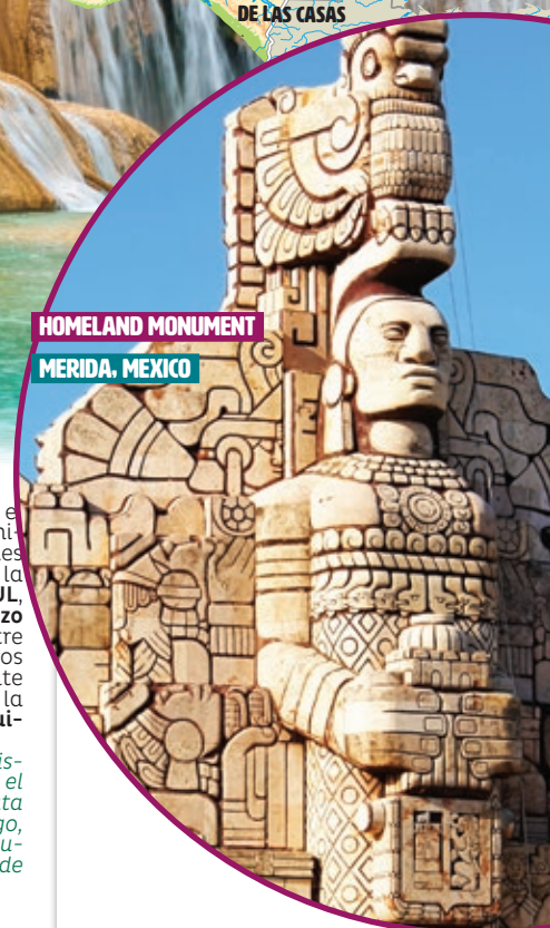
HOMELAND MONUMENT MÉRIDA, MEXICO