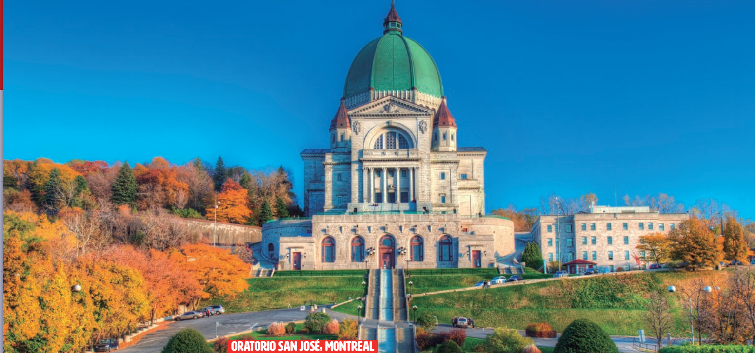
ORATORIO SAN JOSÉ, MONTREAL