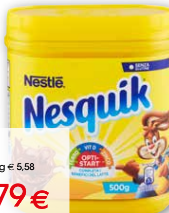
Nesquik Nestlé g 500 al kg € 5,58