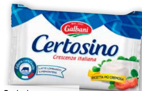
Certosino Galbani g 100 al kg € 9,90