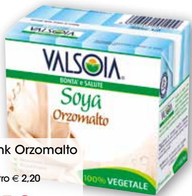
Soyadrink Orzomalto Valsolia Cl 50 al litro € 2,20