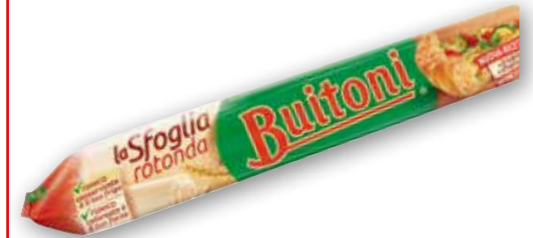
Pasta la Sfoglia rotonda Buitoni g 230 al kg € 5,61