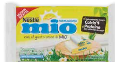
Formaggino Mio Nestlé g 125 al kg € 9,52