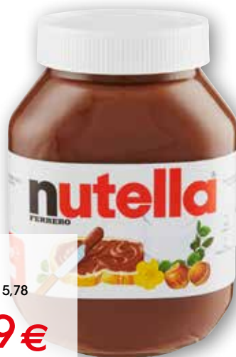
Nutella Ferrero g 950 al kg € 5,78