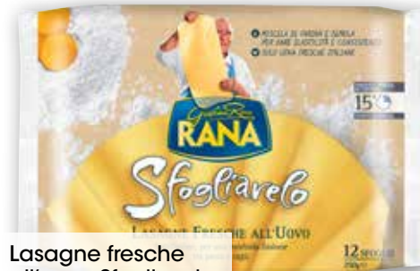
Lasagne fresche all'uovo Sfoigliavelo Rana g 250 al kg € 5,96