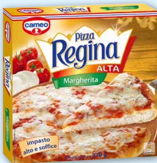
Pizza Regina alta Cameo margherita, g 370 al kg € 5,38