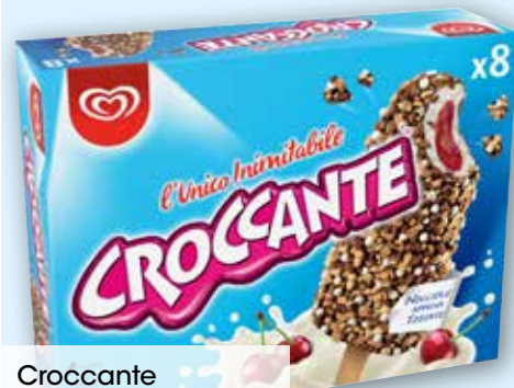
Croccante Algida g 456 al kg € 8,75