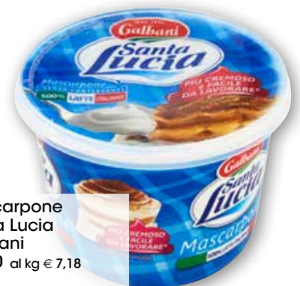
Mascarpone Santa Lucia Galbani g 500 al kg € 7,18