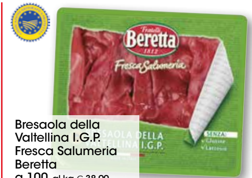
Bresaola della Valtellina I.G.P. Fresca Salumeria Beretta g 100 al kg € 38,90