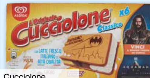
Cucciolone Algidia g 480 al kg € 6,02