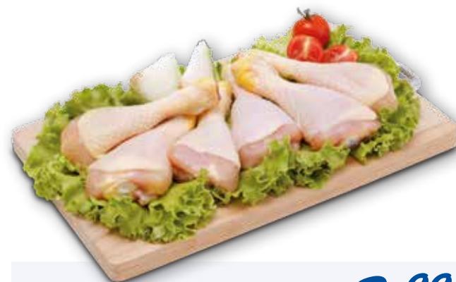
Fusi di pollo