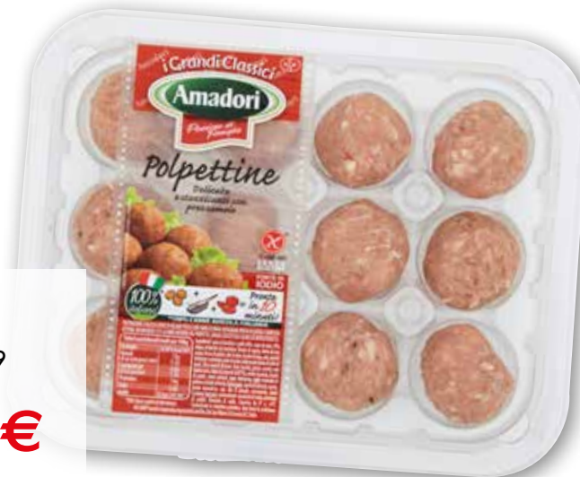
Polpettine Amadori g 240 al kg € 8,29