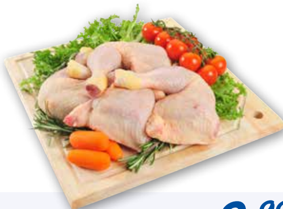
Cosciotto di pollo