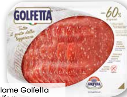
Salame Golfetta Golferra g 100 al kg € 24,90