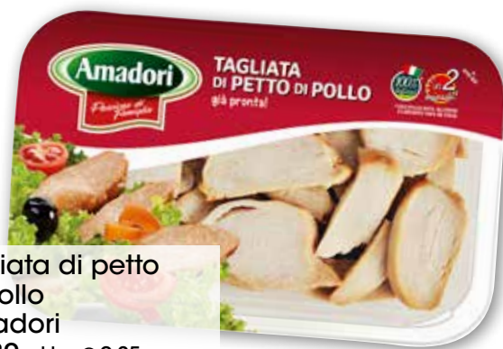
Tagliata di petto di pollo Amadori g 280 al kg € 9,25