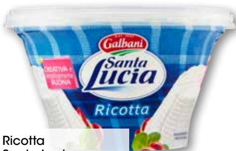
Ricotta Santa Lucia Galbani g 250 al kg € 3,96