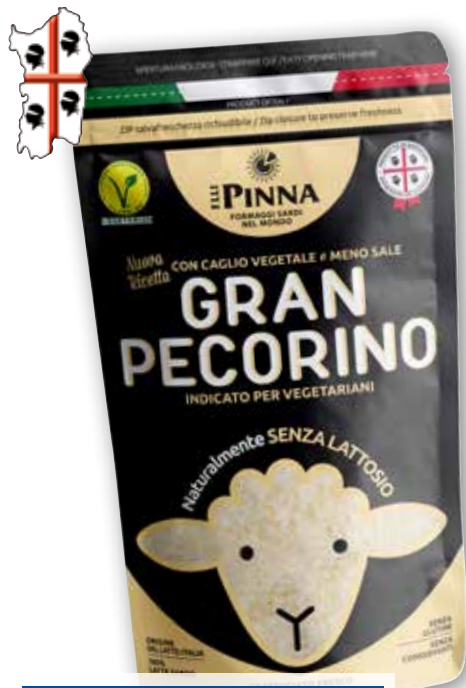
Granpecorino grattugiato F.lli Pinna g 100 al kg € 12,90