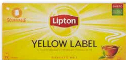
Tè Yellow label Lipton 25 filtri, g 37 al kg € 26,76