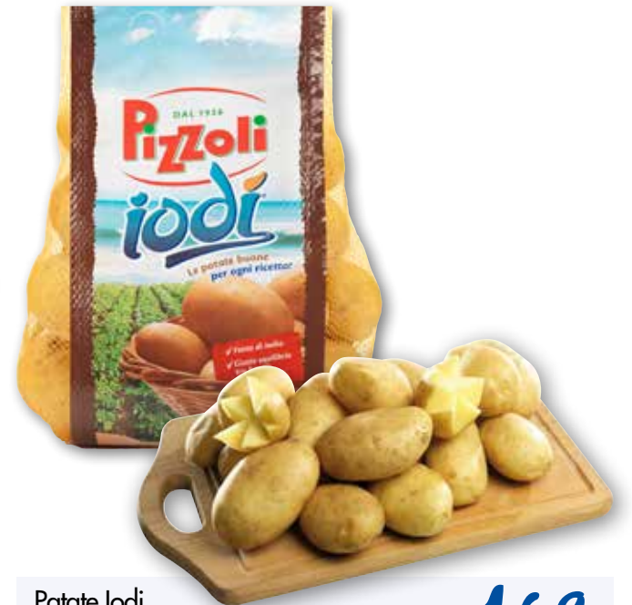
Patate lodi rete da kg 1,5 al kg € 1,13