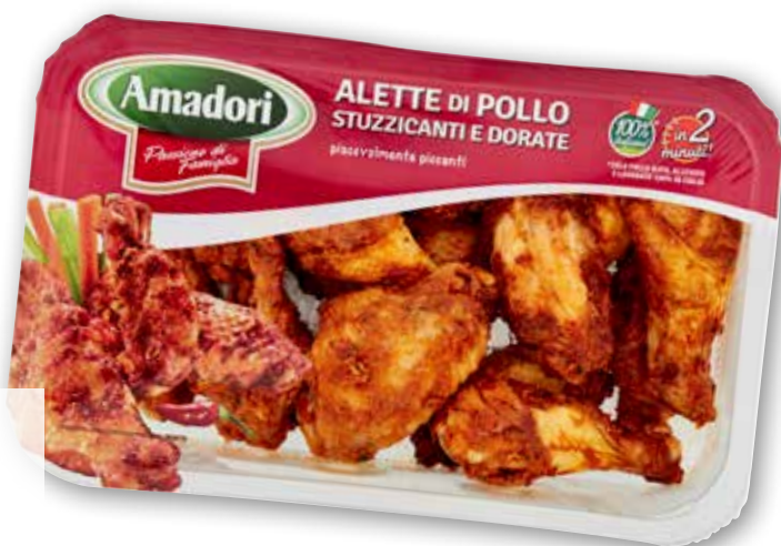
Alette piccanti Amadori g 500 al kg € 7,98