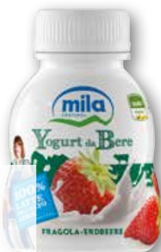
Yogurt da bere Mila fragola, banana, pesca, ml 200 al litro € 2,95