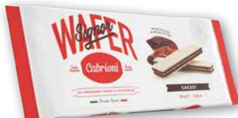
Signor Wafer Cabrioni cacao, vaniglia, nocciola, g 150 al kg € 4,60