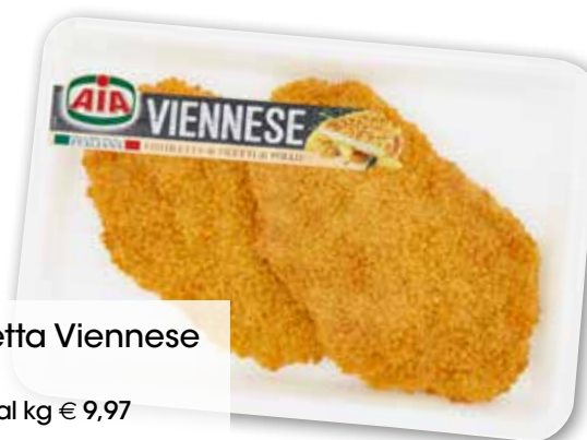
Cotoletta Viennese Aia g 300 al kg € 9,97