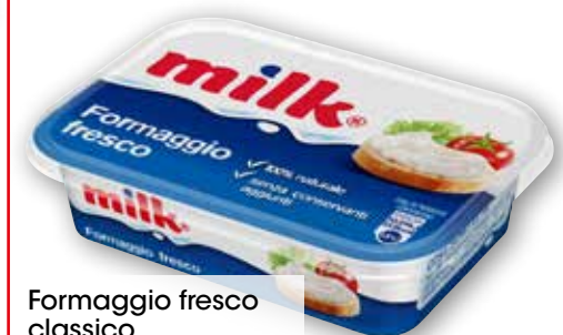
Formaggio fresco classico Milk g 200 al kg € 3,95