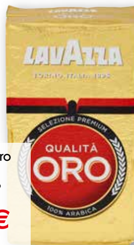
Caffè Qualità Oro Lavazza g 250 al kg € 13,96