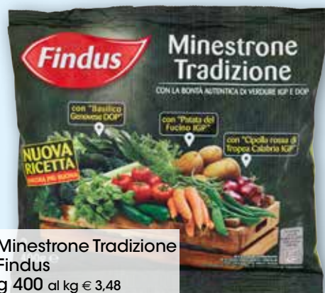
Minestrone Tradizione Findus g 400 al kg € 3,48