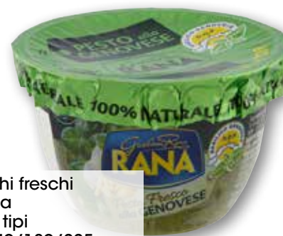
Sughi freschi Rana vari tipi g 140/180/225 al kg € 10,64/8,28/6,62