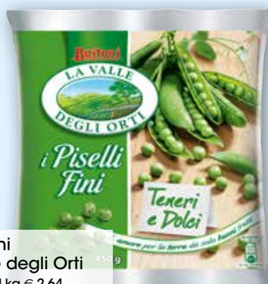
Piselli fini La Valle degli Orti g 450 al kg € 2,64