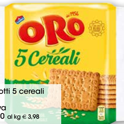
Biscotti 5 cereali Oro Saiwa g 400 al kg € 3,98