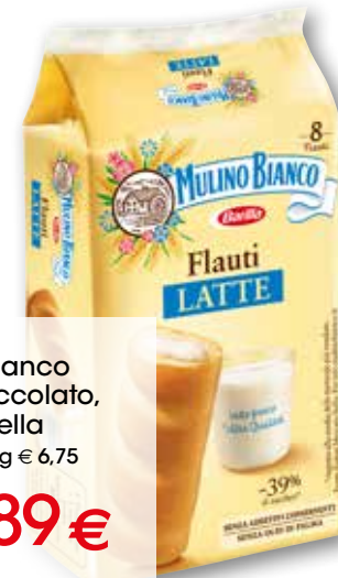
Flauti Mulino Bianco latte, cioccolato, stracciatella g 280 al kg € 6,75