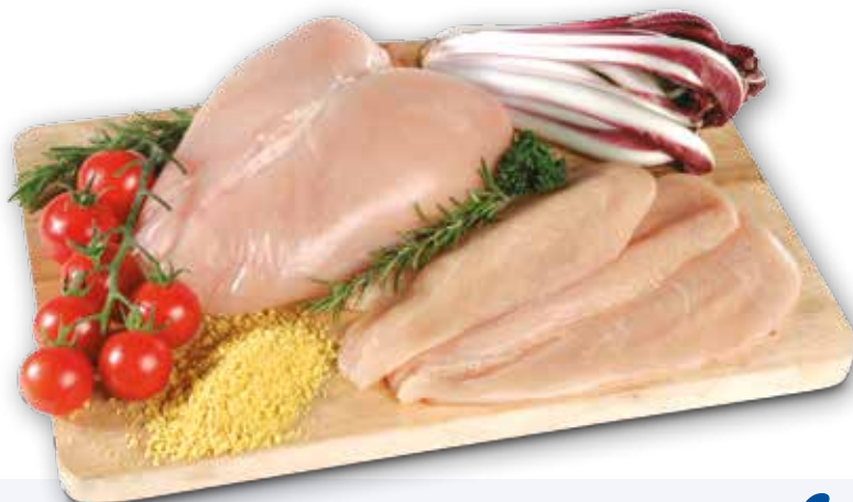
Petto di pollo a fette