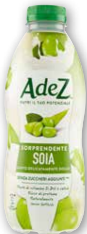
Bevanda di soia Adez Cl 80 al litro € 2,24