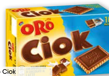
Oro Ciok Saiwa latte, nocciola g 250 al kg € 7,96