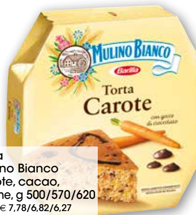
Torta Mulino Bianco carote, cacao, limone, g 500/570/620 al kg € 7,78/6,82/6,27