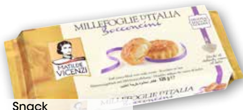
Snack Vicenzi bocconcini al latte, crema pasticcera, nocciola, g 125 al kg € 7,92