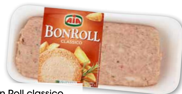
Bon Roll classico Aia g 750 al kg € 6,65