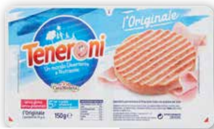
Teneroni classici Casa Modena g 150 al kg € 12,60