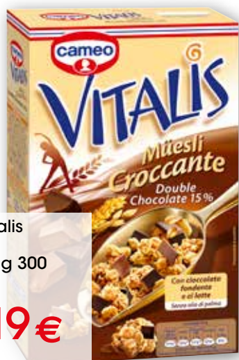
Müesli Vitalis Cameo vari gusti, g 300 al kg € 7,30