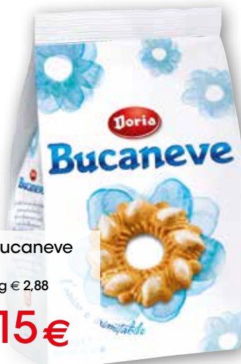
Biscotti Bucaneve Doria g 400 al kg € 2,88