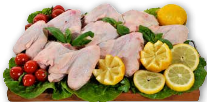
Ali non separate