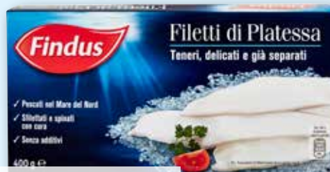
Filetti di platessa Findus g 400 al kg € 13,73