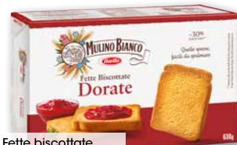
Fette biscottate Mulino Bianco Dorate, integrali g 630 al kg € 2,68