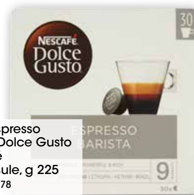
Caffè Espresso Barista Dolce Gusto Nescafé 30 capsule, g 225 al kg € 37,78