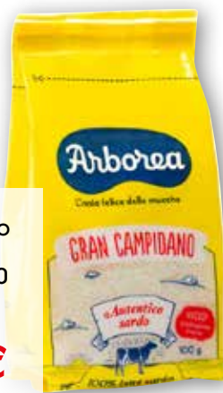
Formaggio Gran Campidano Arborea grattugiato, g 100 al kg € 9,90