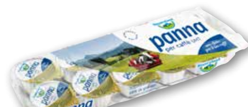
Panna monodose per caffè Bayernland g 10x10 al kg € 5,90