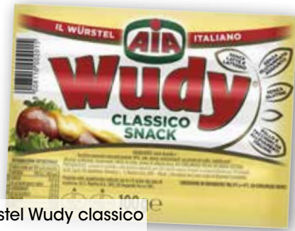
Wurstel Wudy classico Aia g 100 al kg € 3,90