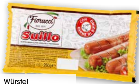
Wurstel Suillo g 250 al kg € 3,96