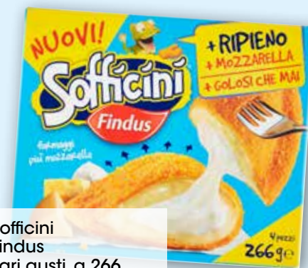
Sofficini Findus vari gusti, g 266 al kg € 7,48