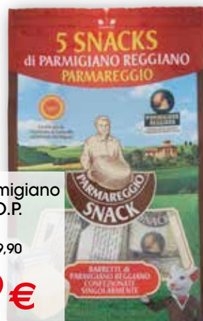
Snacks di Parmigiano Reggiano D.O.P. Parmareggio g 100 al kg € 19,90