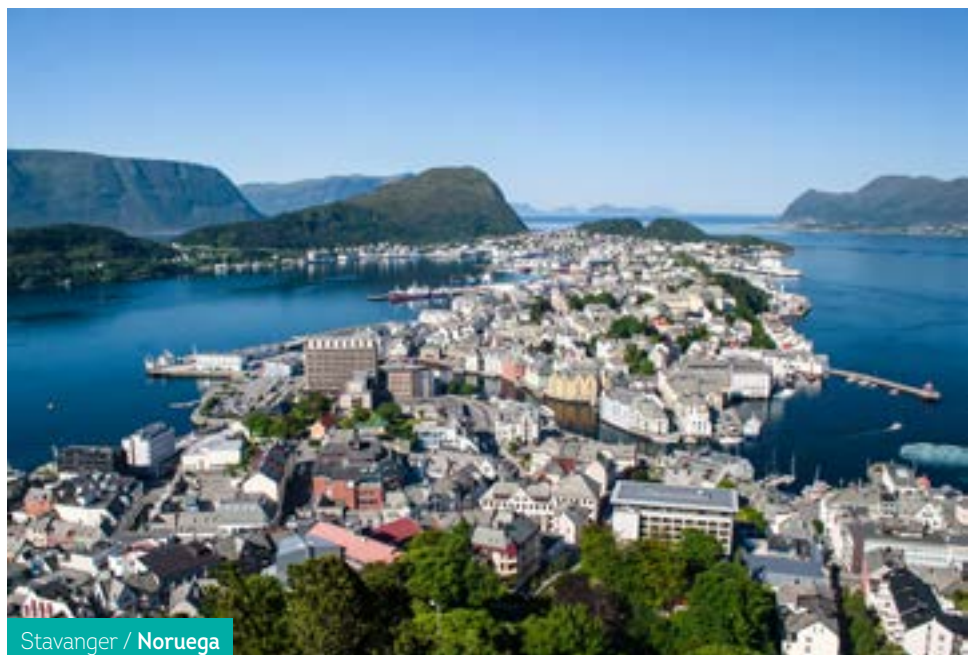
Stavanger / Noruega

Por motivos climatológicos de fuerza mayor, en raras ocasiones, los horarios de los ferris utilizados pueden variar adaptándose el programa del día afectado.