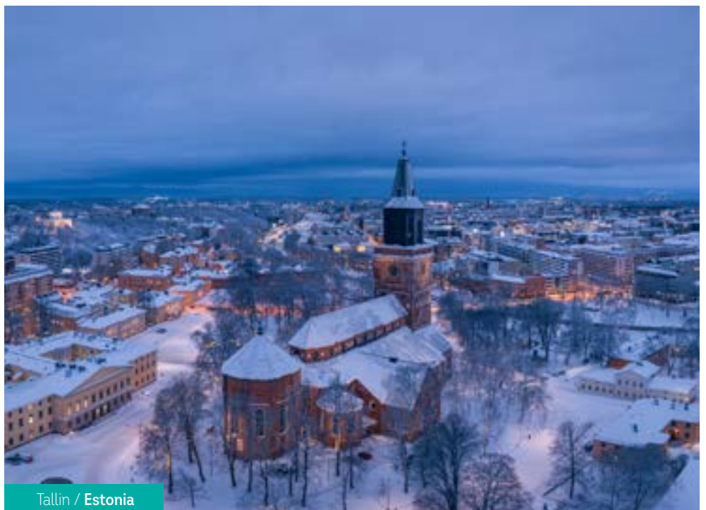
Tallin / Estonia