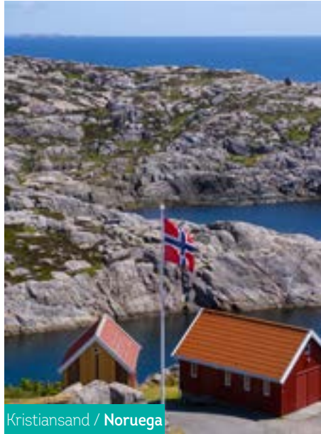
Kristiansand / Noruega