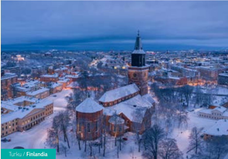
Turku / Finlandia