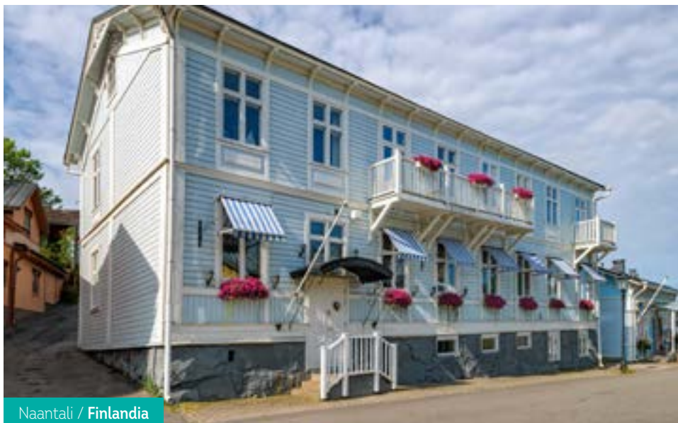
Naantali / Finlandia