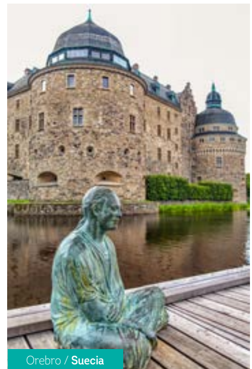
Orebro / Suecia