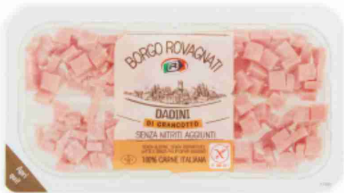
Prosciutto cotto a dadini Borgo Rovagnati g 90 al kg € 15,44