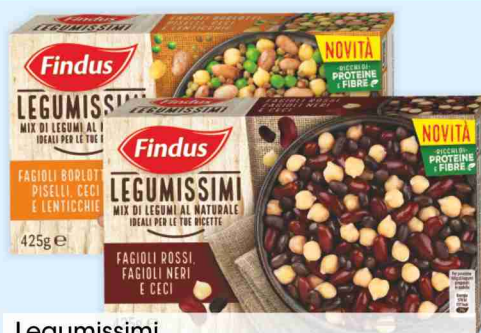
Legumissimi Findus fagioli borlotti, piselli, ceci e lenticchie fagioli rossi, neri e ceci g 425 al kg € 4,68