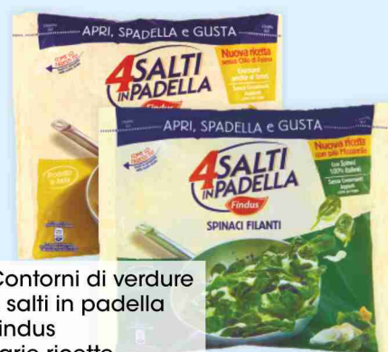
Contorni di verdure 4 salti in padella Findus varie ricette g 450 al kg € 5,98