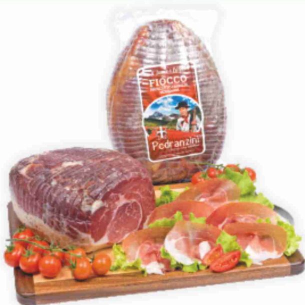
Fiocco della Valtellina Pedranzini al kg € 16,90