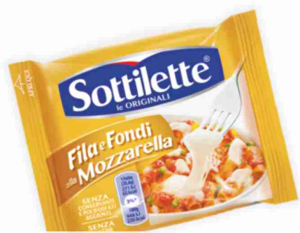
Sottilette Fila e Fondi g 200 al kg € 7,45