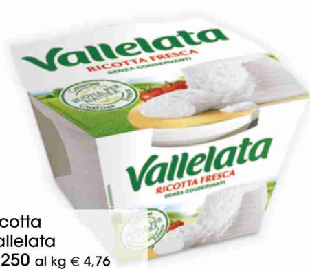
Ricotta Vallelata g 250 al kg € 4,76