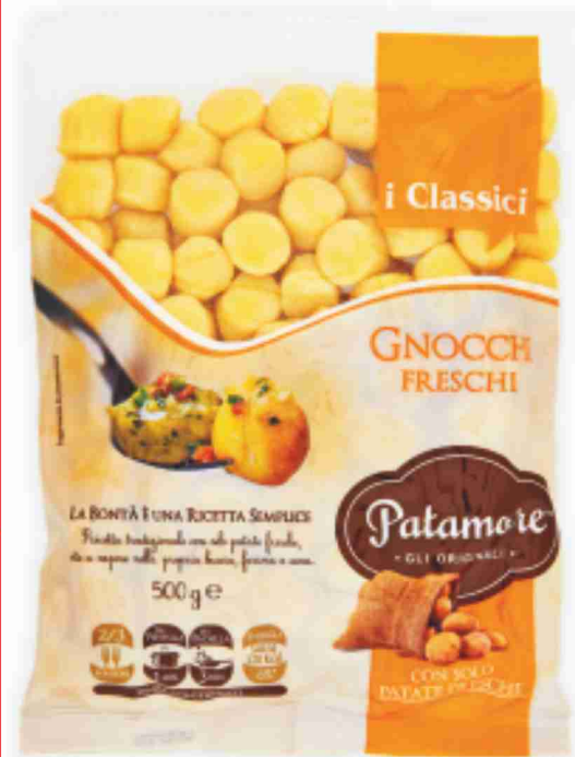
Gnocchi freschi Patamore g 500 al kg € 2,98