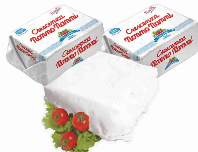
Crescenza Nonno Nanni confezione g 500 al kg € 10,90