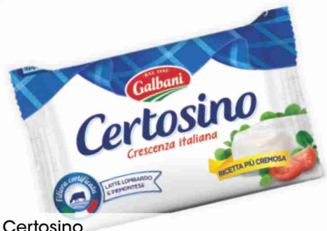
Certosino Galbani g 100 al kg € 8,90