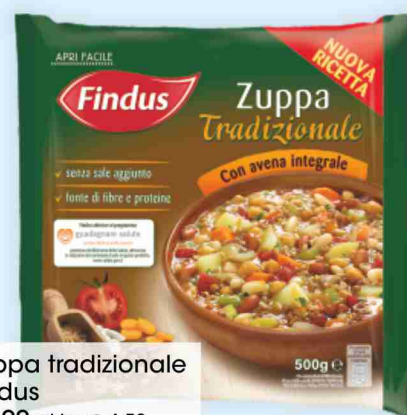
Zuppa tradizionale Findus g 500 al kg € 4,58