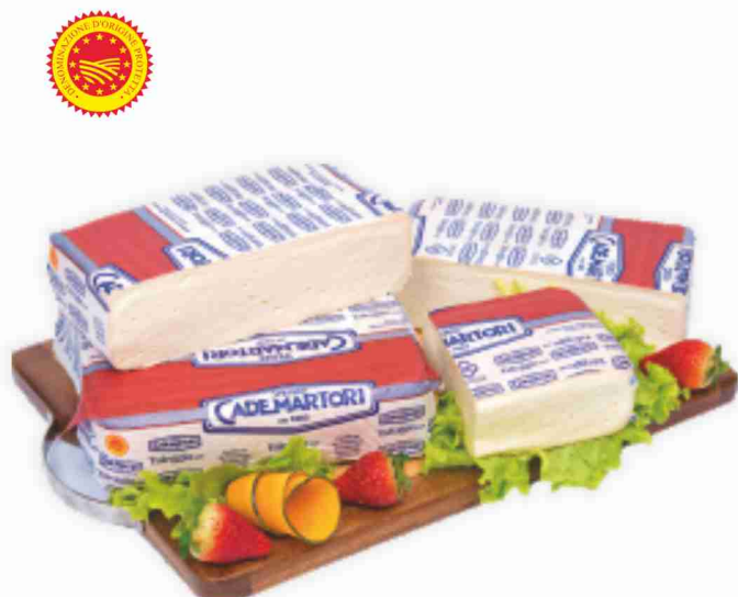
Taleggio D.O.P. Cademartori al kg € 8,90