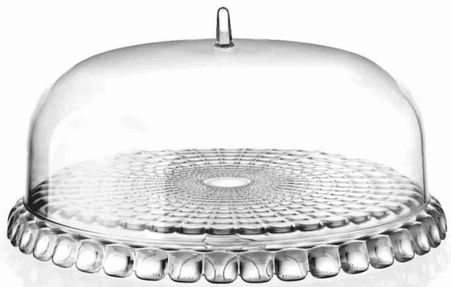
TORTIERA CON CAMPANA

30 BOLLINI + € 9,90 OPPURE 30 BOLLINI + 990 PUNTI