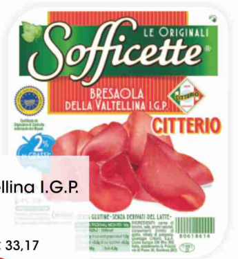
Bresaola della Valtellina I.G.P. Sofficette Citterio g 60 al kg € 33,17