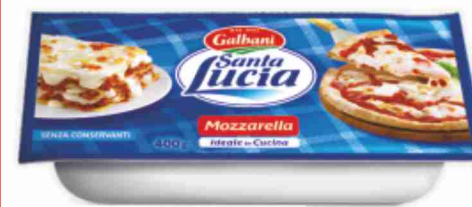
Mozzarella Santa Lucia Galbani panetto g 400 al kg € 7,48