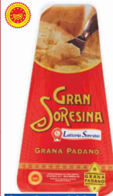
Grana Padano D.O.P. Latteria Soresina g 200 al kg € 11,95