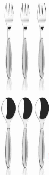
SET 3 POSATE

10 BOLLINI + € 2,90 OPPURE 10 BOLLINI + 290 PUNTI