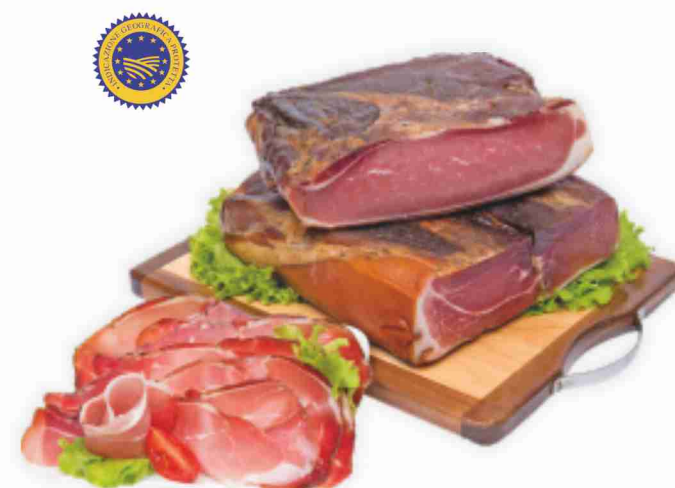
Speck dell'Alto Adige I.G.P. Sigma al kg € 13,90