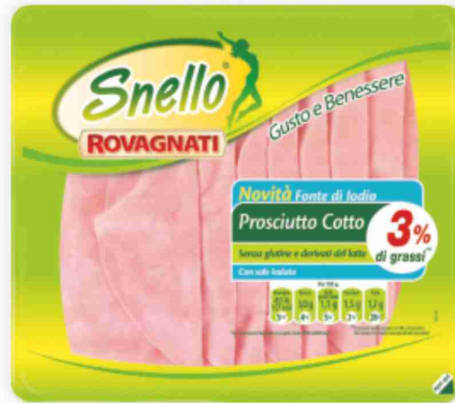
Prosciutto cotto Snello Rovagnati g 110 al kg € 15,36