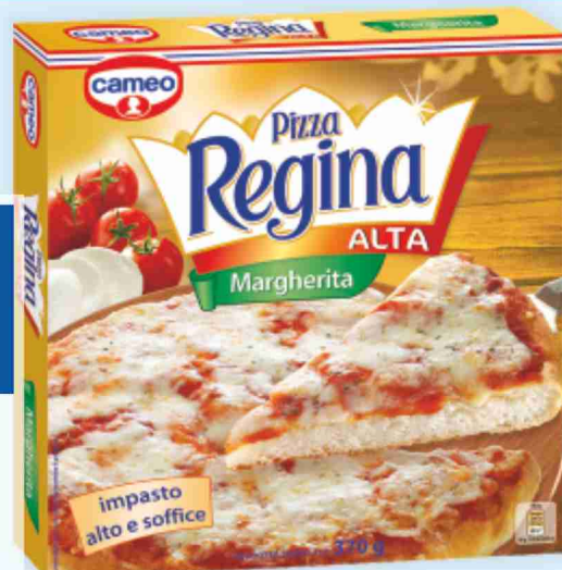
Pizza Regina Alta Cameo margherita g 370 al kg € 5,38