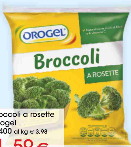
Broccoli a rosette Orogel g 400 al kg € 3,98