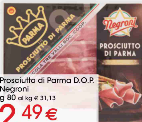
Prosciutto di Parma D.O.P. Negroni g 80 al kg € 31,13