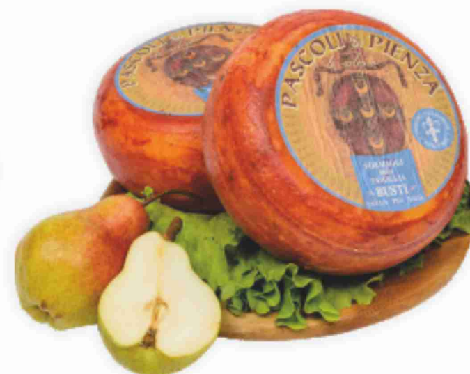
Pecorino Pascoli di Pienza Busti al kg € 13,90