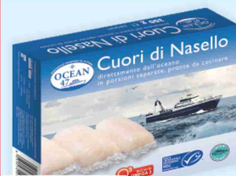
Cuori di nasello Ocean 47 g 300 al kg € 11,63