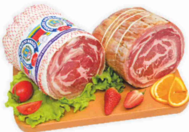
Pancetta coppata magrissima Cav. Umberto Boschi al kg € 14,90