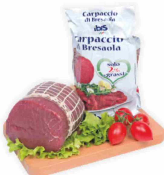
Carpaccio di bresaola Ibis al kg € 26,90