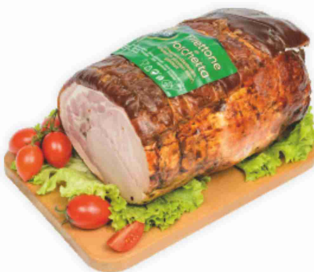
Filettone di porchetta Senfter al kg € 13,90