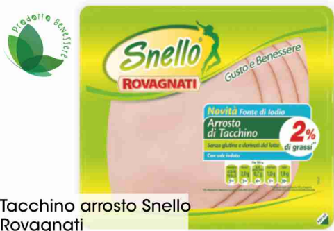
Tacchino arrosto Snello Rovagnati g 110 al kg € 13,55