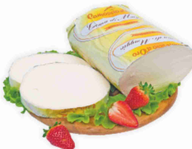
Crema di Maggio Camoscio D'oro al kg € 12,90