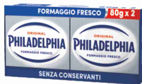
Philadelphia classico g 80x2 al kg € 9,31