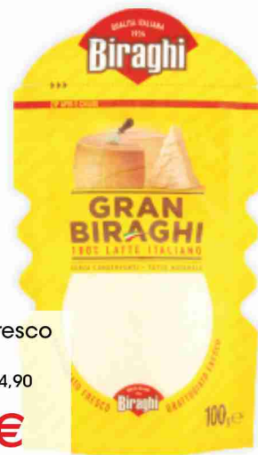
Grattugiato fresco Gran Biraghi g 100 al kg € 14,90