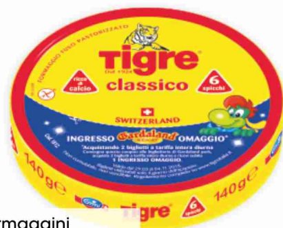
Formaggi Tigre g 140 al kg € 10,64