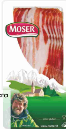
Pancetta affumicata Moser g 70 al kg € 28,43