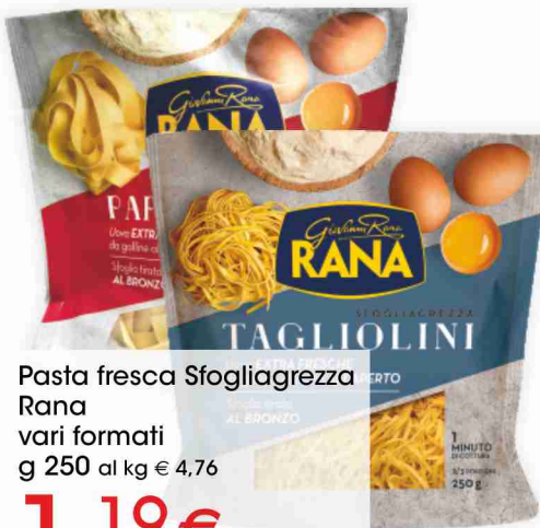
Pasta fresca Sfogliagrezza Rana vari formati g 250 al kg € 4,76