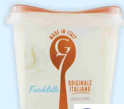
Gelati G7 vari gusti g 500