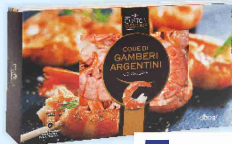
Code di gamberi argentini g 300