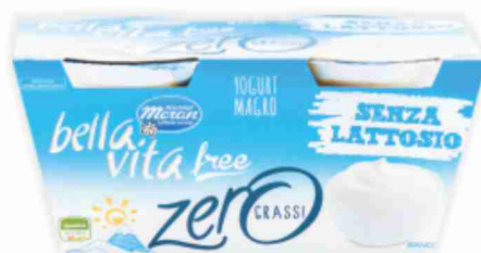
Yogurt senza lattosio zero grassi Bellavita Free Latteria Merano vari gusti g 125x2