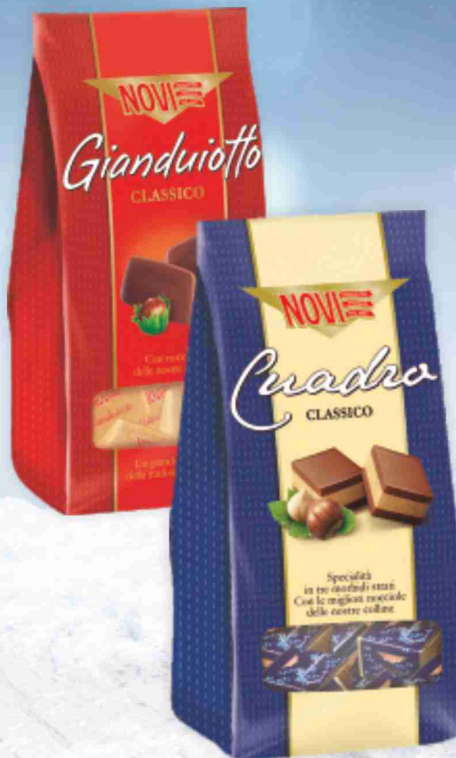
Cioccolatini Novi vari tipi da g 160 a g 130