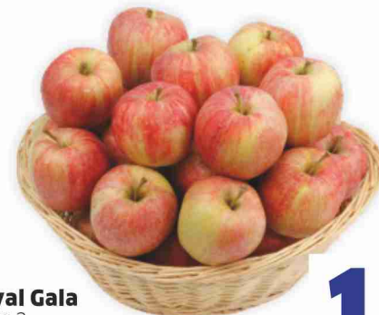
Mele Royal Gala sacchetto kg 2