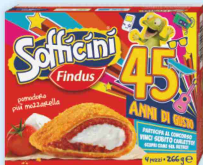
Sofficini Findus vari gusti g 266