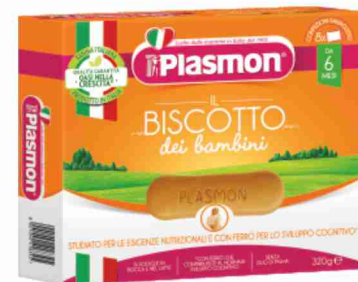
Biscotto Plasmon g 320