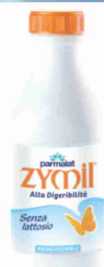
Latte U.H.T. Zymil Parmalat parz. scremato litri 1