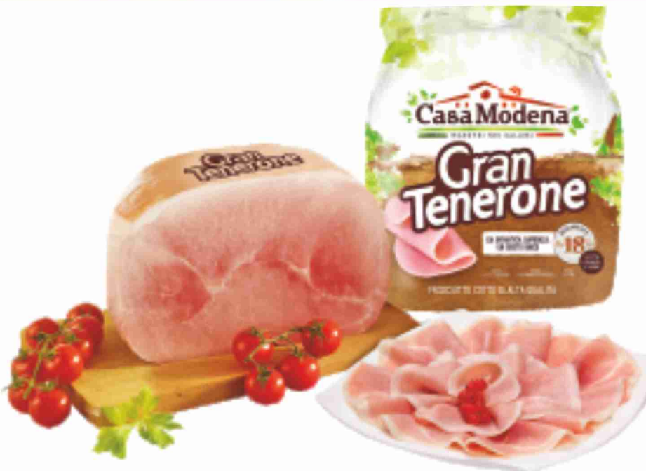
Prosciutto cotto di Alta Qualità Gran Tenerone Casa Modena al kg 14,90