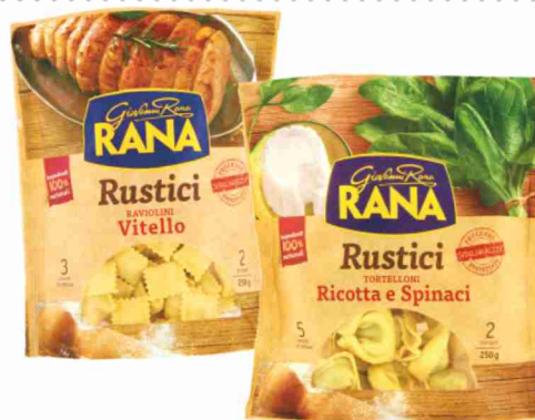
Pasta fresca ripiena Rustici Rana vari tipi g 250