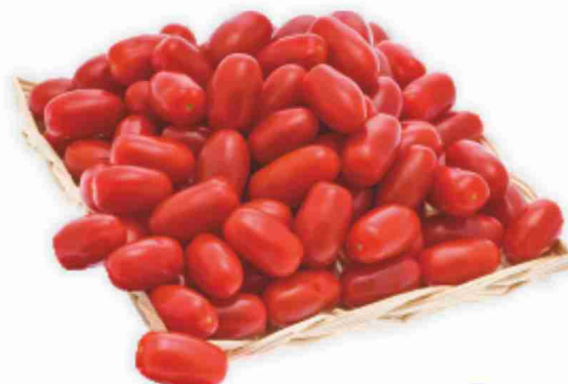
Pomodori datterini g 300