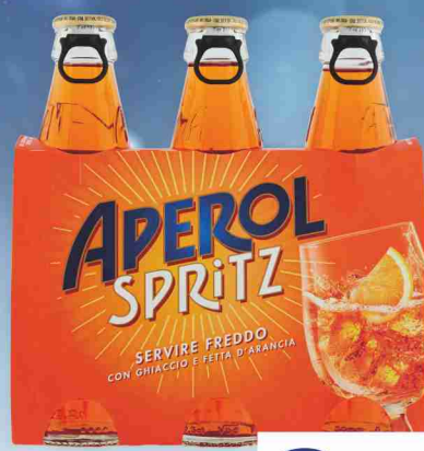
Spritz Aperol cl 17,5x3