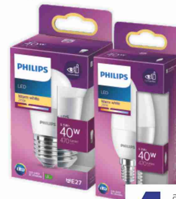
Lampadine LED Philips luce calda, naturale vari tipi, 40/60W