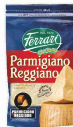
Parmigiano Reggiano D.O.P. Ferrari grattugiato g 100