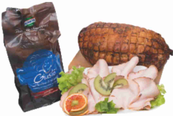
Petto di tacchino rustico Kometa al kg 13,90