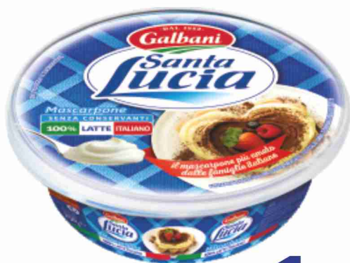
Mascarpone Santa Lucia Galbani g 250