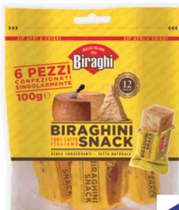
Biraghini snack Biraghi g 100