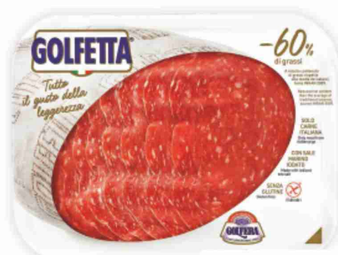
Salame Golfetta Golfera g 100