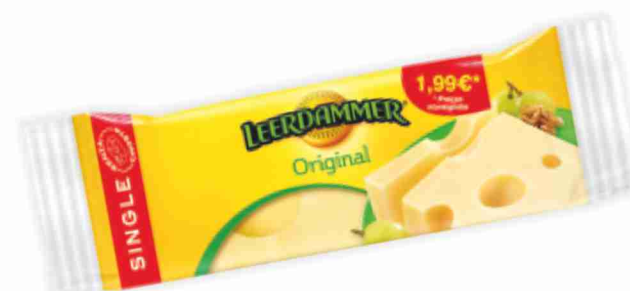
Leerdammer g 150