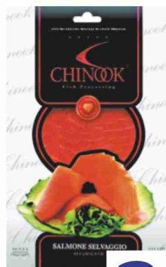
Salmone selvaggio affumicato Chinook g 80