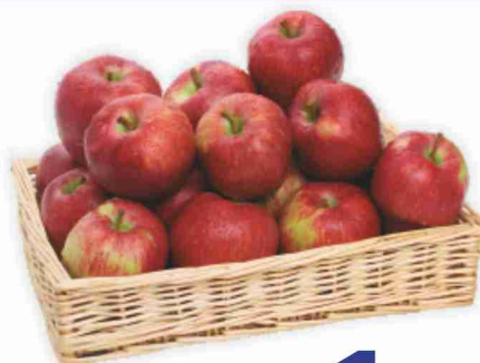
Mele Red Delicious