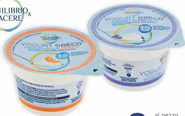
Yogurt greco magro vari gusti g 150