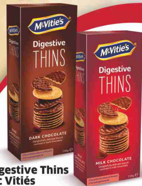
Digestive Thins Mc Vitiés dark, milk g 150