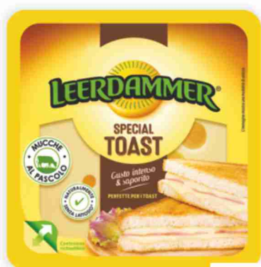
Special Toast Leerdammer g 125