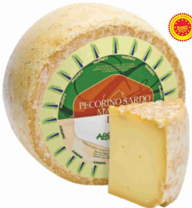
Pecorino Sardo maturo D.O.P. Argiolas al kg 16,90