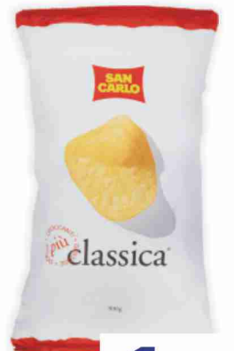
Patatina classica San Carlo g 300