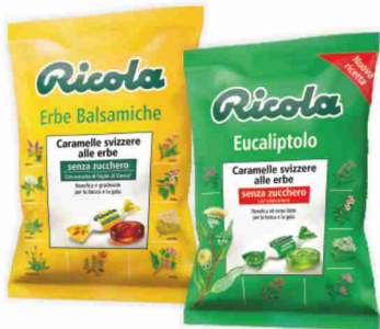
Caramelle Ricola vari tipi g 70