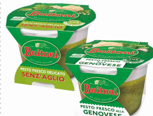
Pesto fresco Buitoni alla genovese, senz'aglio g 130