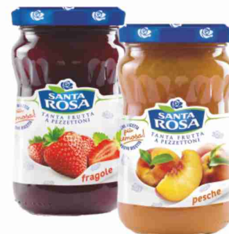
Confetture Santa Rosa vari gusti g 350