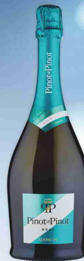
Spumante brut Pinot di Pinot Gancia cl 75