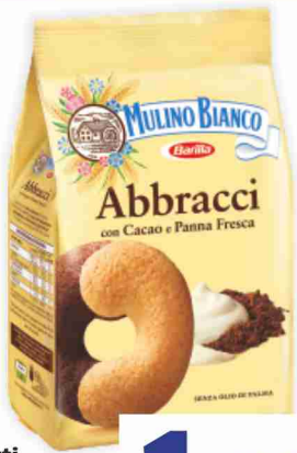
Biscotti Mulino Bianco Abbracci, Nascondini g 350/330