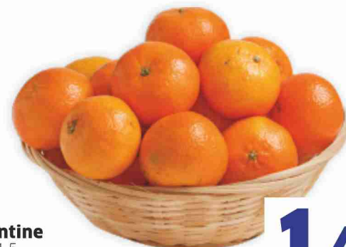
Clementine rete kg 1,5