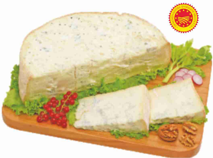
Gorgonzola D.O.P. Gim al kg 8,90