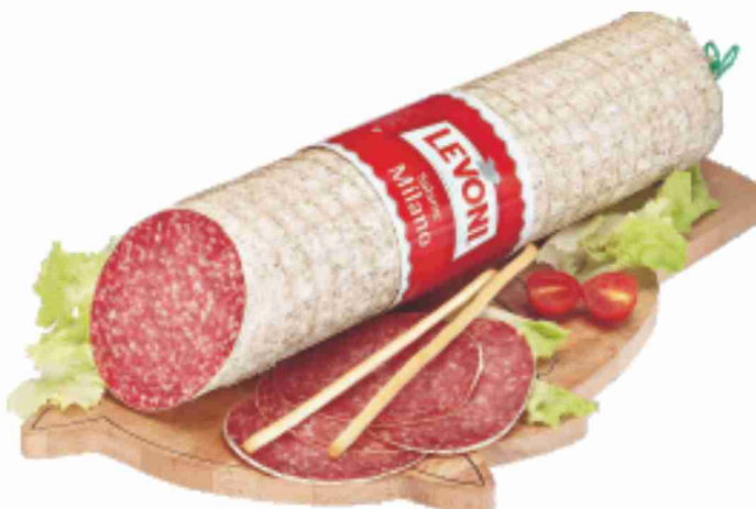
Salame Milano Levoni al kg 18,90