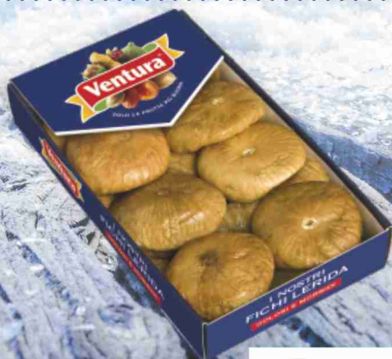
Fichi Lerida Ventura g 250