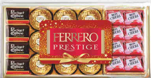
Prestige Ferrero g 246