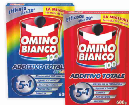
Additivo per bucato 100 più Omino Bianco normale, color g 600