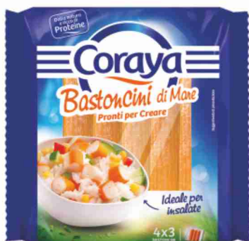
Bastoncini di mare Coraya g 180