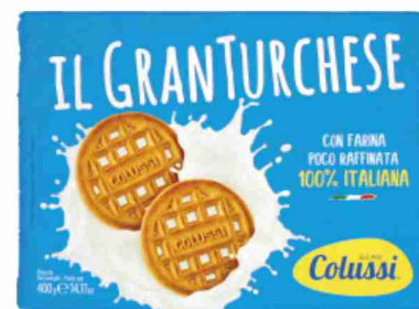
Biscotti Il Granturche Colussi g 400