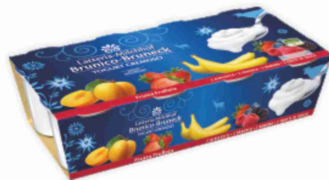
Yogurt Lattoria Brunica gusti assortiti, vari tipi g 125x8