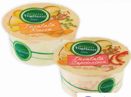
Insalate Vogliazzi capricciosa, russa g 150