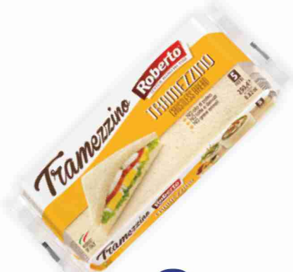
Pane da tramezzino Roberto g 250