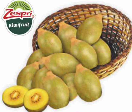
Kiwi Gold g 500