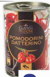
Pomodorini datterino g 400