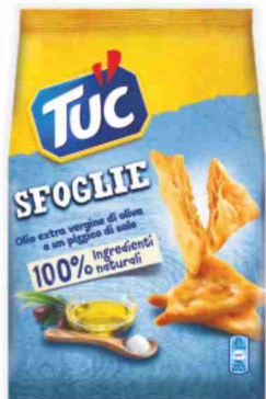
Sfoglie Tuc vari tipi g 170