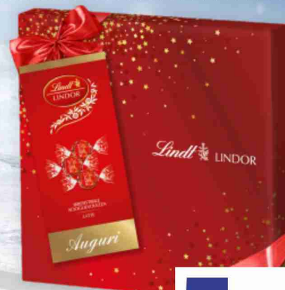
Praline Lindor Lindt latte, fondente, assortite g 287