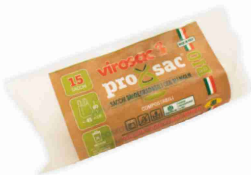
Sacchi biodegradabili con maniglie ViroSac cm 45x60, pezzi 15