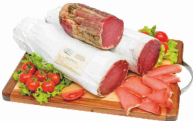
Lonzino nazionale Salumeria Di Monte San Savino al kg 16,90