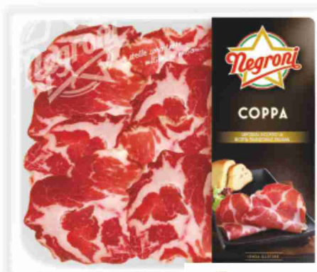
Coppa Negroni g 100