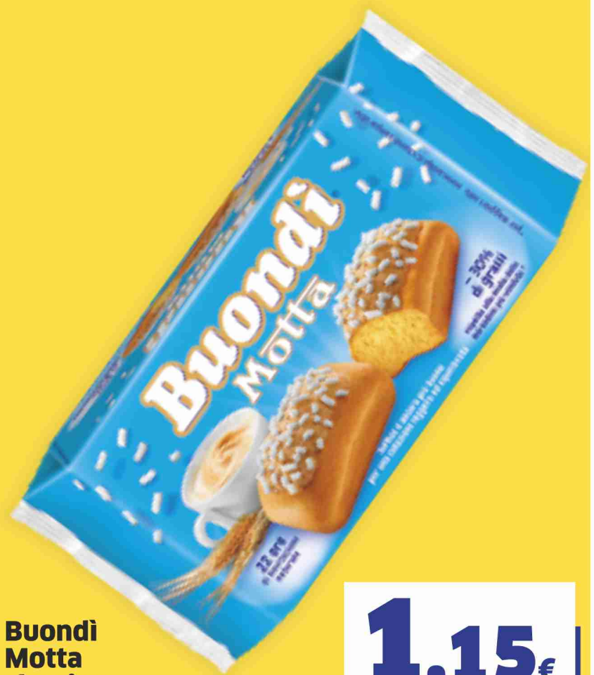
Buondi Motta classico g 198