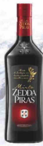
Mirto rosso di Sardegna Zedda Piras cl 50