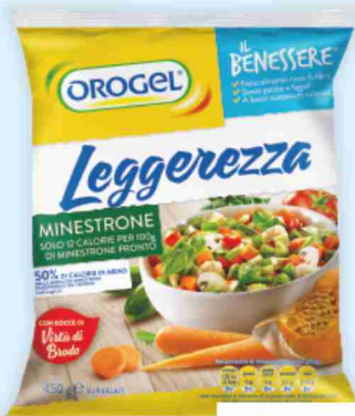
Minestrone leggerezza Orogel g 450