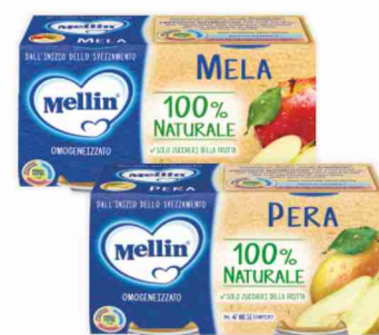
Omogeneizzati alla frutta Mellin vari gusti g 100x2