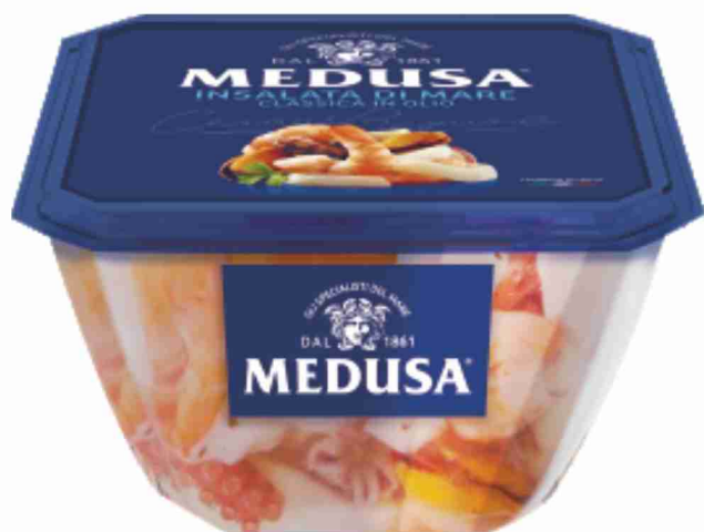
Insalata di mare Medusa g 150