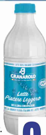
Latte U.H.T. Granarolo piacere leggero parz. scremato litri 1