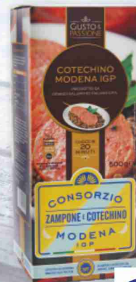
Cotechino Modena I.G.P. Gusto&Passione g 500