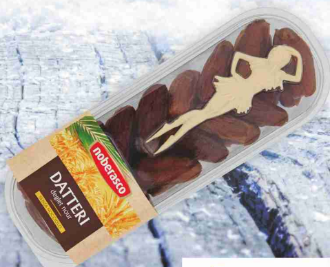
Datteri denocciolati Noberasco g 200