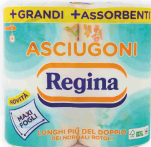
Asciugoni maxi Regina 2 rotoli