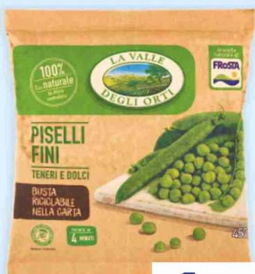
Piselli fini La Valle degli Orti g 450