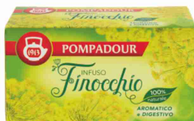
Infusi Pompadour vari tipi, 20 filtri da g 60 a g 30