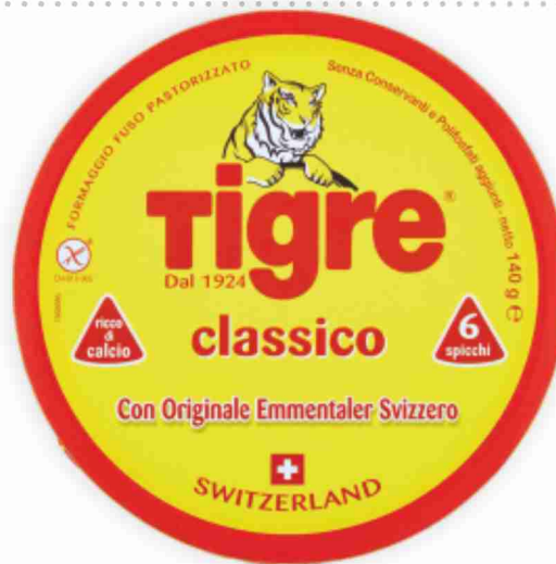
Formaggini Tigre g 140