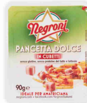
Pancetta a cubetti Negroni dolce, affumicata g 90