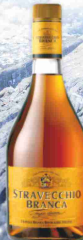
Brandy stravecchio Branca cl 70