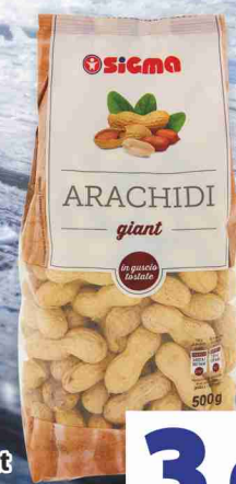
Arachidi Giant Sigma g 500