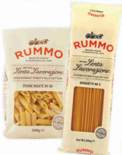
Pasta di semola Rummo vari formati g 500