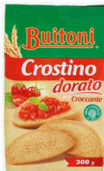
Crostini Buitoni vari tipi g 300