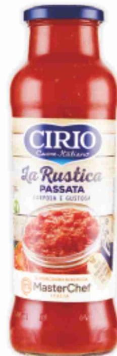
Passata La Rustica Cirio g 680