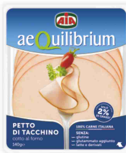
Petto di tacchino al forno Aequilibrium Aia g 140