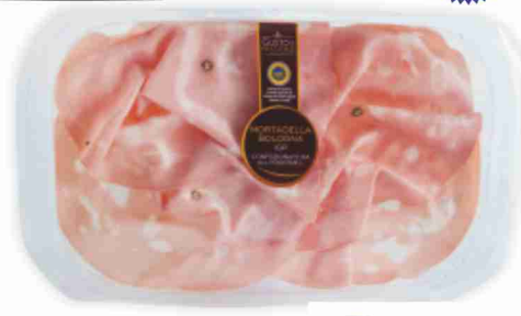
Mortadella I.G.P. g 110