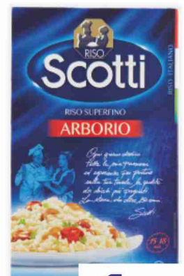
Riso superfino Arborio Scotti kg 1