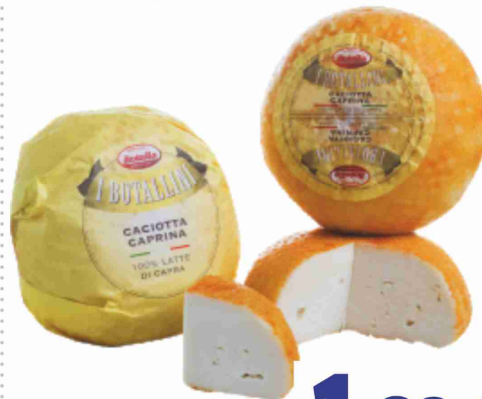
Caciotta caprina Botalla al kg 18,90