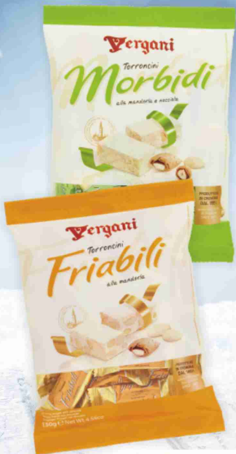
Torroncini Vergani vari tipi g 130