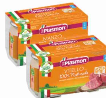
Omogeneizzati di carne Plasmon vari gusti g 80x2