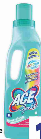
Candeggina Gentile Ace vari tipi litri 1