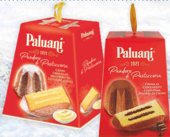
Pandoro Paluani vari tipi g 750