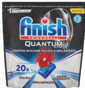
Detersivo per lavastoviglie Finish Powerball Quantum Ultimate classico, limone 20 tabs