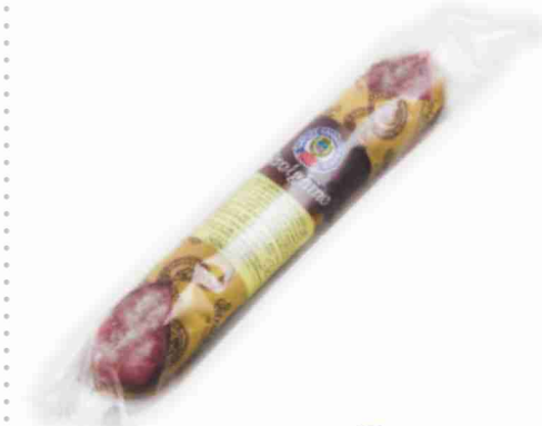
Strolghino Cav. Umberto Boschi g 190