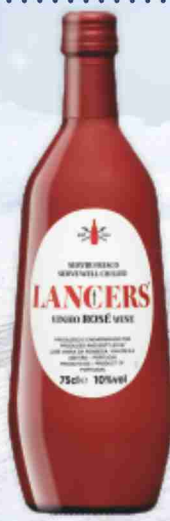
Vino rosé Lancers cl 75