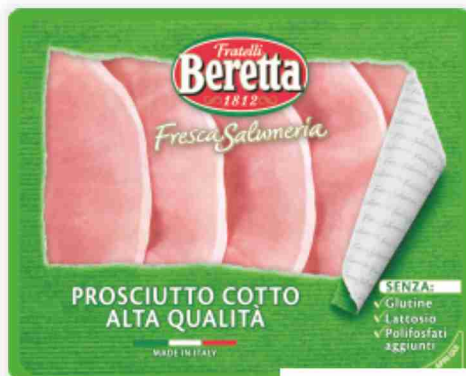
Prosciutto cotto Fresca Salumeria Beretta g 120