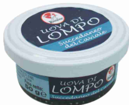
Uova di lompo Riunione nere, rosse g 50