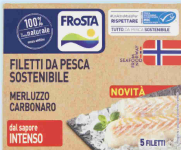
Filetti di merluzzo carbonaro Frosta g 240