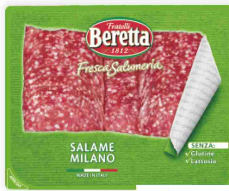
Salame Milano Fresca Salumeria Beretta g 100