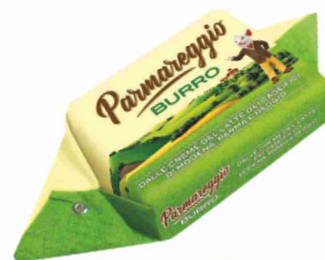
Burro Parmareggio g 200