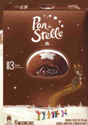
Mooncake g 210