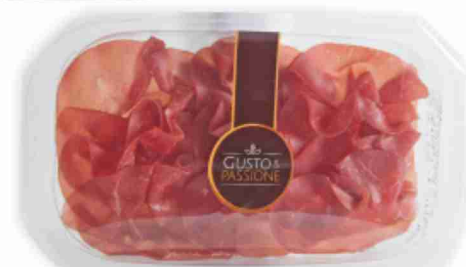
Bresaola g 80