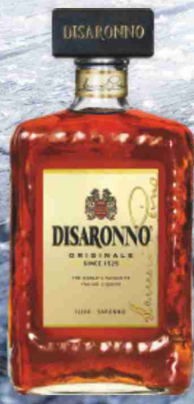
Amaretto Disaronno cl 70