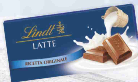
Tavolette di cioccolato Lindt latte, fondente g 100