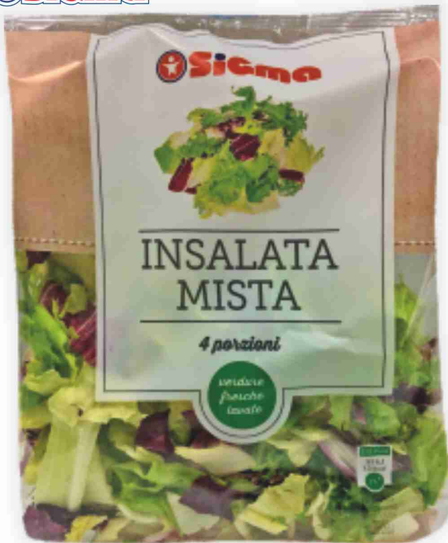
Insalata mista g 200