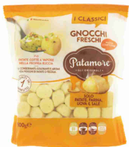
Gnocchi freschi Patamore g 500