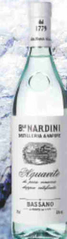
Acquavite Nardini cl 70