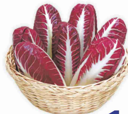
Radicchio precoce lungo