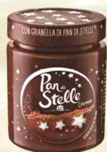
Crema spalmabile g 330