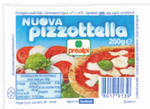
Nuova pizzottella Prealpi g 250