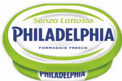
Philadelphia senza lattosio g 175