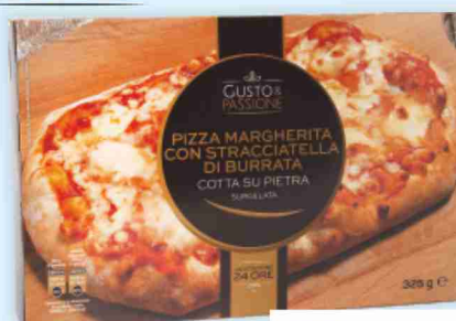
Pizza margherita con stracciatella di burrata, salsiccia e friarielli g 325/330