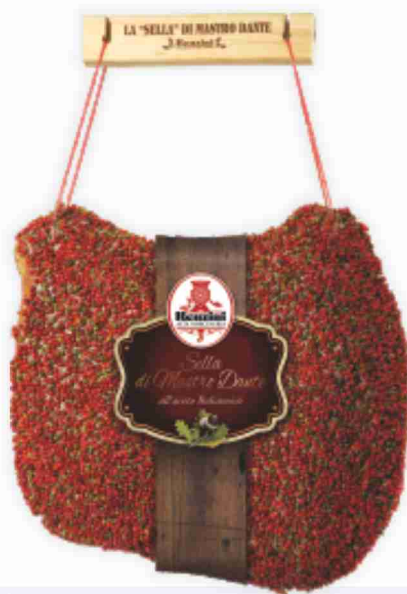
La sella di Mastro Dante con pepe Renzini al kg € 19,90 € 1,99 all'etto