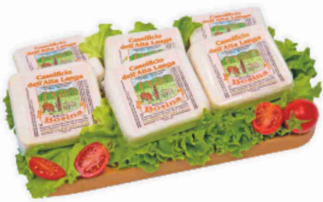
Robiola Bosina Caseificio Alta Langa al kg € 14,90 € 1,49 all'etto