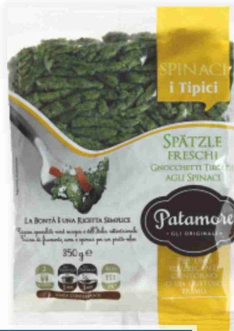
Spätzle Patamore agli spinaci, classici g 350 al kg € 3,69