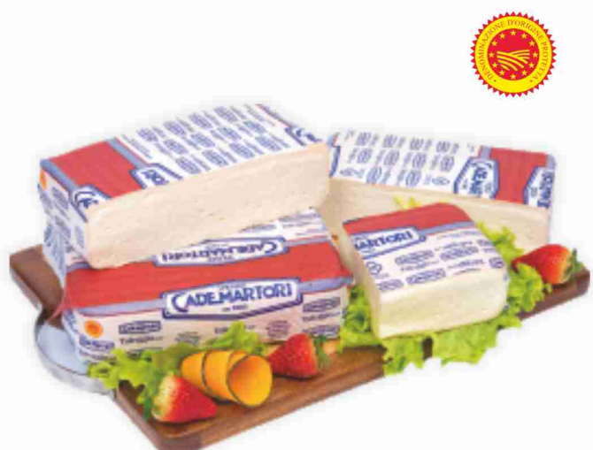
Taleggio D.O.P. Cademartori al kg € 9,90 € 0,99 all'etto