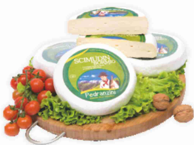
Scimudin latte crudo Pedranzini al kg € 9,90 € 0,99 all'etto