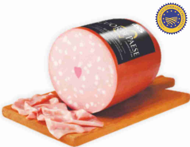
Mortadella Bologna I.G.P. Cuor di Paese Ibis al kg € 8,90 € 0,89 all'etto