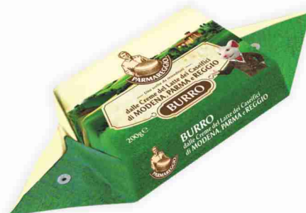
Burro Parmareggio g 200 al kg € 7,95