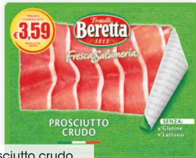
Prosciutto crudo Fresca Salumeria Beretta g 100 al kg € 25,90