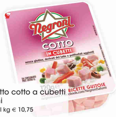
Prosciutto cotto a cubetti Negrone g 120 al kg € 10,75