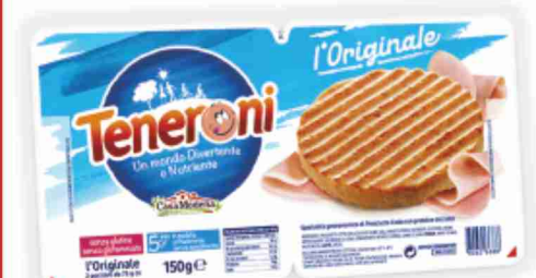
Teneroni Casa Modena l'Originale, mozzarella g 150 al kg € 12,60