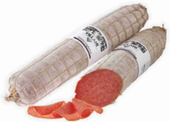
Salame Ungherese Villani al kg € 15,90 € 1,59 all'etto