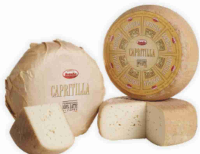
Capritilla Botalla al kg € 18,90 € 1,89 all'etto