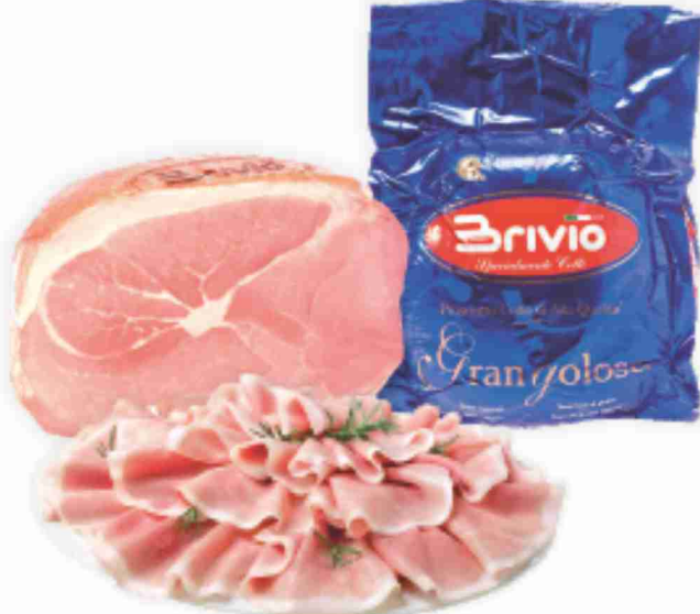
Prosciutto Cotto Grangoloso Brivio al kg € 13,90 € 1,39 all'etto