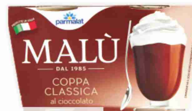
Coppa Malù Parmalat classica g 200 al kg € 6,95