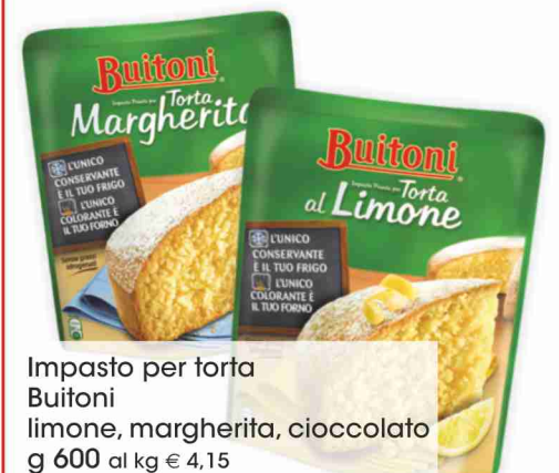
Impasto per torta Buitoni limone, margherita, cioccolato g 600 al kg € 4,15