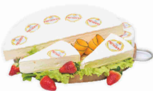
Brie President al kg € 9,90 € 0,99 all'etto