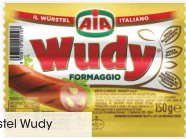
Wurstel Wudy Aia con formaggio g 150 al kg € 3,27