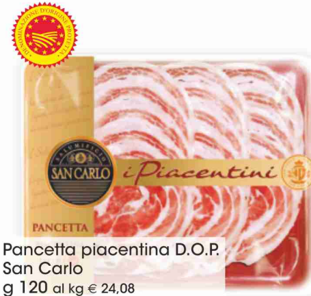
Pancetta piacentina D.O.P. San Carlo g 120 al kg € 24,08