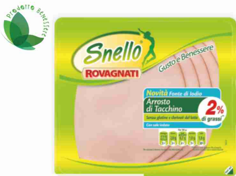
Tacchino arrosto Snello Rovagnati g 110 al kg € 17,18