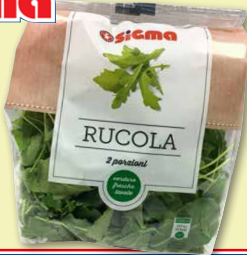
Rucola g 100 al kg € 9,90