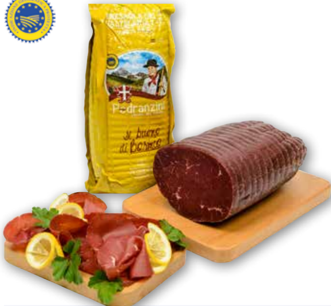
Bresaola della Valtellina I.G.P. Pedranzini al kg € 22,90