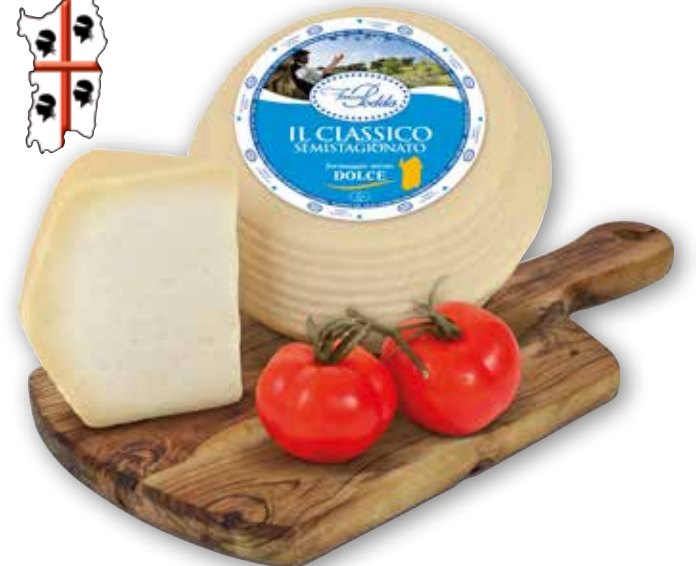
Il Classico semistagionato Podda al kg € 12,90