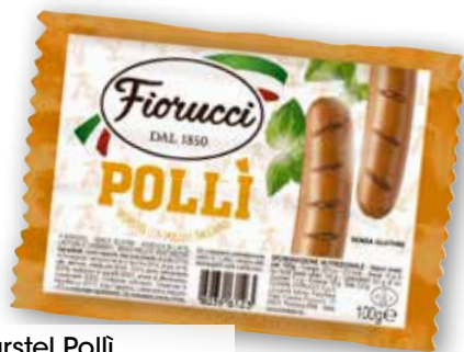
Wurstel Polli Fiorucci g 100 al kg € 3,90