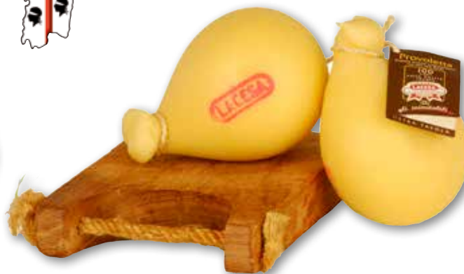
Provoletta Lacesa al kg € 10,90