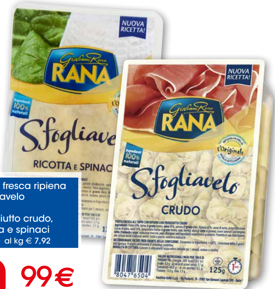
Pasta fresca ripiena Sfogliavello Rana prosciutto crudo, ricotta e spinaci g 125 al kg € 7,92