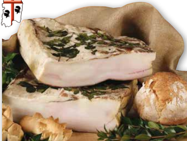
Lardo al mirto intero Su Sirboni al kg € 9,90