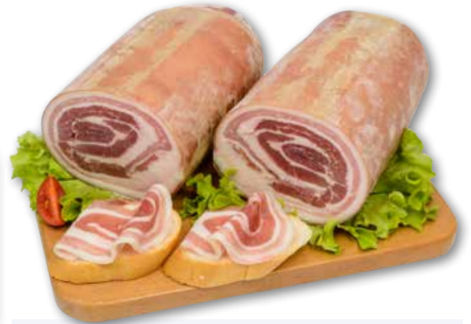
Pancetta steccata Gagliardi al kg € 12,90