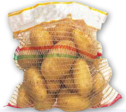
Patate bianche rete kg 4 al kg € 0,62