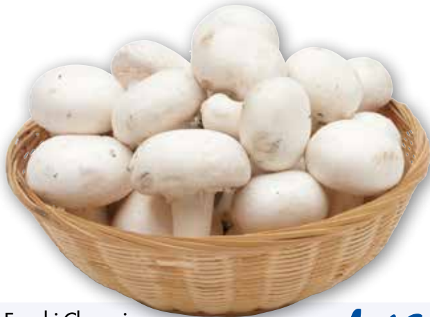
Funghi Champignon g 500 al kg € 2,98