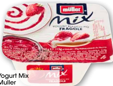
Yogurt Mix Muller vari gusti, g 150 al kg € 4,60