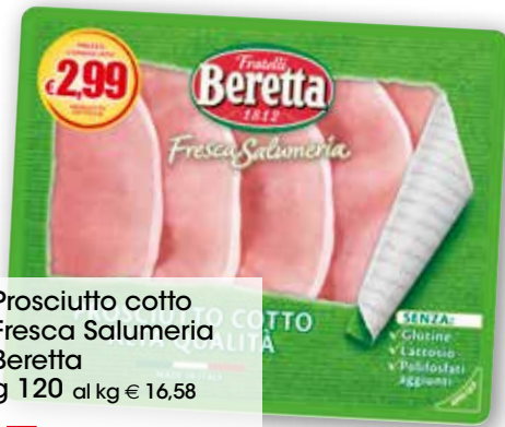
Prosciutto cotto Fresca Salumeria Beretta g 120 al kg € 16,58