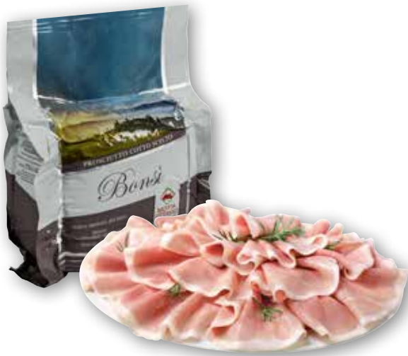
Prosciutto cotto Bonsi Radice al kg € 7,90