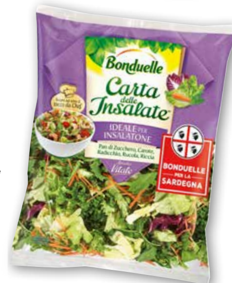
Carta delle insalate Vitale Bonduelle g 200 al kg € 7,50