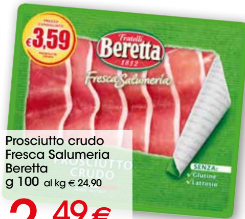
Prosciutto crudo Fresca Salumeria Beretta g 100 al kg € 24,90