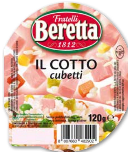
Cubetti di prosciutto cotto Beretta g 120 al kg € 12,42