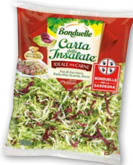
Carta delle insalate Prelibata Bonduelle g 150 al kg € 8,00