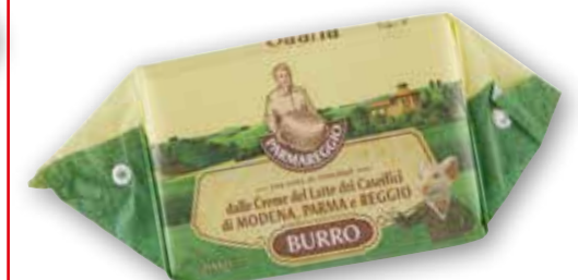
Burro Parmareggio g 200 al kg € 8,45