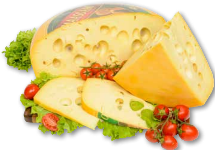
Maasdam Verde Pascolo Frico al kg € 5,90