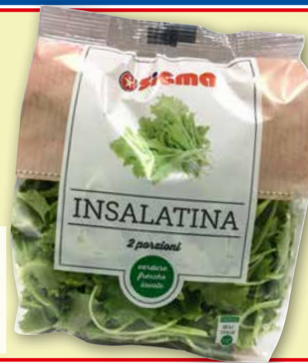
Insalatina g 100 al kg € 9,90