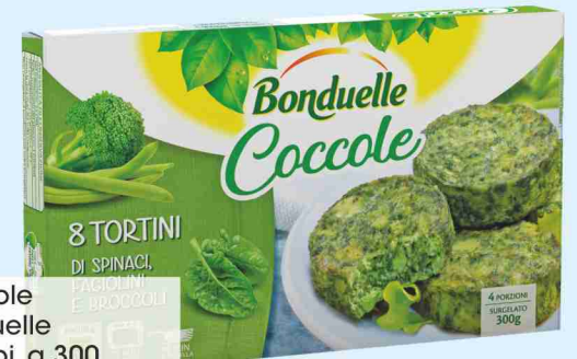
Coccole Bonduelle vari tipi, g 300 al kg € 8,30