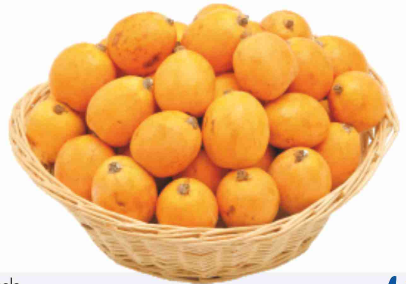
Nespole g 500 al kg € 3,40