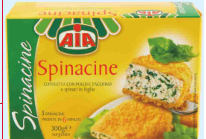
Spinacine Aia con pollo e tacchino g 300 al kg € 5,97