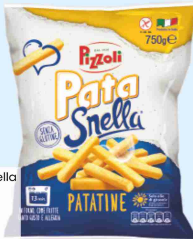
Patatine Patasnella Pizzoli g 750 al kg € 2,52