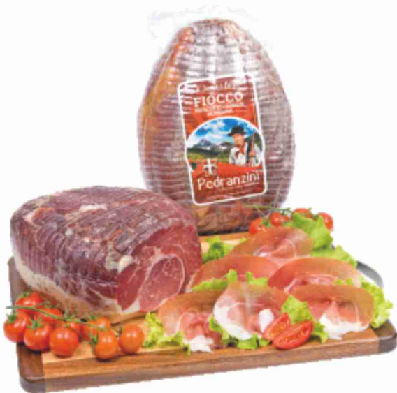
Fiocco della Valtellina Pedranzini al kg € 15,90