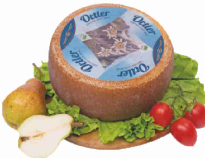
Ortler Alto Adige al kg € 11,90