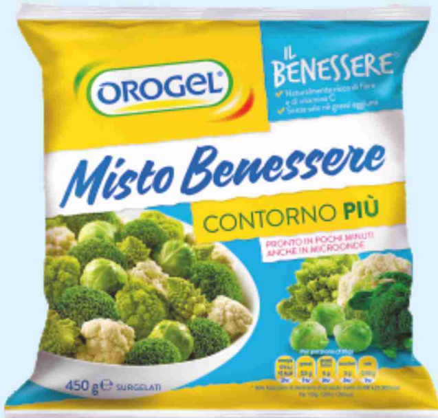
Contorno Misto Benessere Orogel g 450 al kg € 3,76