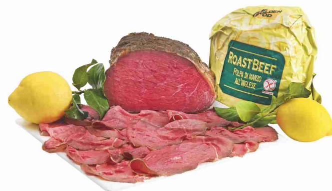
Roast beef all'inglese Goldenfood al kg € 19,90