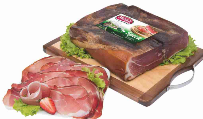
Speck Moser al kg € 14,90