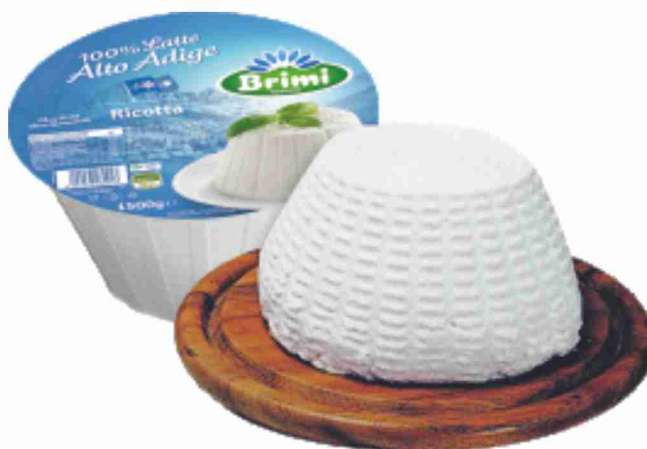
Ricotta Brimi al kg € 4,90