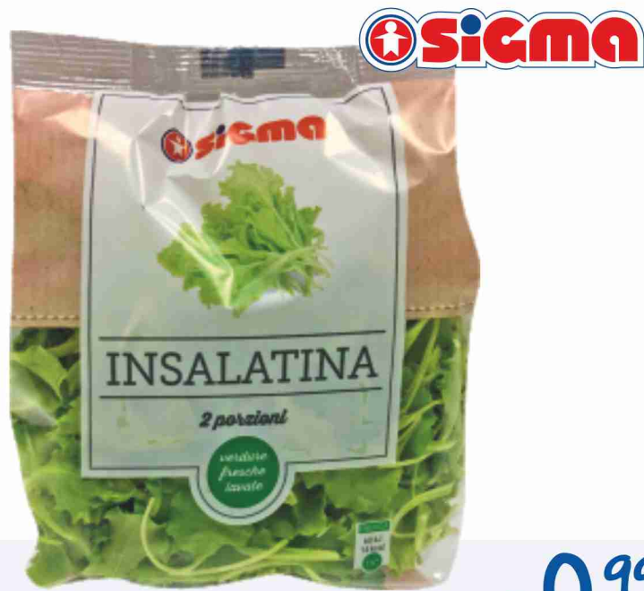
Insalatina g 100 al kg € 9,90