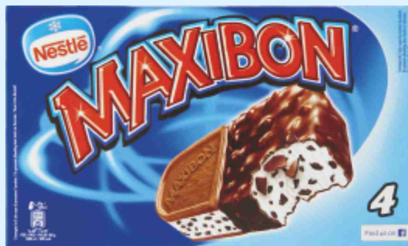
Maxibon Motta g 380 al kg € 6,55