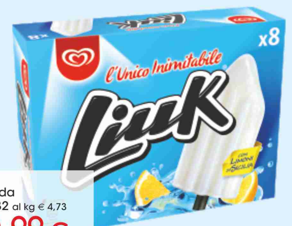
Liuk Algida g 632 al kg € 4,73