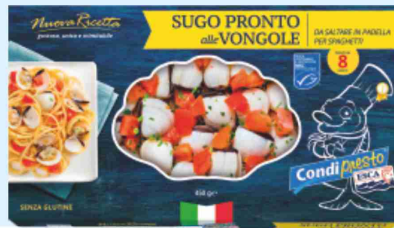
Sugo pronto alle vongole Condipresto Esca g 450 al kg € 7,31