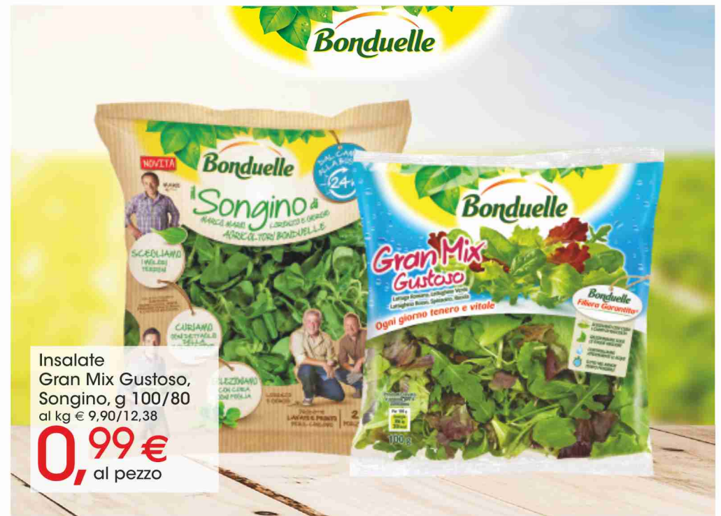
Insalate Gran Mix Gustoso, Songino, g 100/80 al kg € 9,90/12,38