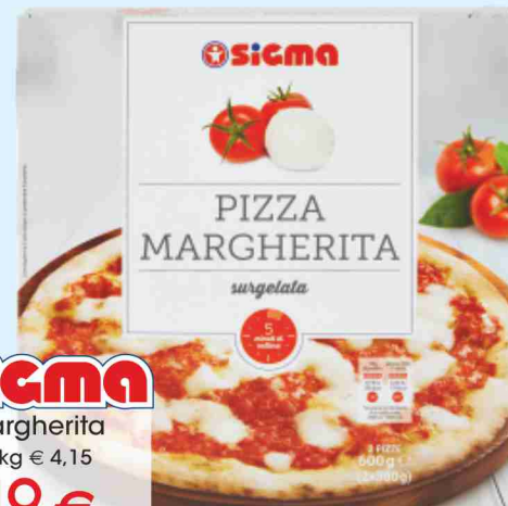
Pizza Margherita g 600 al kg € 4,15