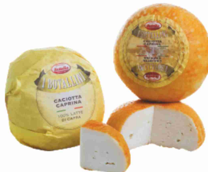
Caciotta caprina Botalla al kg € 19,90