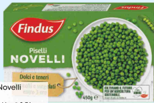
Piselli Novelli Findus g 450 al kg € 3,76