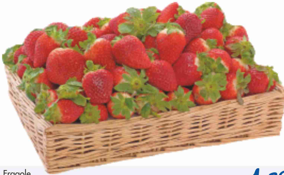
Fragole g 250 al kg € 5,56