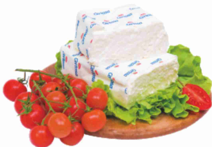
Certosa Galbani al kg € 9,90