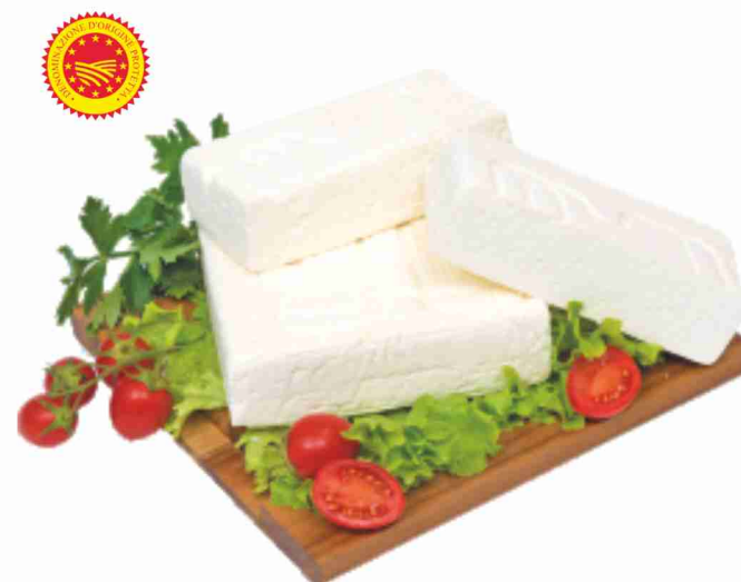
Quartirolo Lombardo D.O.P. Cademartori al kg € 10,90