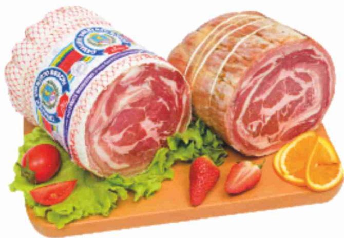
Pancetta coppata magrissima Cav. Umberto Boschi al kg € 16,90